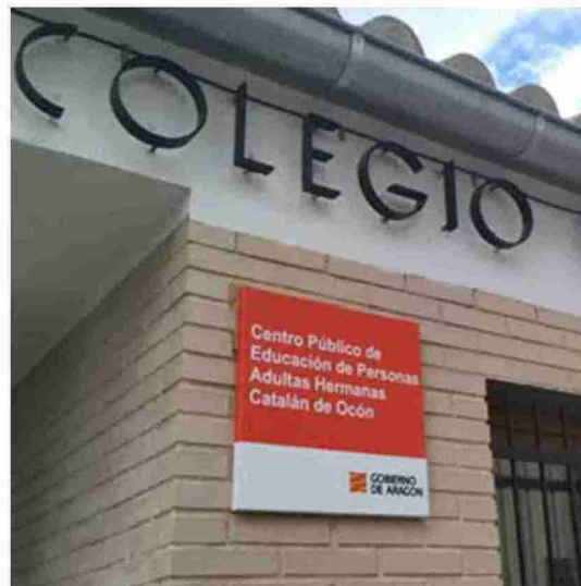
El centro de educación para adultos se encuentra en La Iglesuela del Cid

Además, como cada año, el centro físico, ubicado en La Iglesuela, realiza formación inicial para personas adultas, formación para obtener el título de secundaria, evaluación y acreditación de competencias y tutoriza-