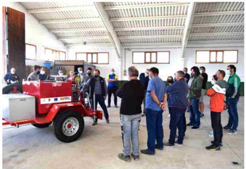
Presentación de los remolques adquiridos por la Comarca del Maestrazgo para los municipios

“Desde hoy, todos los pueblos ya tienen a su disposición un remolque autobomba para usarlo en cuanto lo puedan necesitar.