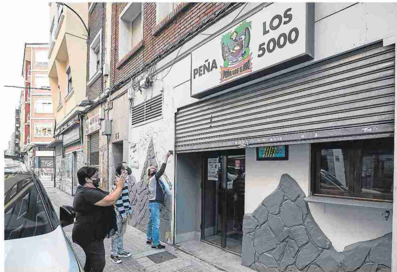
Los peñistas podrán volver a acceder a sus locales a partir de este sábado. GUILLERMO MESTRE

Aunque la contratación volvió «prácticamente a niveles pre-pandemia» en verano, de cara al invierno existía una mayor incertidumbre. «Esto va a ser un paso adelante. El problema es que han quedado muchas orquestas por el