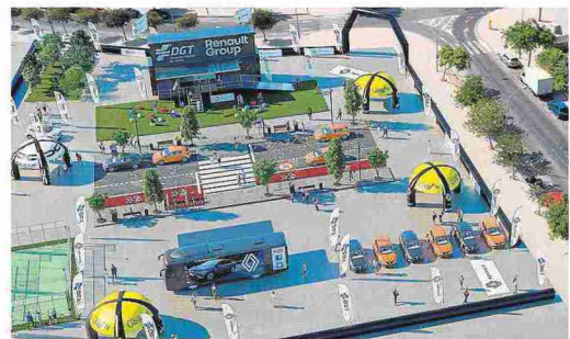
El Urban Roadshow tiene varias propuestas sobre movilidad.

■ 'TECH DRIVE' Existirá la posibilidad de probar los nuevos modelos E-Tech de Renault y descubrir en primera persona cómo se conducen con la ayuda de un monitor especializado.