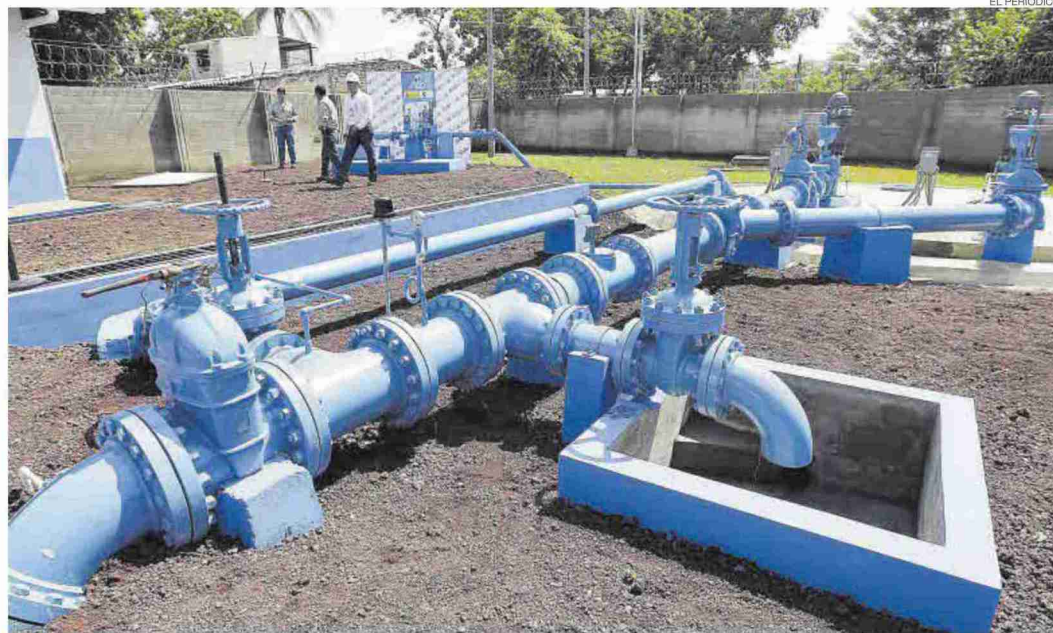
Instalación para la obtención de agua y saneamiento impulsado por la Agencia Estatal de Cooperación.