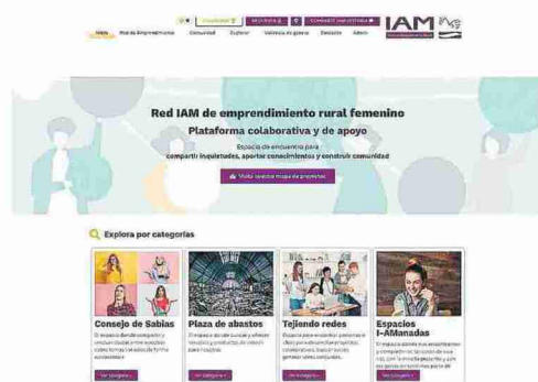
Plataforma web para el emprendimiento femenino. IAM

Las nuevas tecnologías se ponen al servicio de las mujeres rurales para que su salto al emprendimiento disponga de una red. Es el objetivo de la plataforma digital y colaborativa puesta en marcha por el Instituto Aragonés de la Mujer para facilitar el contacto entre las mujeres emprendedoras en las zonas menos pobladas, generar sinergias entre sus proyectos y detectar las necesidades del colectivo.