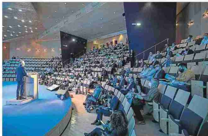
El foro se desarrolla en el Auditorio. GUILLERMO MESTRE

bici o patinete, tanto por sus beneficios para la salud, como para el medio ambiente y la circulación. Por ello, la DGT ha apostado por rebajar el límite de velocidad en calles de un sentido a 30 kilómetros por hora en todo el país, una medida que Zaragoza impulsó hace años. El objetivo, dijo Grande-Marlaska, no es actuar contra el vehículo privado, sino lograr «calles seguras para vivir».