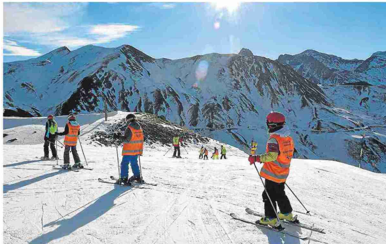
Foto de archivo de escolares participando en la última campaña de esquí financiada por la DPH.

Mientras, en la Ribagorza de momento han trasladado una oferta económica a los centros educativos para calibrar cuántos alumnos estarían interesados en