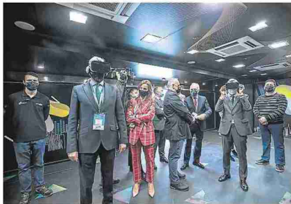
Exhibición de realidad virtual en la feria.