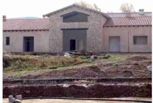
Edificio del centro de mayores de Orihuela del Tremedal

El centro de mayores de Orihuela del Tremedal acogerá a 16 personas internas en 8 habitaciones y un centro de día. "El centro de mayores de Orihuela del Tremedal es una residencia para acoger a validos y dependientes hasta el grado dos y luego será un centro de día con todos sus servicios. El centro de mayores es una figura que está contemplada en la Diputación General de Aragón y por la que se está apostando por ella".