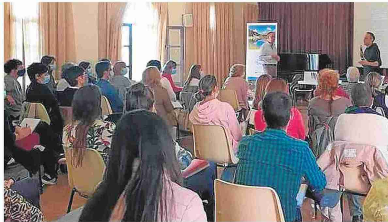
Un centenar de personas participaron en la Jornada contra las Adicciones en Benabarre.

El Consejo Comarcal de La Ribagorza aprobará la estrategia de prevención en noviembre y estará vigente entre 2022 y 2026