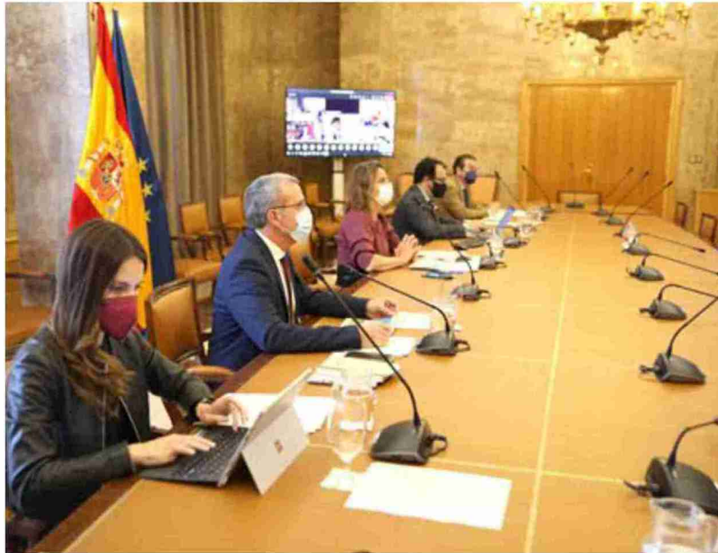
Imagen de archivo de una reunión de la Conferencia Sectorial del Reto Demográfico

Los PGE de 2022 no detallan esa partida de forma específica, sino que recoge en el desglose del