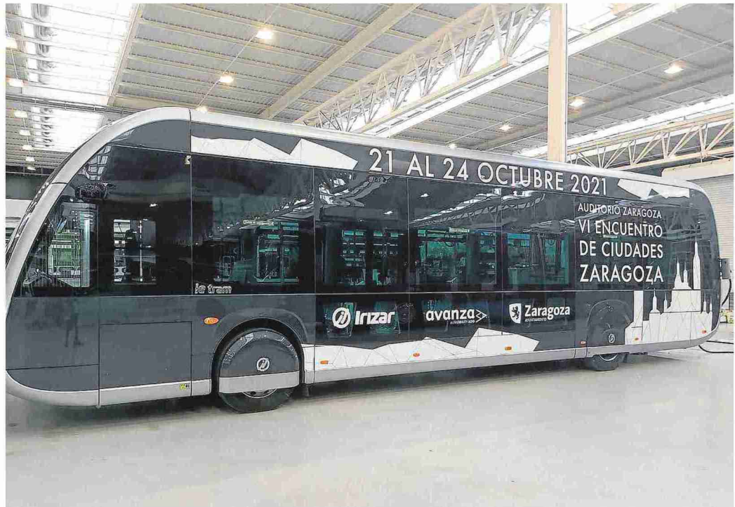
El 'VI Encuentro de ciudades para la seguridad vial y la movilidad sostenible' se configura como un foro de intercambio de experiencias.

Los visitantes podrán conocer algunas de las iniciativas más novedosas que se están llevando a cabo en temas como la movilidad sostenible o la accesibilidad. La