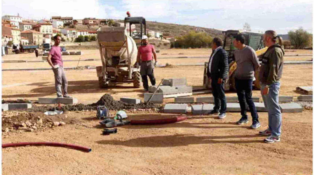
Panorámica del área de aparcamiento y de servicios que se está construyendo a la entrada del municipio de Orihuela del Tremedal

En el proyecto del área de servicios de Orihuela del Tremedal el centro BTT tendrá taller,