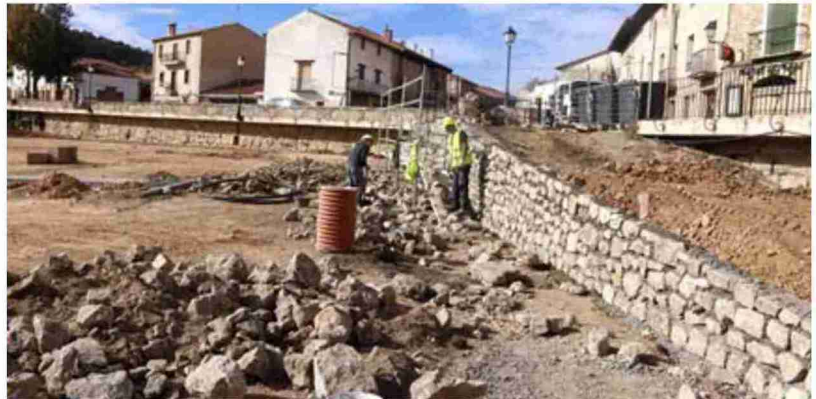
Obras a la entrada del municipio de Orihuela donde irá el aparcamiento de vehículos

duchas, lavado, punto de información de los senderos de la alta Sierra de Albarracín y alquiler de bicicletas. El alcalde comentó que el centro BTT si alguien estuviera interesado pasará a ser gestionado por un particular.