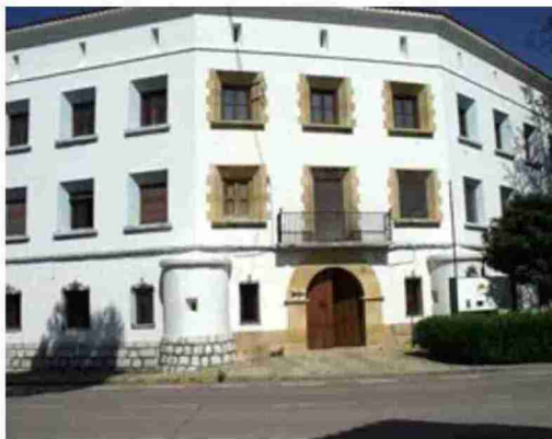
Casa Cuartel de la Guardia Civil de Torrevellilla. Ayuntamiento de Torrevellilla