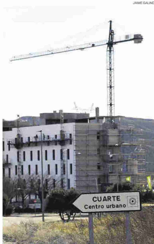
Un bloque de edificios en construcción en Cuarte.

Por el contrario, la localidad con menos renta media bruta de las tres provincias es Fabara (Zaragoza), con 17.057 euros. Deja el farolillo rojo Ricla, que en el 2018 cerraba la clasificación. En la provincia de Huesca, Zaidín ocupa el