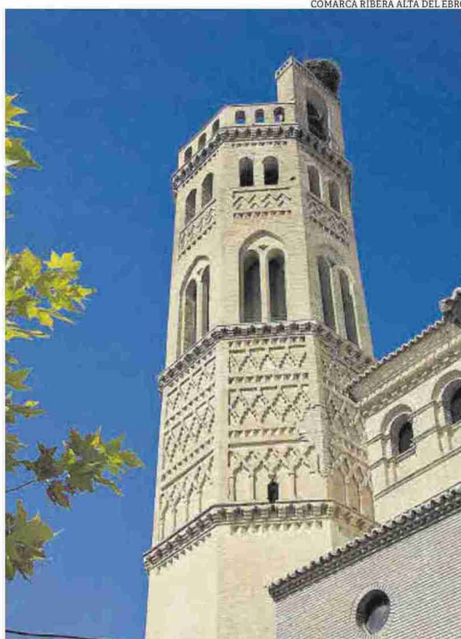
Mudéjar. Iglesia de San Pedro Apóstol de Alagón, Bien de Interés Cultural.

presentó la escena de la Exaltación del Nombre de Jesús. Pocos años más tarde realizó una intervención en la Iglesia de San Juan Bautista de Remolinos. Allí, Goya pintó las cuatro pechinas que decoran la cúpula sobre el crucero en las que se encuentran los padres de la Iglesia: San Ambrosio, San Agustín, San Jerónimo y San Gregorio.