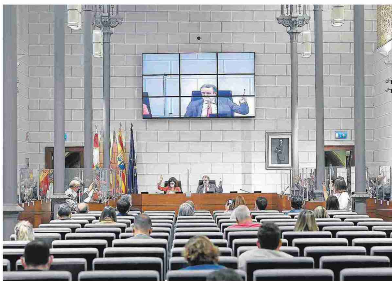
El plan Agenda 2030 se aprobó en el pleno del pasado jueves. DPZ

ESTA LÍNEA EXTRAORDINARIA DE SUBVENCIONES VA A PERMITIR QUE LOS 292 AYUNTAMIENTOS DE LA PROVINCIA FINANCIEN ACTUACIONES ORIENTADAS A CUMPLIR LOS OBJETIVOS DE DESARROLLO SOSTENIBLE