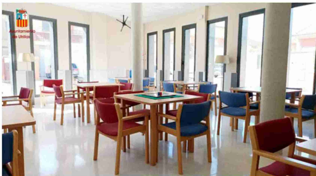
El centro de día y hogar de mayores de Utrillas abrirá sus instalaciones el próximo 25 de octubre y tiene una capacidad en total de 75 plazas

El centro de día y hogar de mayores de Utrillas lo gestionará una empresa de Castellón, que va a abrir las instalaciones del centro de día y hogar de día todos los días, incluidos los fines de semana. "Si entre semana el centro de día estará abierto de 8 de la mañana a las 20 horas durante el fin de semana el horario será un poco más reducido, por ejemplo de