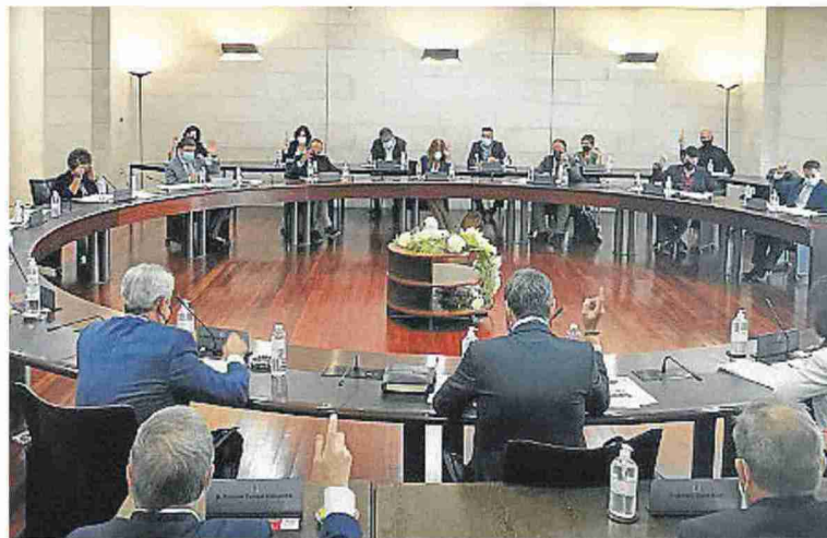
Imagen del pleno celebrado ayer en la Diputación Provincial de Huesca.

Por otra parte, el pleno de la institución provincial mostró de manera unánime, a partir de una propuesta de resolución presentada por el PP, su recha-