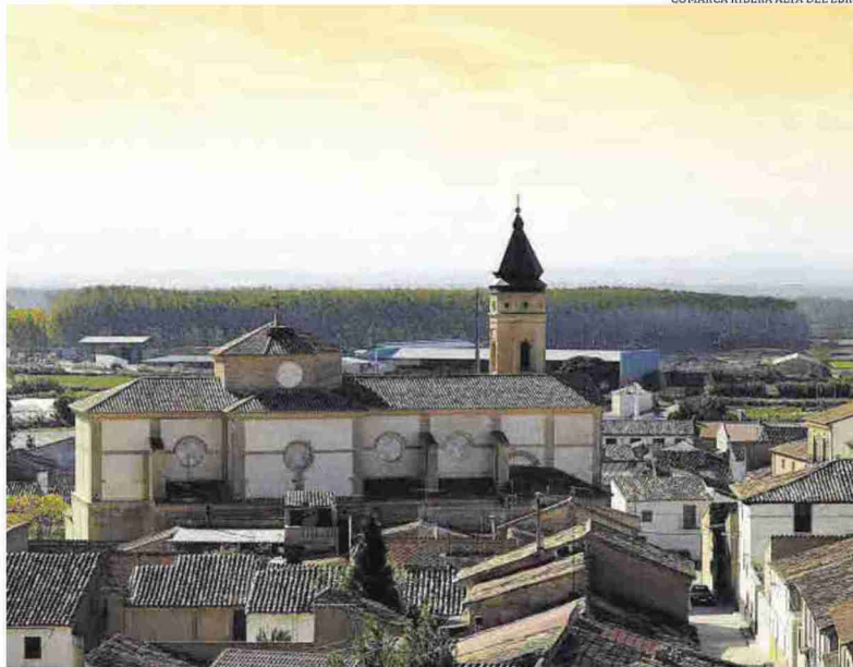
Goya. El genio dejó su huella en la iglesia de San Juan Bautista de Remolinos y en la Casa de Cultura de Alagón.