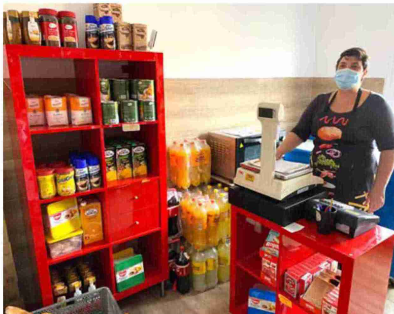
La gestora del multiservicio de Cuevas Labradas, ayer por la mañana en la zona habilitada como tienda