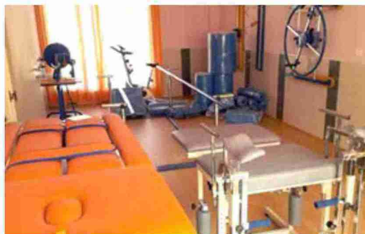
El centro de día está equipado para ofrecer servicios de fisioterapia y gimnasia

9 a las 17 horas", comentó el primer edil de la localidad minera.