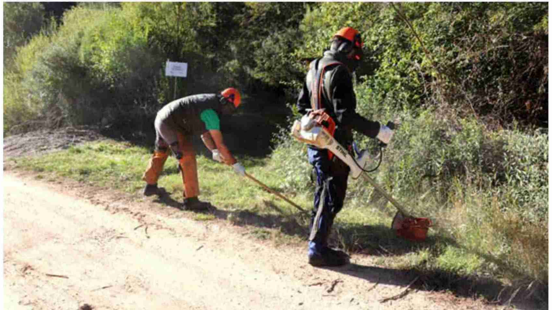
Los trabajos de mantenimiento de la red de senderos de Gúdar-Javalambre se han iniciado en la PR-29 entre Alcalá a Gúdar, Valdellinares, Linares y Alcalá

El presidente de la Comarca de Gúdar-Javalambre afirmó que el anterior convenio con Agujama y el Inaem para el mantenimiento de la red de senderos dio buen resultado y este año hay una continuidad. "La valoración que tenemos es muy positiva", aseguró.