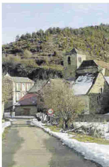
La localidad de Fago, nevada.

Para ello, instalarán los llamados Marcos REDR ODS, unas estructuras que permanecerán en cada territorio por un periodo mínimo de cinco años y que representarán uno de esos objetivos específicos que se persiguen, en función de los recursos endógenos de la comarca autónoma en la que se encuentra.