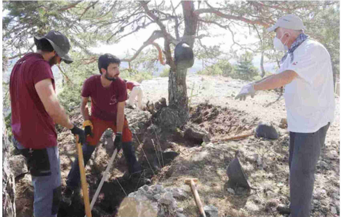
Primeras labores de exhumación de soldados republicanos en las trincheras de la Guerra Civil en La Muela de San Juan en Griegos