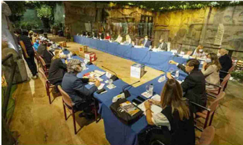
Directores generales de Comercio de toda España acudieron ayer a la mesa sectorial celebrada en Teruel.