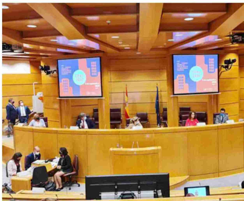
La alcaldesa de Teruel, Emma Buj, durante su intervención ayer en el Senado

Respecto a las iniciativas llevadas a cabo en la capital turolense, Buj reivindicaba el papel de las pequeñas y medianas ciudades que ofrecen una alta calidad de vida a sus vecinos a la vez que recordaba las actuaciones re-