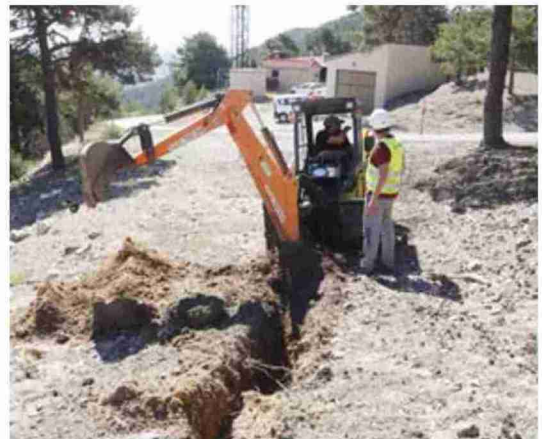
El trabajo de la excavadora ayudó a localizar los primeros restos de soldados

San Juan, un número que estimó Sánchez entre 10 y 20 militares.