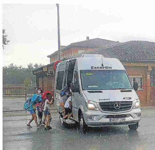
El convenio por el transporte tiene presupuestados 527.000 euros.

dar servicio a los alumnos de Infantil, Primaria, Secundaria, Bachiller y Grados Formativos del territorio. Este año, el operativo cuenta con 26 rutas que dan servicio a 280 alumnos de 42 localidades de este territorio. "El servicio, al prestarlo desde la cercanía, permite atender mejor las necesidades que tienen los escolares y realizar una coordinación más precisa entre el transporte y los centros escolares", según comentan fuentes de la Comarca.