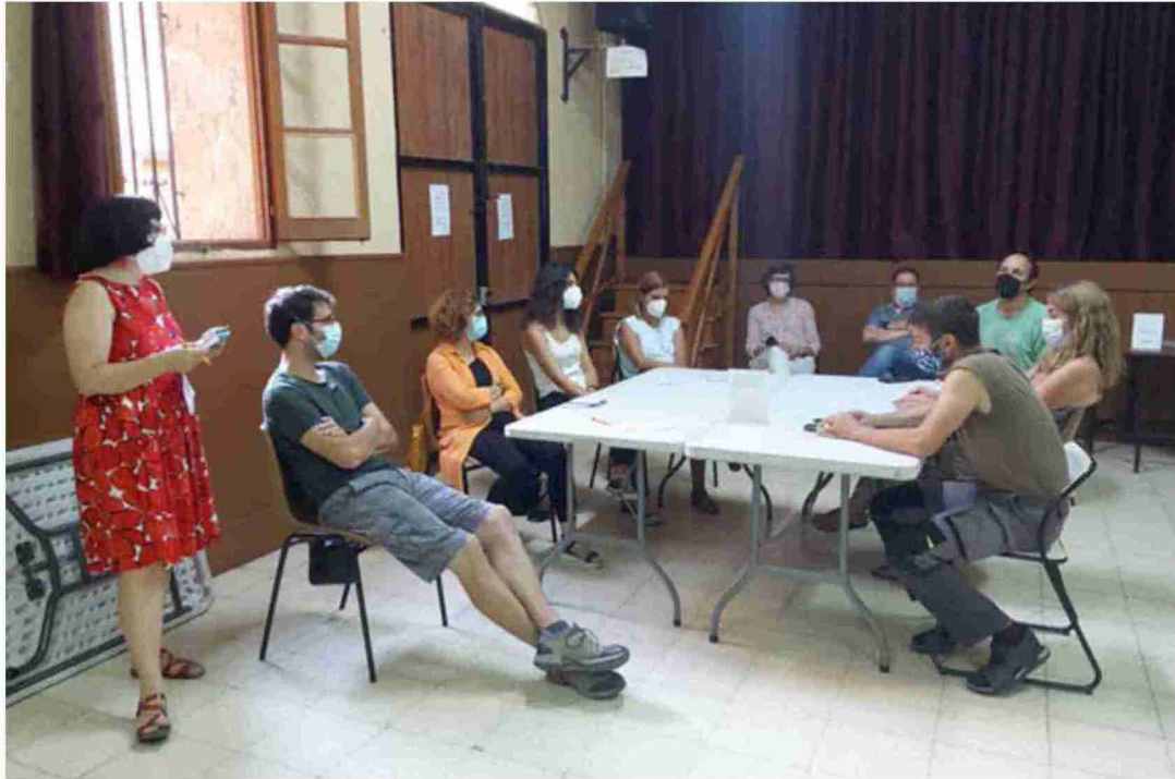
Asistentes a las jornadas preparatorias celebradas ayer por la tarde.