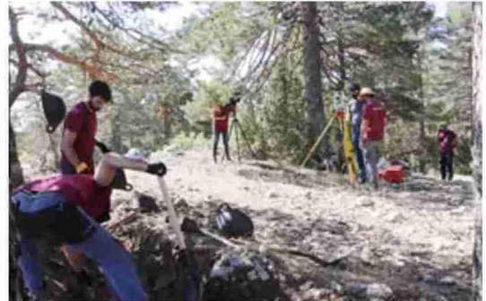
Panorámica de los trabajos de exhumación en La Muela de San Juan