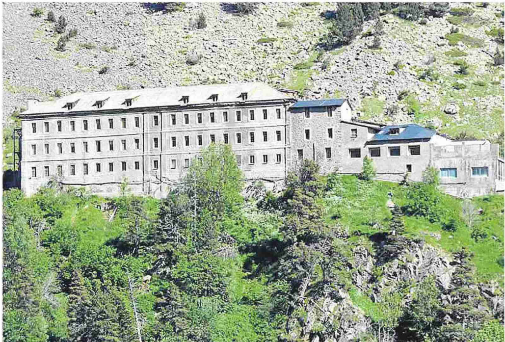
El actual recinto termal de los Baños de Benasque, cuya fecha de construcción está datada en 1801.

En este sentido, explica que hubo una empresa de Benasque que ejerció su derecho y propuso una acción y un estudio económico. "Como ascendía a 9 millones y medio, salió a pública concurrencia en el Boletín Oficial Europeo, que es donde se ha de exponer si su-