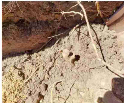
Primeros restos de huesos de soldados republicanos en La Muela de San Juan