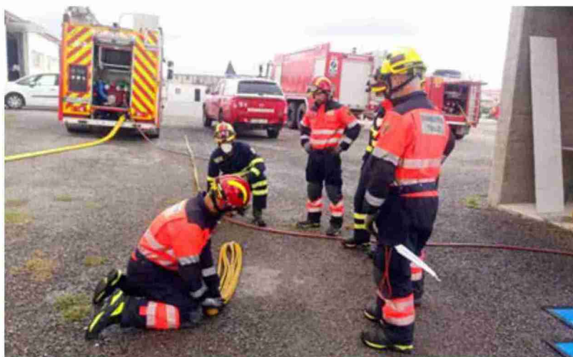
Formación de bomberos interinos en incendios estructurales en el parque de Teruel

Los bomberos interinos han recibido formación específica, impartida por personal propio del Servicio de Prevención y Ex-