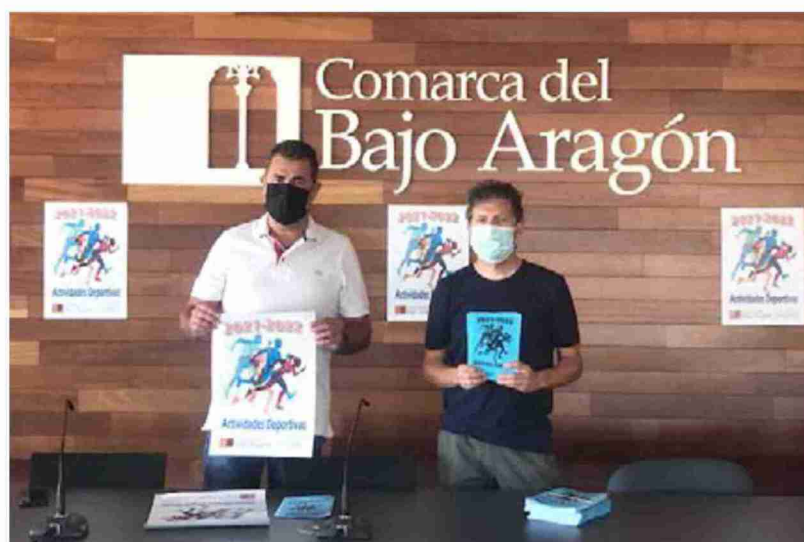
Presentación de las actividades deportivas de este curso en la Comarca del Bajo Aragón.

Según explicó el consejero de Deporte de la institución comarcal, como todos los años se han preparado actividades para esco-