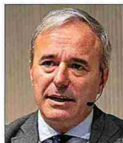
Jorge Azcón.