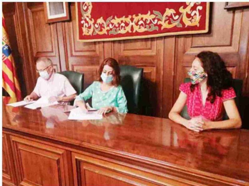
Un momento de la firma del convenio entre la alcaldesa de Teruel y el director de Cáritas Teruel, ayer en el salón de plenos

Buj reconoció que Teruel es una ciudad acogedora pero todavía hay personas que no tienen todas las necesidades cubiertas y para paliar esta situación se firma este convenio. La alcaldesa recordó además que se alinea con uno de los Objetivos