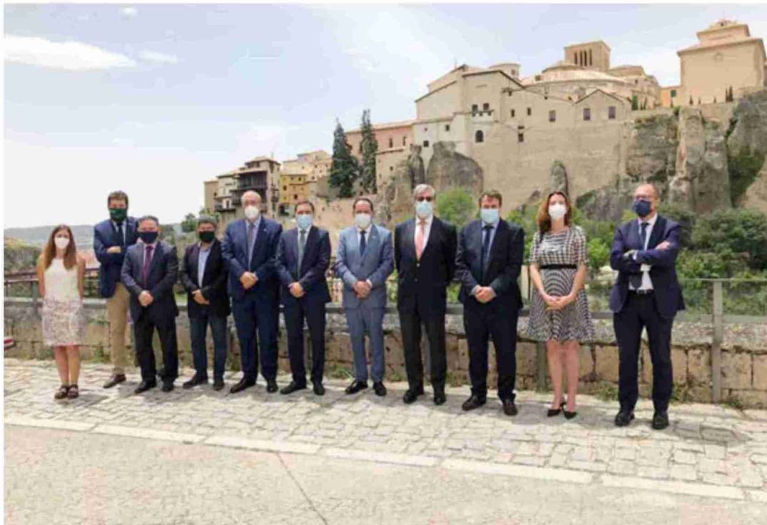
Los presidentes de las tres diputaciones provinciales y de las organizaciones empresariales de Teruel, Cuenca y Soria, ayer tras suscribir el acuerdo