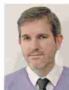
Antonio Amador Alcalde Andorra

«Todavía no se han establecido los criterios desde Bruselas. Es pronto para adelantar ningún proyecto»