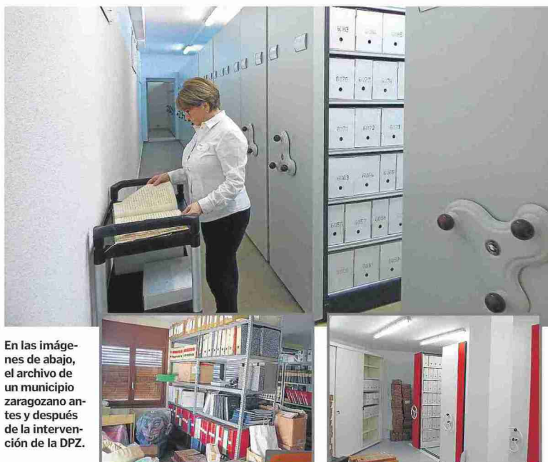
En las imágenes de abajo, el archivo de un municipio zaragozano antes y después de la intervención de la DPZ.

DESDE 1983, LA DPZ HA AYUDADO A ORGANIZAR Y MANTENER LOS ARCHIVOS DE MÁS DE 200 MUNICIPIOS Y HA CONTRIBUIDO A LA CATALOGACIÓN DE MÁS DE 1.150.000 DOCUMENTOS