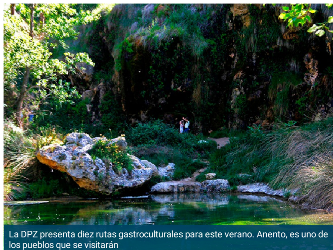
La DPZ presenta diez rutas gastroculturales para este verano. Anento, es uno de los pueblos que se visitarán