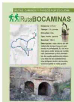
Detalle de la ruta Bocaminas