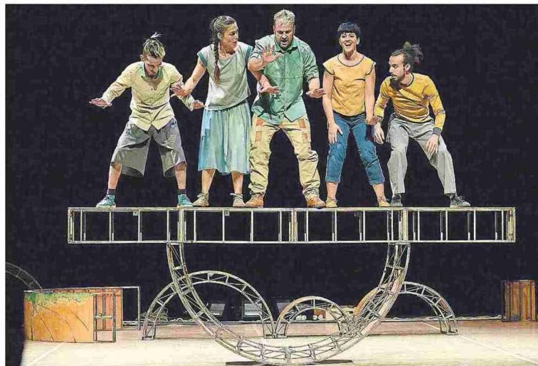
Vaivén, Premio Nacional de Circo 2016, es el gran aliciente del festival Jacetania Circus.

La cita comenzará el día 3 en Ansó con el francés Michel Etxecopar y el vasco Xabi Solano, "la figura que más sobresale en esta edición, siendo un lujo tenerlo",