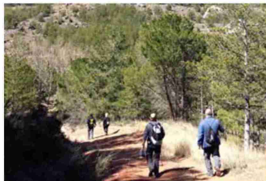
Una de las rutas realizadas

forman parte de la riqueza paleontológica del entorno.