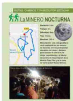
Una de las páginas de la guía