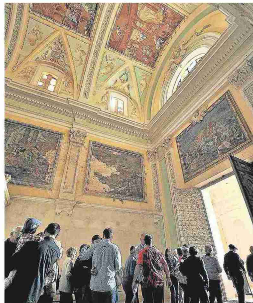
Aspecto de los frescos de la iglesia de la Cartuja de las Fuentes.

Antes de su paso a manos públicas, el enclave acumulaba varias décadas en declive, que hicieron mella en la estructura del edificio así como en el conjunto pictórico. Dentro de la iglesia, los lienzos de las paredes son los que más acusan el estado de abandono al que estuvo sometido el conjunto, presentando grandes desconchones.