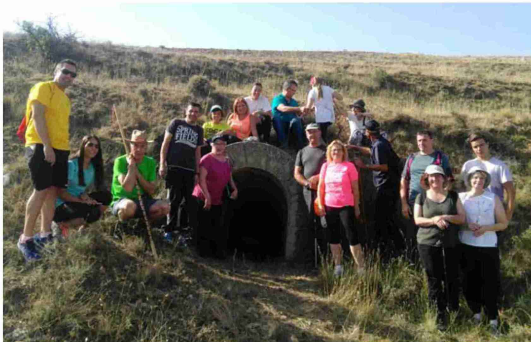
Marcha a bocaminas realizada en el verano del año 2018

Sin embargo, no solo se abordan aspectos relacionados con la minería sino que también se suman apuntes históricos como el poblado ibérico del Castillo, la presencia carlista en la Sierra de San Just, las trincheras en la guerra civil o la leyenda del tío Greñicas. También se dedica un apartado a conocer la micología de la zona, árboles y arbustos, plantas silvestres comestibles o la parte de la fauna más reconocible de las aves con especial mención a la abubilla o burbute, apodo que distingue a los naturales de Escucha. Entre las páginas se hace alusión al recetario más antiguo, se recoge alguna tradición importante como la romería a la ermita de San Just o se muestran los fósiles más comunes que