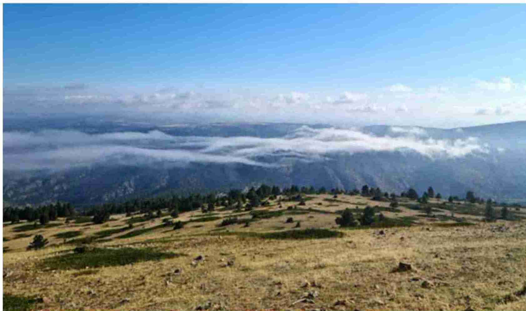
La gran riqueza natural es lo que ha pesado para que Camarena de la Sierra pase a formar parte del Corredor Biológico Mundial

El Corredor Biológico Mundial es un proyecto internacional