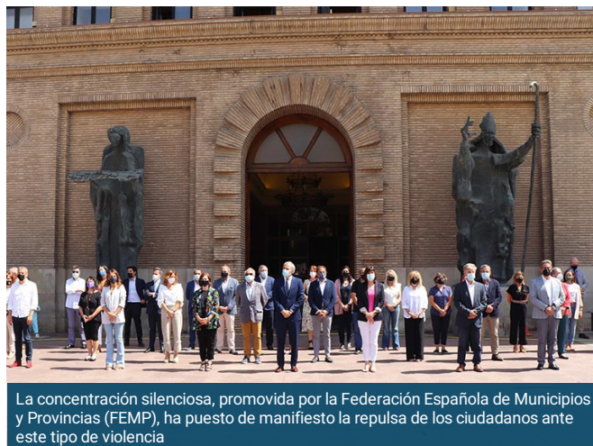
La concentración silenciosa, promovida por la Federación Española de Municipios y Provincias (FEMP), ha puesto de manifiesto la repulsa de los ciudadanos ante este tipo de violencia

La ciudad de Zaragoza se ha sumado este lunes a las concentraciones que han tenido lugar por todo el país en contra de la violencia machista tras los recientes acontecimientos sucedidos. Con un minuto de silencio a las 12.00 horas, decenas de ciudadanos espontáneos, junto a miembros del Ayuntamiento zaragozano, han querido mostrar su apoyo y solidaridad a las familias y amigos de las últimas víctimas de esta lacra.