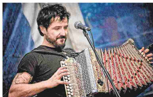
El músico vasco Xabi Solano es la figura más destacada del PIR, en cuyo marco mostrará su talento el día 3 de julio en Ansó.

Una de las novedades de la programación de verano son las Veladas de Arte y Naturaleza tituladas 'Guirandada y el bosque' y creadas por Nacho Arantegui, que se van a desarrollar del 22 al 24 y del 29 al 31 de julio en Villanúa, a razón de dos pases diarios (para un máximo de 50 personas), a las 21:30 y 23:30 horas