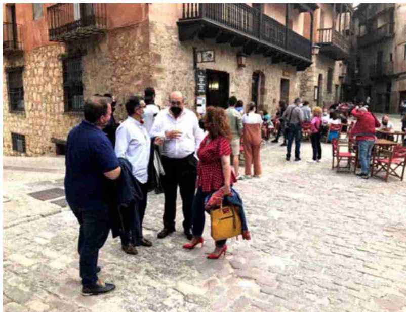
El presidente Rando y al alcalde y concejales de Albarracín al lado de un establecimiento hostelero de la localidad

El presidente pidió además la participación decidida de los ayuntamientos en el plan de ayudas, que permitirá alcanzar el importe máximo, los 50 millones de euros, con el que debería estar dotado. "El plan contempla la aportación del Gobierno de Aragón, con 30 millones, las diputa-