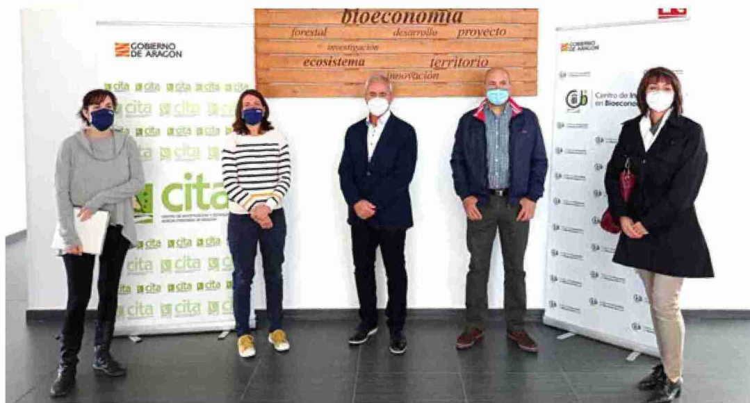
Representantes de la comarca Comunidad de Teruel visitaron recientemente las instalaciones del CITA. Comunidad de Teruel

En este sentido, los responsables comarcales destacaron en su visita la oportunidad que supone "poder ofrecer a los empre-