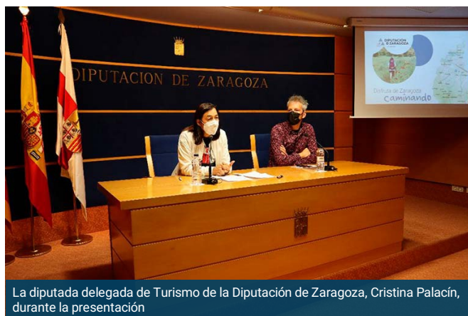
La diputada delegada de Turismo de la Diputación de Zaragoza, Cristina Palacín, durante la presentación

El interés por las rutas senderistas de Zaragoza va en aumento y los visitantes que cada fin de semana recorren caminos para descubrir la riqueza natural de la provincia, no cesan. Y ahora, podrán hacerlo de la mano de guías profesionales. La DPZ ha lanzado una nueva propuesta turística: un total de trece rutas senderistas guiadas que permitirán recorrer “a lo largo y a lo ancho” toda Zaragoza y sus alrededores, un plan ideal para disfrutar en familia.