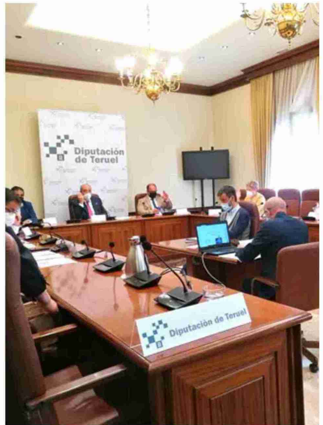
El pleno de ayer fue el primero presencial desde el inicio de la pandemia

Las ayudas de la Diputación servirán para subvencionar los gastos derivados de la alimentación de las reses, del transporte de los animales en el caso de que los mismos realicen trashumancia y los gastos veterinarios derivados de los tratamientos sanitarios de las reses. Ayer también se aprobó por unanimidad al Programa plurianual 2021-2022 para