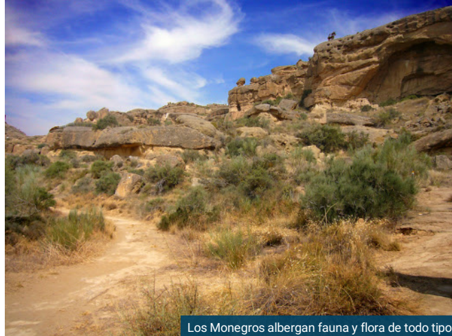
Los Monegros albergan fauna y flora de todo tipo

La Red de Parques Nacionales podría contar con un invitado de última hora: las Estepas de Monegros. Sus secarrales llenos de biodiversidad, esas especies únicas en todo el mundo y en peligro de extinción, como las avutardas, el sisón o la llamada paloma del desierto, la fauna y la flora... Todos sus argumentos naturales han convencido a SEO/BirdLife para que apueste por estas 28.000 hectáreas y catapulte a Aragón a ser referente de estos ecosistemas.