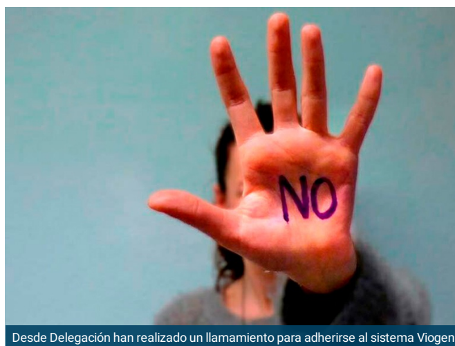
Desde Delegación han realizado un llamamiento para adherirse al sistema Viogen

Huesca, Calatayud y en próximas fechas Pinseque. Son los tres municipios de la Comunidad Autónoma de Aragón que están adheridos al sistema Viogen, que pretende coordinar las bases de datos de Policía Local y Policía Nacional para reforzar la lucha contra la violencia de género. Una cifra baja que sorprende a Delegación del Gobierno en Aragón y que llama la atención por la ausencia por ejemplo de la capital aragonesa.