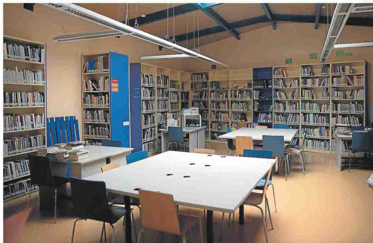
La promoción de la lectura, entre los objetivos de las subvenciones.

El objetivo, por tanto, es garantizar servicios en municipios pe-