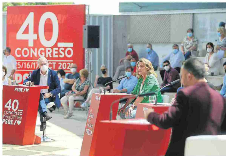
La ministra Teresa Ribera durante una de sus intervenciones en el acto de ayer en Huesca. PABLO SEGURA

La ministra apostó por «recuperar el equilibrio en los retos demográficos, porque no hay un solo desafío, sino varios, pero este es la cara visible de todos ellos». Según detalló, hay elementos es-