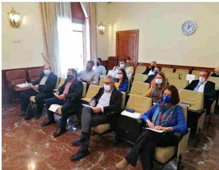
Los diputados provinciales, excepto los portavoces y el equipo de gobierno, se sentaron ayer en los asientos del público

El 26 de febrero se publicó en el Boletín de la Provincia la información de la cuantía nominativa de las subvenciones con cargo a la convocatoria de la DPT, con el listado de todos los municipios, la previsión del dinero para cada uno de ellos y el detalle por barrios.