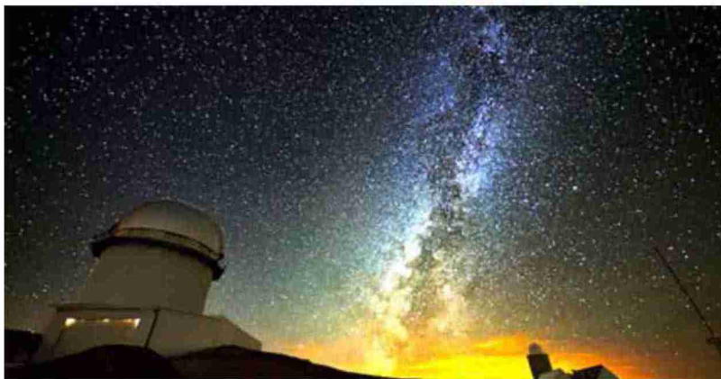
La Comarca de Gúdar-Javalambre se distingue por la calidad de su cielo y, por lo tanto, para la observación.

Gúdar-Javalambre consiguió la distinción en 2017 con el objetivo de potenciar el astroturismo