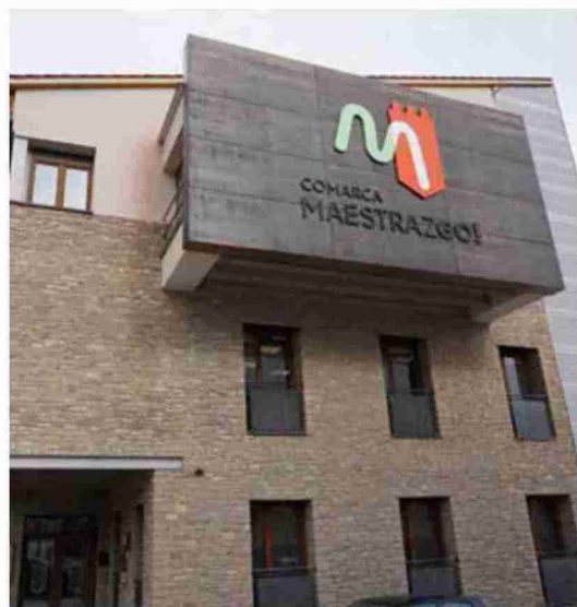
Sede de la Comarca Maestrazgo

Con este futuro parque de bomberos, se cubriría la demanda del servicio además de acortar distancias para llegar a otros municipios.