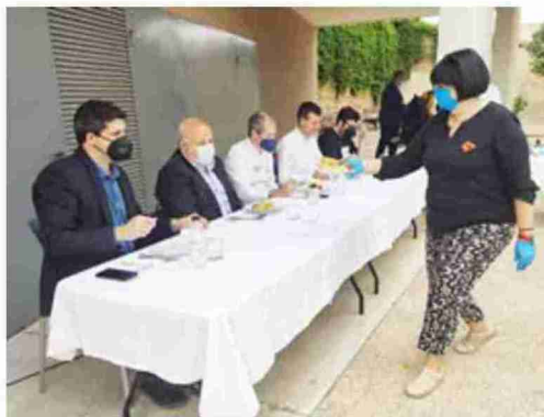
El jurado degusta los platos presentados por las finalistas. Diego Martínez

El concurso, coordinado por las amas de casa de Ariño, se ha celebrado con el fin de fomentar la participación de los vecinos en la recopilación de platos típicos de la zona.