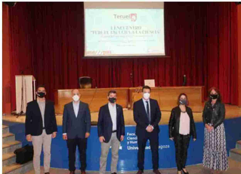
Autoridades y ponentes en I Encuentro con la Ciencia que se celebró en el salón de actos de la Facultad de Ciencias Sociales