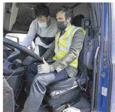
► El líder del PP, probando un camión en la TMZ.