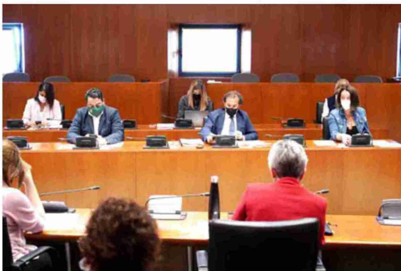
Comisión de Hacienda, Presupuestos y Administración Pública celebrada ayer en el Parlamento. Cortes de Aragón

Las directrices de la Comisión Europea autorizan al Gobierno de España a conceder esas ayudas al funcionamiento en las tres provincias, así como en aquellos