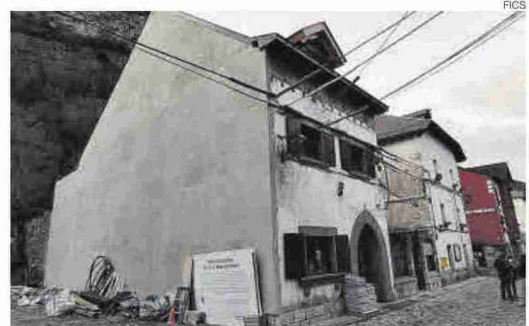
► La antigua casa del cura será la sede del nuevo albergue.