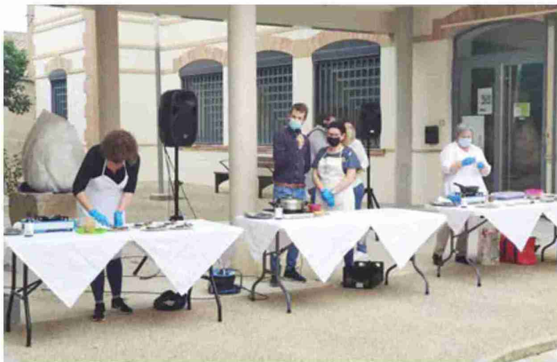
Las cocineras se esmeran en la elaboración de sus platos. Diego Martínez

"No podemos plantearlo como venir a comer a un 3 Estrellas Michelin, pero sí como espacio de aprendizaje. Si la alcachofa se cultiva aquí, le damos buen trato culinario y lo hacemos saber tenemos mucho ganado. Es un tipo de turismo experiencial con una alta carga didáctica y demanda entre familias y jóvenes" para el que "no hace falta una inversión exagerada" sino tan solo "promocionar a nivel interior y empe-