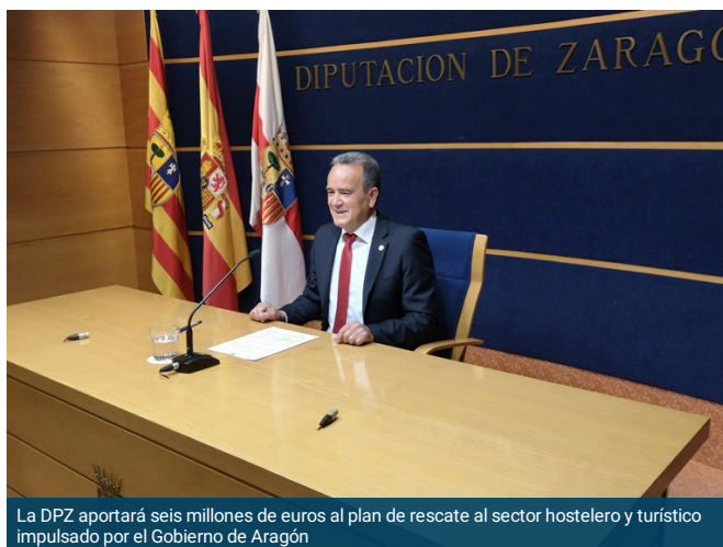
La DPZ aportará seis millones de euros al plan de rescate al sector hostelero y turístico impulsado por el Gobierno de Aragón

La Diputación Provincial de Zaragoza (DPZ) ha aprobado este miércoles en el Pleno una modificación presupuestaria cercana a los 47 millones de euros gracias a la cual la institución incorporará a sus cuentas algo más de 41 millones procedentes del remanente de tesorería acumulado durante los últimos años. Dentro de las ayudas, destacan los 28,5 millones para que los municipios realicen inversiones en línea con la Agenda 2030, así como los más de 6,5 millones destinados a apoyar a la hostelería y al turismo de la provincia zaragozana.