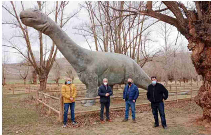
El Aragosaurus ha sido restaurado por la Fundación Dinópolis y financiado por la Comarca Comunidad de Teruel

Por otro lado, la actuación se ha completado con la instalación de un panel informativo por parte de la Comarca, en la zona en la que están instaladas las distintas recreaciones a tamaño real de va-