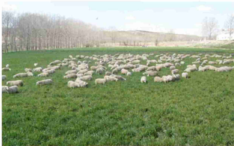
Imagen de un rebaño de ovino de la provincia de Teruel

Estos y otros detalles de la convocatoria, así como los requisitos exigidos y el plazo, lugar y presentación de las solicitudes y los documentos que se acompañarán pueden consultarse en el Boletín Oficial de la Provincia, informó la Diputación de Teruel.