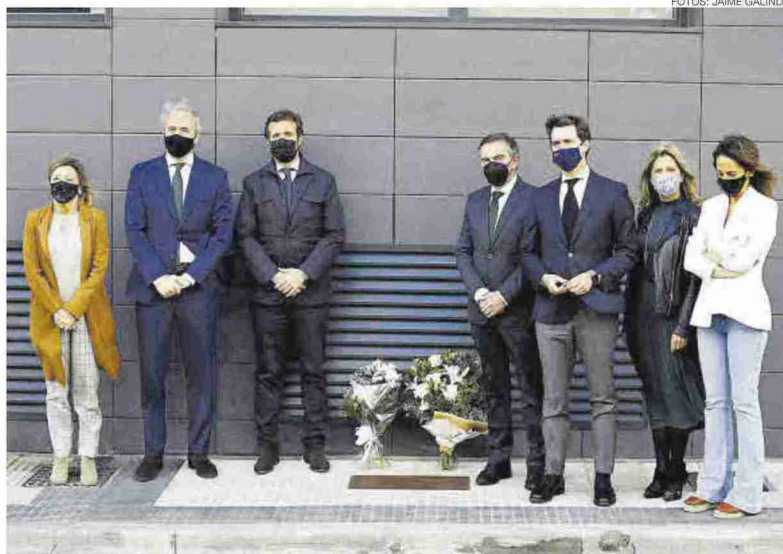
► El líder del PP, Pablo Casado, junto a Azcón y Beamonte, tras depositar unas flores en recuerdo a Giménez Abad.

Aprovechando su diálogo con algunos transportistas, el líder del PP les transmitió estar «completamente en contra» de los peajes. «Ya anuncio que vamos a hacer una auténtica ofensiva legal y parlamentaria», expresó poco después de que Azcón subrayase un mensaje «fundamental» de una ciudad «abierta a la creación de empleo». «Hemos invitado a Pablo Casado para que explique en toda España lo que estamos haciendo en Zaragoza, por ejemplo con los más de 12 millones de euros en la nueva infraestructura de la terminal marítima. Zaragoza «es una ciudad abierta a la inversión, el empleo y el crecimiento de la riqueza».