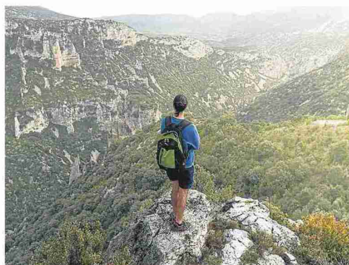
Imagen promocional del valle de Rodellar del Área de Turismo de la Comarca del Somontano.

La campaña que se presentará el miércoles, a las 16:30 horas, a cargo de la vicepresidenta María Jesús Morera, consejera de Turismo, consiste en un vídeo sobre el valle y la puesta en marcha del espacio propio en la página web www.turismosomontano.es con las actividades y recursos turísticos de la zona. Se traduce a inglés, francés, alemán y holandés con acceso a toda la información práctica necesaria para planificar estancias. La difusión del vídeo será por redes sociales en castellano, inglés y francés con