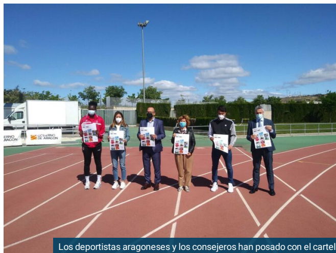
Los deportistas aragoneses y los consejeros han posado con el cartel