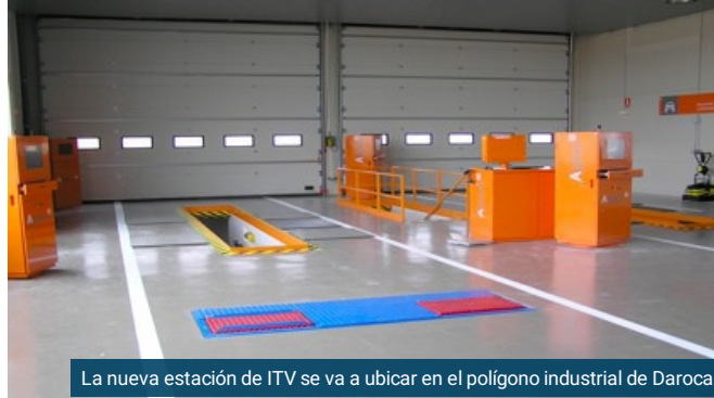
La nueva estación de ITV se va a ubicar en el polígono industrial de Daroca

El Departamento de Industria, Competitividad y Desarrollo Empresarial, dentro de la estrategia de desarrollo de la política de mejora de los servicios públicos en las comarcas de Aragón, ha impulsado la construcción de una nueva estación de inspección técnica de vehículos (ITV) en el municipio de Daroca. Esta estación será construida y gestionada por la empresa concesionaria del servicio de ITV en la zona, Aragonesa de Servicios ITV, S.A. y está prevista su puesta en servicio a finales de 2021.