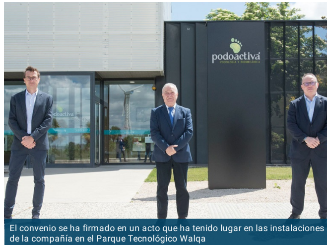
El convenio se ha firmado en un acto que ha tenido lugar en las instalaciones de la compañía en el Parque Tecnológico Walqa

Podoactiva continúa apostando por la innovación y la tecnología como palancas de crecimiento y refuerza su apoyo al tejido provincial oscense. La compañía líder en podología y biomecánica ha firmado un convenio con Mobile World Capital Barcelona y la Diputación de Huesca para el desarrollo de diversas soluciones que impulsarán la implementación de la tecnología 5G en la provincia y el acceso a la misma por parte de instituciones, empresas y ciudadanos.