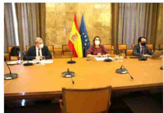
La ministra Teresa Ribera ayer durante la Conferencia Sectorial telemática

que el Plan de 130 medidas “es un documento ejecutivo para una cuestión concreta que son los fondos de recuperación Next Generation”. Allué opinó que “parece que queda clara la voluntad meridiana del Gobierno de establecer una política transversal para el reto demográfico para la lucha contra la despoblación”. Teresa Ribera expresó nuevamente la intención de que la Estrategia sea aprobada por la Conferencia de Presidentes.