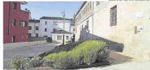
COMARCA DE LA RIBAGORZA

Este símbolo se ubicará en la plaza Sebastián Romero Radigales de Graus, espacio que rinde tributo al diplomático grausino que logró salvar del Holocausto a centenares de judíos griegos durante la