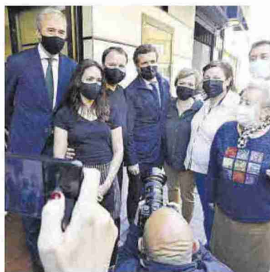
► Casado posa con vecinos de la calle Cortes de Aragón.