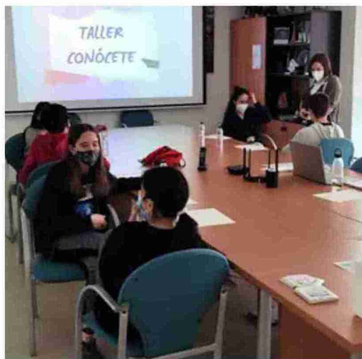
Taller de autoconocimiento celebrado en Híjar. Comarca del Bajo Martín

"Este curso puede ser una puerta al mundo laboral y también un complemento formativo excelente para carreras como magisterio, trabajo social o educación social", indica la Comarca. Los jóvenes aprenderán a organizar grupos, trabajar en equipo, ser creativos, hablar en público, transmitir valores o despertar la creatividad.