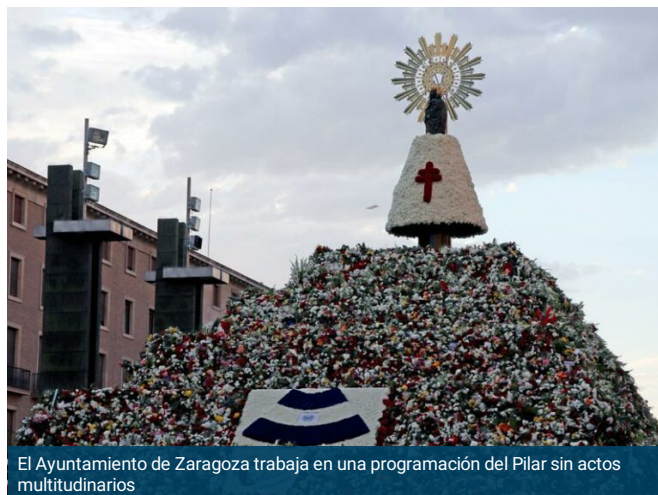
El Ayuntamiento de Zaragoza trabaja en una programación del Pilar sin actos multitudinarios

GUILLERMO PEMÁN PORTELLA · 10 MAYO, 2021