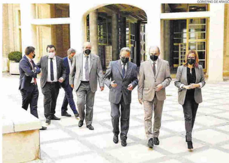
El presidente Javier Lambán, ayer con la consejera Mayte Pérez y los presidentes de las diputaciones.

El programa abarca actuaciones para la rehabilitación convencional y para la orientada a la eficiencia energética, que es clave para contribuir a reducir el consumo y con él, los costes y la emisión de gases de efecto invernadero. También contempla la construcción de viviendas sociales para el alquiler.