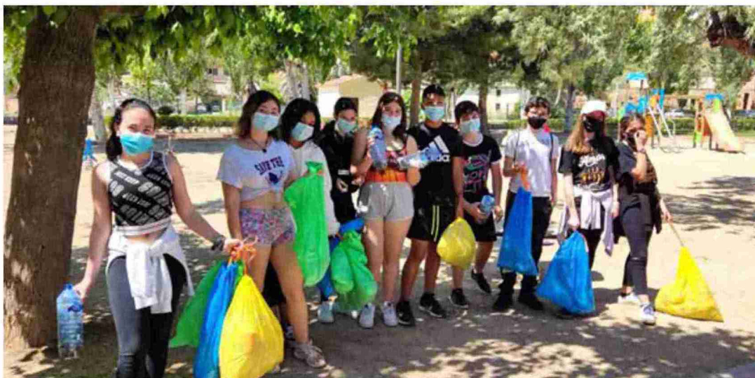
Los jóvenes de la Comarca del Bajo Martín recogen la basura de la ribera, el sábado pasado en Albalate. Comarca del Bajo Martín

La actividad finalizó con una sesión de juegos y una comida de hermandad tras la que los parti-