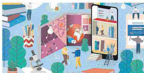
La comunicación en el márketing bibliotecario, en un curso 'online' organizado por la DPH.