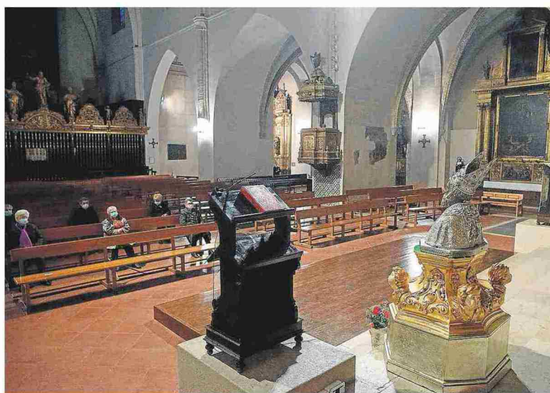
El interior de la iglesia de San Pablo, ayer. FRANCISCO JIMÉNEZ

ZARAGOZA. Los municipios de la Comunidad están «expectantes» ante la posible suspensión de las fiestas patronales más allá del 31 de mayo. Hasta ese día, los actos están cancelados por orden del Gobierno de Aragón, pero ¿qué ocurrirá a partir de entonces?