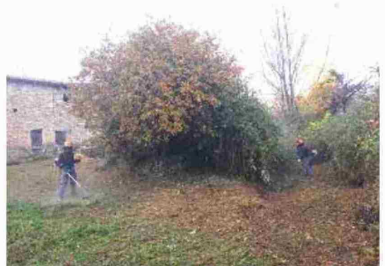
Labores de desbrozamiento en el municipio de El Castellar