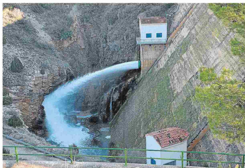
El pantano desembalsa a un ritmo de 3,5 metros cúbicos por segundo tras llenarse con Filomena. J. E.