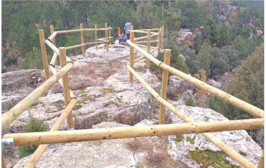
El taller de empleo "Despertando paisajes" ha realizado numerosas actuaciones en Alcalá, El Castellar, Cabra y Gúdar. En la imagen un mirador en Cabra de Mora