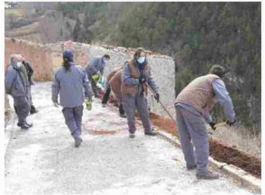
Trabajos de plantación de un seto en la subida al castillo de Alcalá de la Selva