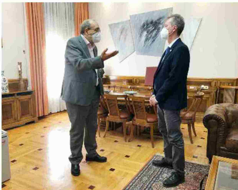
El presidente de la Diputación de Teruel y el vicerrector de la Universidad de Zaragoza en Teruel, tras la reunión de ayer

De hecho, señaló que el presupuesto en vigor contempla 20.000 euros para este fin, un 25% más de lo que se había consignado en el ejercicio anterior.