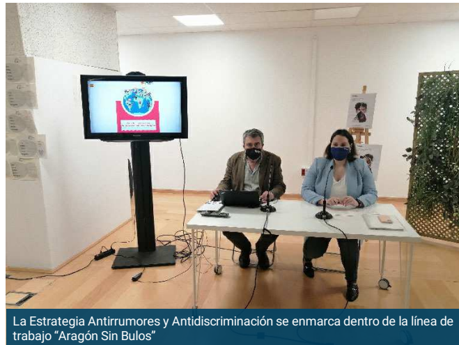
La Estrategia Antirrumores y Antidiscriminación se enmarca dentro de la línea de trabajo "Aragón Sin Bulos"

Un Aragón sin racismo y un giro hacia nuevas narrativas sobre la inmigración sin estigmatizaciones ni desinformación. Esto es lo que busca la nueva "Guía Antirrumores y Antidiscriminación" lanzada por el departamento de Ciudadanía y Derechos Sociales del Gobierno de Aragón. Una guía dirigida al ámbito educativo y social que, a través de pautas y contenido práctico, informa y aconseja sobre cómo luchar contra la lacra del racismo.