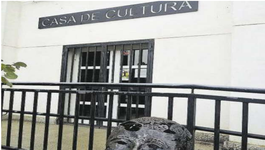
El consistorio hará una mejora de eficiencia energética en el centro. - SERVICIO ESPECIAL

El consistorio desea crear un parque fluvial, jardín vertical y mejorar en eficiencia