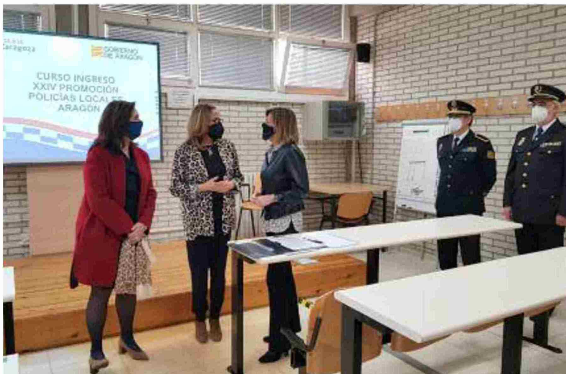
La consejera de Presidencia inauguró ayer en Zaragoza un curso de formación de policías locales