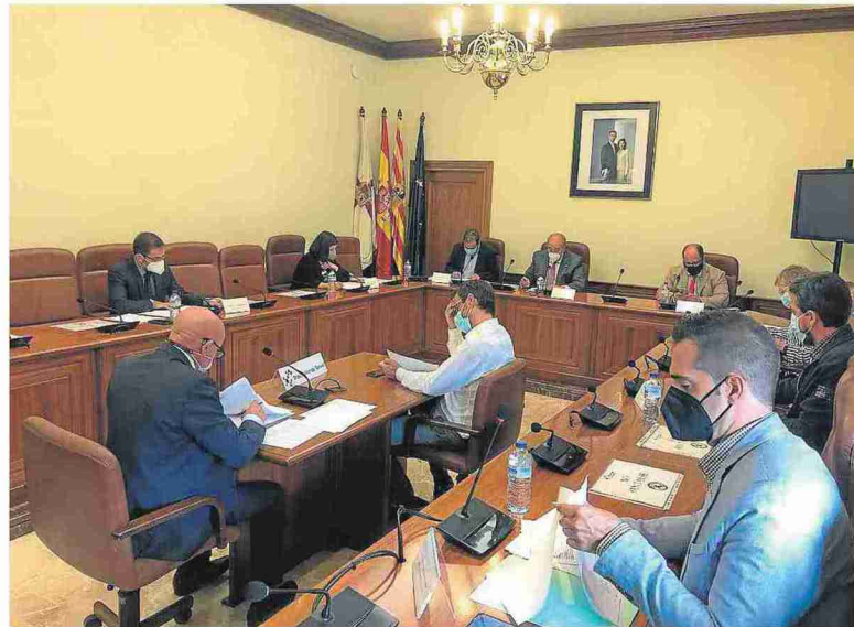
El pleno aprobó buscar una fórmula que garantice el acceso a dinero en metálico en los pueblos.