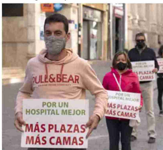
Movilización por la sanidad el año pasado en Teruel el 4 de octubre

La acción reivindicativa de este año toma el testigo de las dedicadas a la "defensa de la sanidad pública" y "una sanidad rural digna" llevada a cabo el año pasado, y a la exigencia de un Pacto