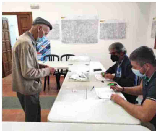
Un anciano, antes de depositar su voto

De las 19 torres eólicas que proyecta implantar Capital Energy en Mazaleón, 6 van en terrenos de particulares y 13 en monte público, mientras que de