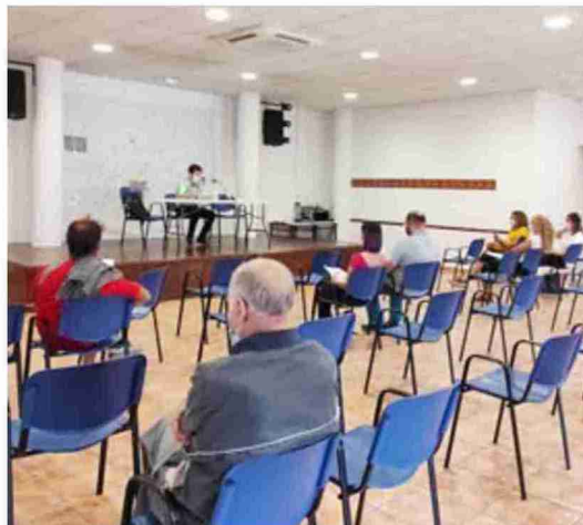
Charla de Capital Energy ayer en Valdeltormo

Hay cinco ayuntamientos que han suscrito un texto en el que