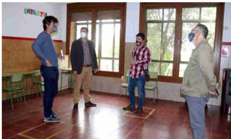
El alcalde junto a los representantes de Chunta en el interior de las antiguas escuelas, que se convertirán en viviendas

en la antigua escuela se harán lo antes posible, aunque es difícil fijar un calendario. En este sentido, el alcalde comentó que la semana pasada concluyó el plazo de licitación y ninguna empresa se interesó por el proyecto.