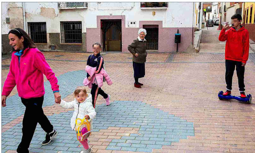
Una mujer pasea con sus tres hijos por Gascuña (Cuenca), donde existen varias iniciativas locales para atraer población.