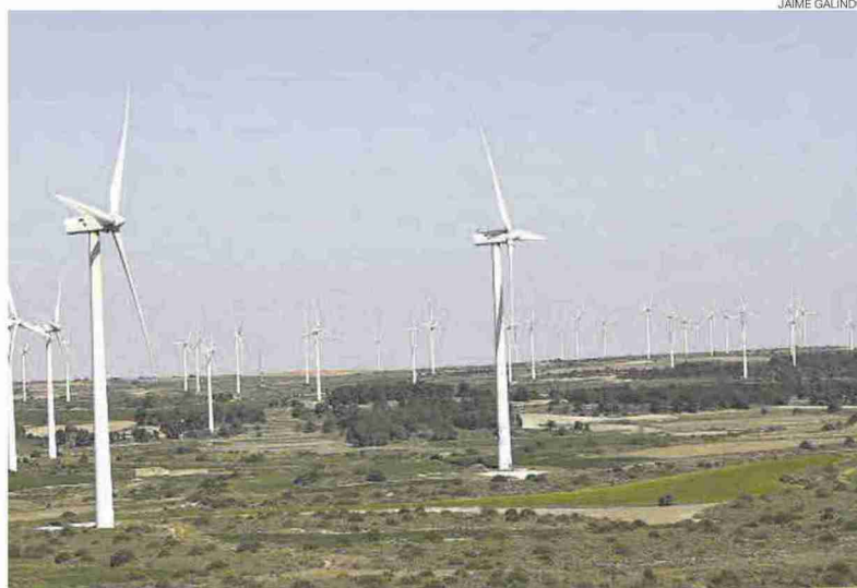
Parque eólico con varias decenas de aerogeneradores en el término municipal de Fuendetodos.

En el texto se destaca que los acuerdos municipales para estudiar los proyectos de parques de renovables «limitan y condicionan el ejercicio de las competencias de la comunidad autónoma para el otorgamiento de la autorización previa» de las instalaciones. Es decir, que las moratorias