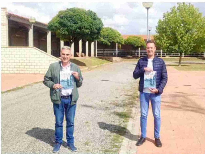
El alcalde de Cedrillas (izquierda) y el concejal de Cultura posan con el cartel de la feria en el lugar habitual de celebración

Las Jornadas Ganaderas se iniciarán el 28 de septiembre a las 19:05 horas, con una charla sobre el interés de los cultivos para el aprovechamiento por parte del