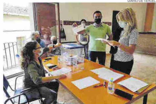
Votación ▶ Vecinos de Valdeltormo en la consulta celebrada el domingo.

El siguiente municipio que sondeará la opinión de sus vecinos será Mazaleón, que realizará otra consulta el próximo 3 de octubre, cinco días antes del plazo final para presentar las alegaciones al macroproyecto de Capital Energy, que se encuentra ahora en el periodo de información pública en el Ministerio para la Transición Ecológica y Reto Demográfico (Mite-