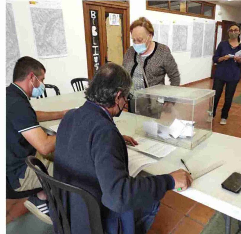
Dos mujeres esperan a votar ayer por la mañana en Mazaleón

Según el alcalde, "ya dijimos que, saliera el resultado a favor o en contra, presentaríamos alegaciones al proyecto, porque es un documento que hay que mejorar a todas luces", añadió. En este sentido, precisó que "tenemos