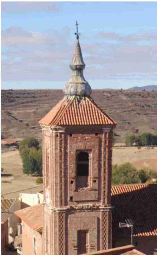
Campanario de la iglesia de la Asunción, con reminiscencias mudéjares