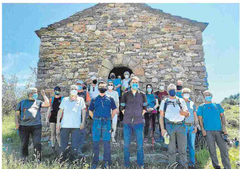
Parada en la ermita de San Roque en la marcha realizada por una parte de la etapa Noales- Bonansa.

"La Diputación de Huesca pretende conectar territorios porque entiende que las montañas nos unen y ese escenario de colaboración y de unión nos permite desarrollarnos", aseguró el diputado y presidente del