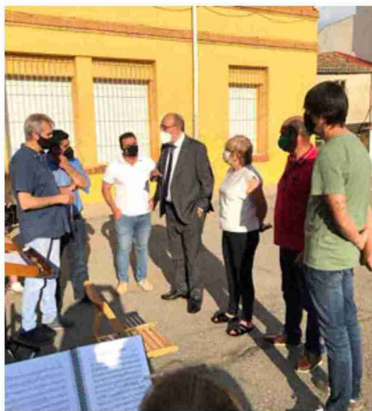
El presidente provincial Manuel Rando con responsables de la banda de Cella

Además, el diputado de Cultura y Turismo, Diego Piñeiro, señaló en Cella que en la última reunión con los responsables y directores de las bandas de música de la provincia, después de confirmar que no se iba a celebrar el Encuentro de Bandas de Música en formato tradicional, se propuso estudiar una fórmula