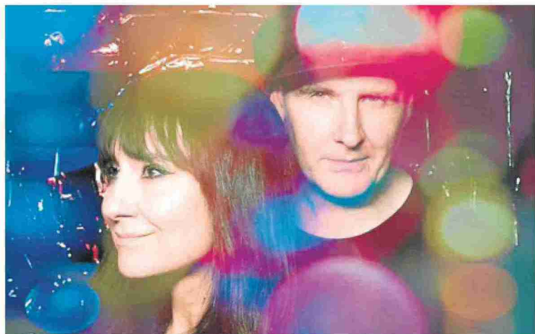
Amaral actuará el 17 de septiembre y en acústico dentro del festival.

Habrán únicamente dos espectáculos que requerirán entradas: Amaral en acústico con banda el 17 de septiembre y Rozalén el 18 de septiembre, ambos en la Cartuja de Nuestra Señora de las Fuentes, en Sariñe-