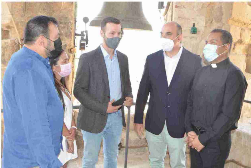
Autoridades locales y autonómicas y el párroco de La Fresneda inauguran el remozado campanario. M. N.