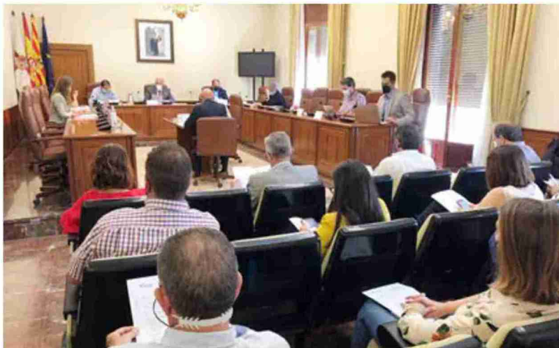
Un momento del pleno presencial en el que los portavoces ocupan la bancada y el resto de diputados los asientos del público

El procedimiento establecido para optar a esta línea de ayudas