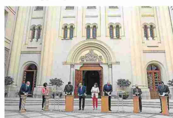
Firma del plan de rescate a la hostelería. DGA

5 Recuperación en materia de empleo. Las actuaciones para mantener los ERTE, el diálogo social, la FP, la conciliación y la agilidad en la actividad administrativa se dan por conseguidas. Sigue pendiente el impulso de incentivos al mecenazgo y a las donaciones que tengan que ver con cuestiones relacionadas con la covid para empresas y para particulares.