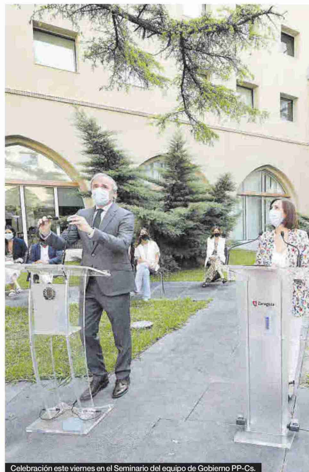
Celebración este viernes en el Seminario del equipo de Gobierno PP-Cs.

Pero lo realmente importantes son los fondos europeos para la recuperación, para los que tienen en cartera decenas de proyectos que alcanzan una cuantía global de unos