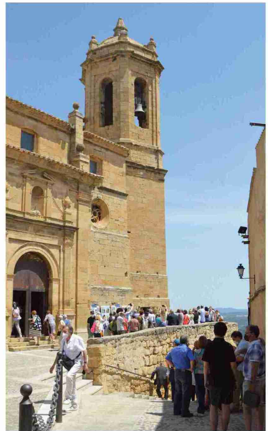
La torre del campanario despertó ayer el interés de vecinos y visitantes. M. N.

últimos fines de semana La Fresneda está recuperando el pulso al turismo. "Después de tanto tiempo ha sido una alegría poder ver la plaza llena. Llevamos muy buen fin de semana y los anteriores también han sido muy buenos, principalmente para que los negocios de hostelería y los comercios puedan volver a ver la luz después de lo mal que lo han pasado", manifestó.