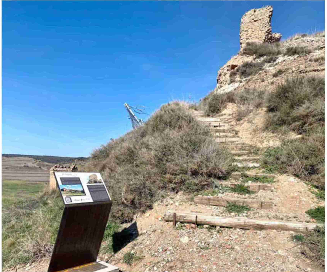
Subida al Castillo

En una detallada descripción realizada en 1532, se indica que se accedía por un puente (que podía desmontarse en caso de peligro) y una doble puerta, contando con seis torres: las del molino de sangre, descubierta, fendida, mocha, tajada y celoquia. También tenía múltiples dependencias, destinadas a diversas funciones: servicio (caballerizas, cocina, fregadera), almacenaje (bodegas, granero, despensa-fresquera), aljibe (con dos brocales), molino de sangre (de dos ruedas) y dos cárceles (una nominada de los clérigos), además de otras estancias innominadas y las habitaciones de carácter residencial. Entre estas últimas destaca una sala con chimenea y otra con un armario (¿archivo?) contigua a una galería cubierta y a un mirador. Desde éstas se accedía a la torre celoquia. También destacaba el arsenal, que guardaba un importante lote de armas, incluidas varias piezas de artillería de pólvora. De estos elementos, actualmente sólo se conserva visible una pequeña parte, destacando el monumental paredón de sillaría de la torre celoquia. Pero, en el subsuelo se conservan muchas más estructuras a la espera de ser sacadas a la luz.