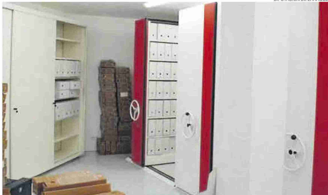
►► Archivos de la Diputación de Zaragoza donde se guardan los documentos catalogados.