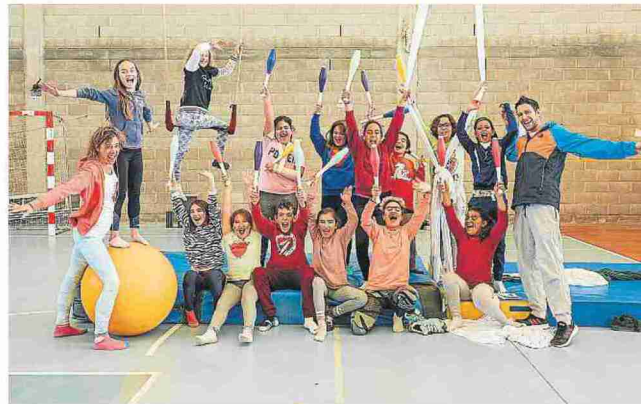
HOYA DE HUESCA

Participantes en el divertidísimo taller de circo desarrollado en Ayerbe.