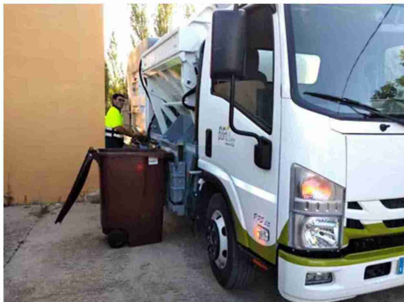
Recogida de materia orgánica a domicilio 'Porta a porta' en la Comarca del Matarraña

Así las cosas, La Portellada, Ráfales, Torre del Compte, Valjunquera y Valdeltormo se unirán a los municipios que en su momento estrenaron el sistema de recogida selectiva del Matarraña (Fuentespalda, Monroyo, Peñarroya de Tastavins, Torre de