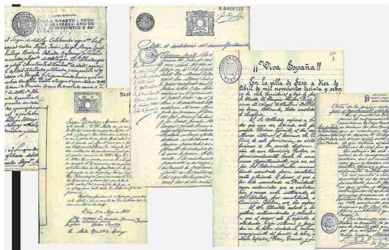
Algunas de las más de 13.000 imágenes obtenidas tras la digitalización de 126 libros.

Para darlas a conocer se ha diseñado un visor interactivo