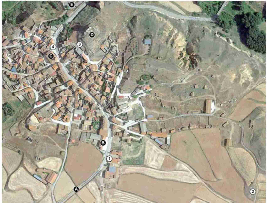
Situación de los paneles (número) y distintos hitos urbanos (letra)

El siguiente hito de nuestro recorrido se encuentra en el Calvario de Cutanda, al que se accede por un camino situado a mano derecha, 100 m. más adelante;