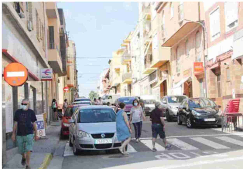
Localidad de Andorra, uno de los municipios que podrá ser objeto de ayuda y que figura entre los muy afectados

En el anexo de la orden que regula las ayudas se detallan los municipios que pueden beneficiarse, diferenciados entre los que se han visto muy afectados por el proceso de cierre de empresas de la minería del carbón, y el resto. El primer grupo, los más afectados y que tienen ventajas a la hora de puntuar para optar a las ayudas, está com-