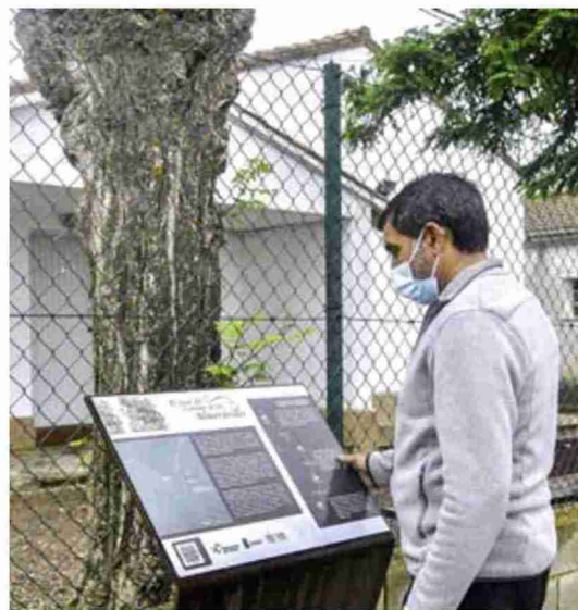
Panel sobre el Camino de los Almorávides, frente a las antiguas escuelas. T. López

lante; antes de llegar al camino, pasaremos frente al Centro de Interpretación de la Batalla de Cutanda, cuyos sistemas expositivos se encuentran actualmente en elaboración.