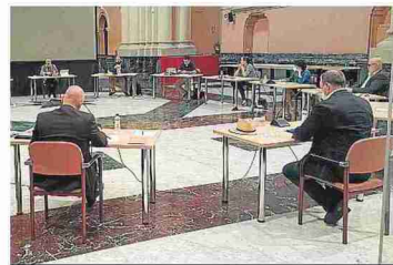
Mesa técnica para preparar el plan. DGA

3 Recuperación en políticas públicas. Entre las 94 medidas contempladas, queda trabajo por hacer en salud mental, donde se reconoce que el plan especial para afrontar la covid está desarrollado al 50%. Prácticamente nada se ha avanzado en la Ley de Mecenazgo, y solo se ha alcanzado un 50% en la adecuación de las ratios de las residencias y en el refuerzo de las inspecciones.