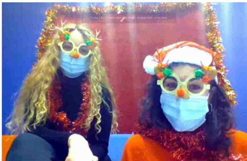
Los cuentacuentos han hecho un poquito más felices muchos niños y niñas de la Comarca Comunidad de Teruel

Hasta sesenta escolares, unos de manera presencial y otros por vía telemática, han disfrutado de la iniciativa