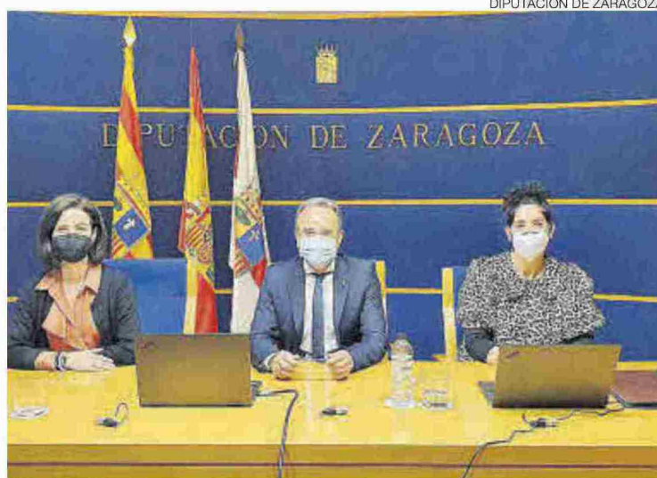
DIPUTACIÓN DE ZARAGOZA

►► El presidente y otros miembros de la corporación, ayer, en la votación.