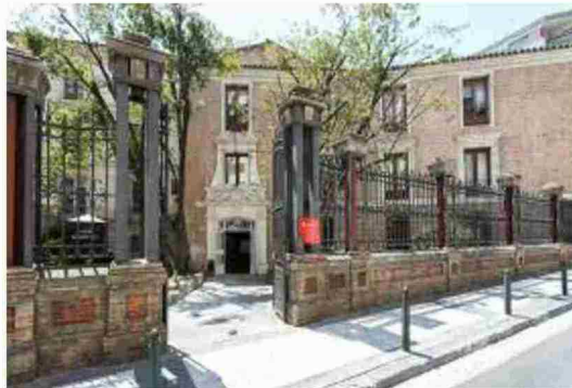
Centro de Servicios Sociales de Zaragoza, municipio calificado de "excelente"

bre" se tiene en cuenta que el gasto social es inferior a 45 euros, es decir, por debajo del 60 por ciento de la media de gasto por habitante/año.