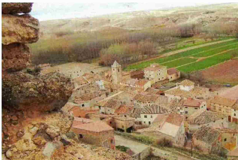
El Ayuntamiento de Orrios ha iniciado las gestiones para instalar un multiservicio rural

La red de multiservicios rurales de la provincia de Teruel que apoya la DPT, DGA y Cámara de