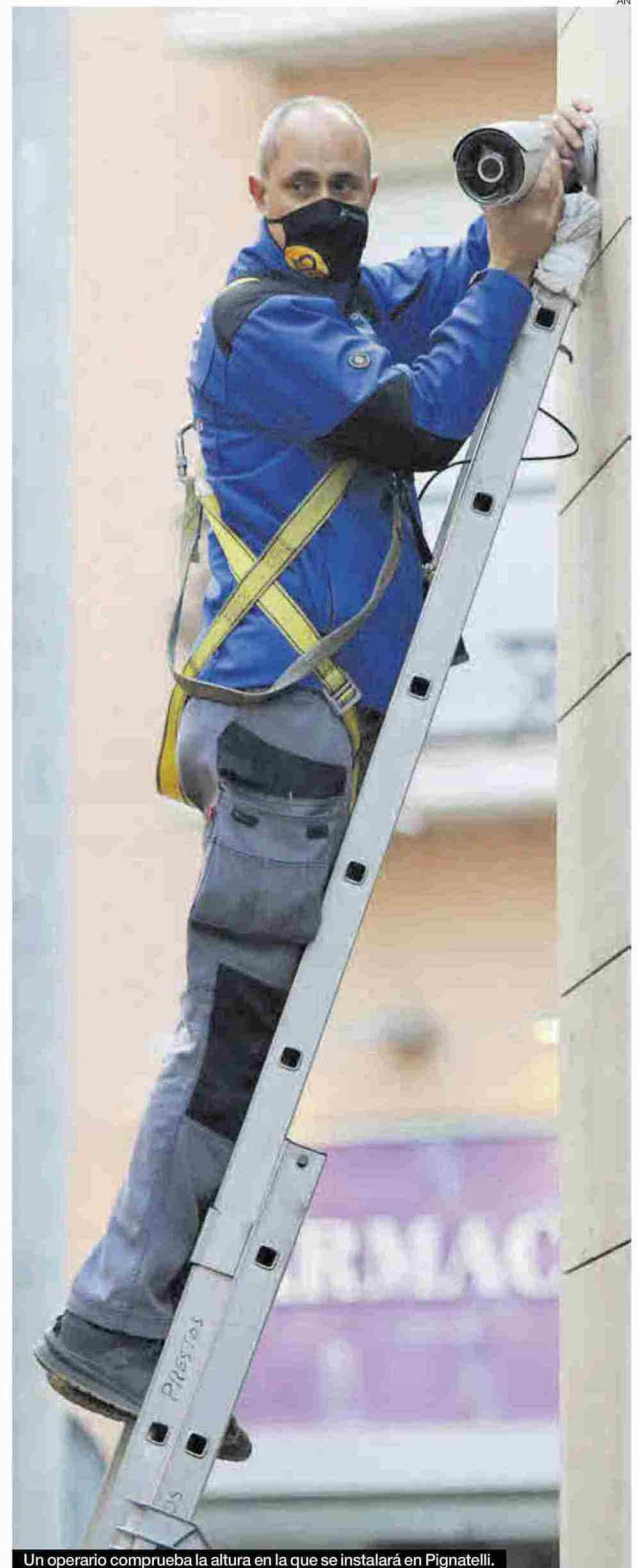
Un operario comprueba la altura en la que se instalará en Pignatelli.

Los sistemas de videovigilancia en Aragón instalados en la vía pública siempre están dirigidos a la calle y nunca a las viviendas. Las imágenes no son visionadas en tiempo real durante las 24 horas, sino que forman parte de un sistema de grabación cerrado al que solo tienen acceso las Fuerzas y Cuerpos de Seguridad del Estado. La condición es que haya ocurrido algún hecho delictivo que haga necesario su reproducción. En caso contrario, las imágenes se autodestruyen en un plazo de 30 días. Su instalación siempre se realiza a una altura de unos cinco metros y cuentan con sistemas de protección ante hechos vandálicos, así como tecnología que permite la filmación durante la noche. Siempre son estáticas y no pueden moverse.