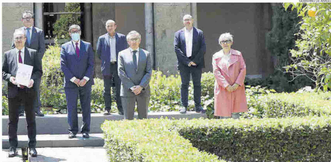
GOBIERNO DE ARAGÓN

Necesitamos situar en el centro de la agenda política una agenda social para luchar contra la desigualdad, fomentar el empleo de calidad y mantener nuestro estado de bienestar ahora y en el futuro. Y para ello es imprescindible el diálogo y el consenso. ■