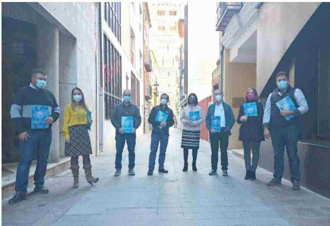
Los diputados del Partido Popular en la DPT han presentado enmiendas a los presupuestos de la institución por un importe superior a cinco millones de euros