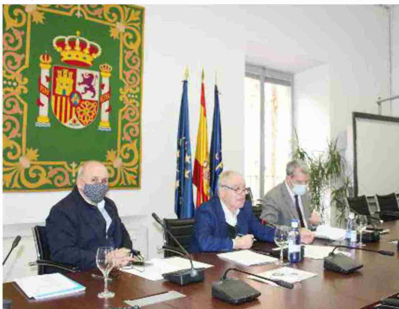
Miguel Gracia, presidente de la DPH y de la Comisión de Despoblación y Reto Demográfico de la FEMP

La participación de las entidades locales en el Fondo de Recuperación de la Unión Europea y la adaptación de la normativa que afecta a su ejecución, y en especial en materia de Contratación del Sector Público, con el fin de agilizar y rentabilizar al máximo todos los proyectos que pueden ser financiados con este tipo de fondos, fueron las dos ideas fundamentales de la propuesta que acordó la Comisión de Despoblación y Reto Demográfico de la Federación Española de Municipios y Provincias, que esta semana presidió por vez primera, Miguel Gracia, tras ser nombrado el pasado 24 de noviembre para este cargo, en sustitución de Francesc Boya, actual Secretario General para el Reto Demográfico, quien intervino también en esta reunión.