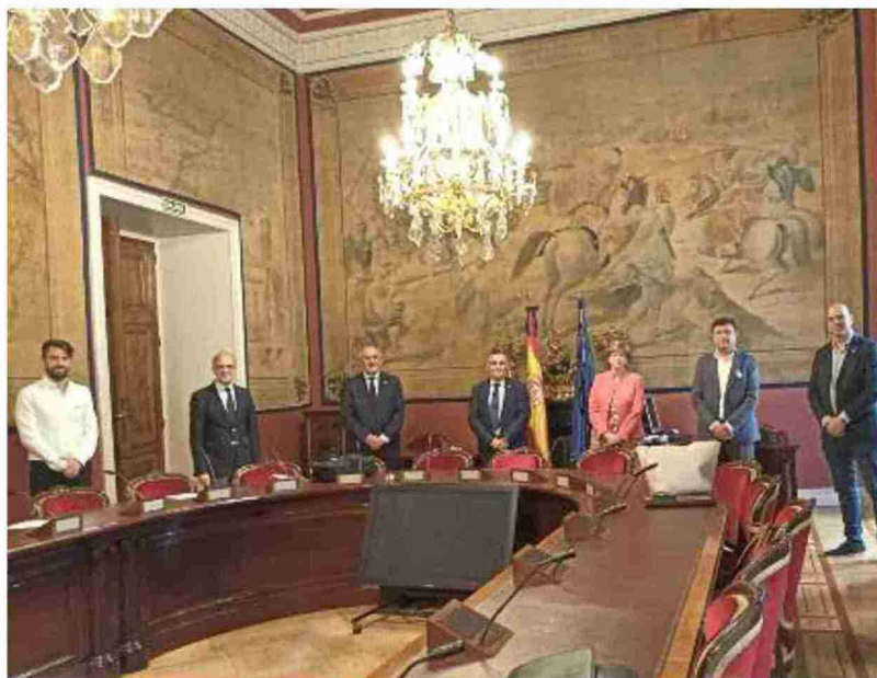
Parlamentarios del Grupo Mixto en el Senado, que han acordado impulsar una enmienda conjunta a instancia de TE

La iniciativa ha surgido de Teruel Existe para unir al Grupo Mixto en esta enmienda, según informó ayer la agrupación de electores en un comunicado. La misma tiene por objeto luchar contra la exclusión financiera ante el creciente cierre de oficinas bancarias en estos territorios de la España Vacía, y reclama al Ministerio de Transición Ecológica y Reto Demográfico una partida de un millón y medio de euros que permita subvencionar la implantación de este servicio en áreas rurales de menos de 1.000 habitantes, las más afectadas por el cierre de las entidades financieras, que garantice el acceso a estos servicios.