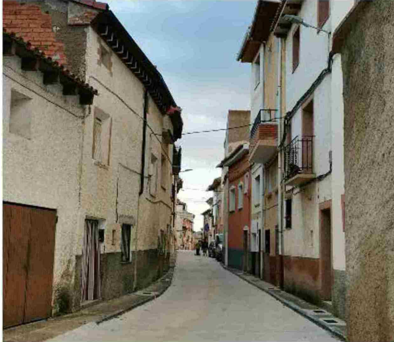
La mitad del dinero que gestionará la Diputación en 2020 irá a parar a obras y servicios en los municipios. Silvia Benedi

En cuanto a la inversión junto a otras entidades, también se aumenta el dinero para colaborar con el Obispo de Teruel y el Arzobispado de Zaragoza para la restauración de las iglesias y er-