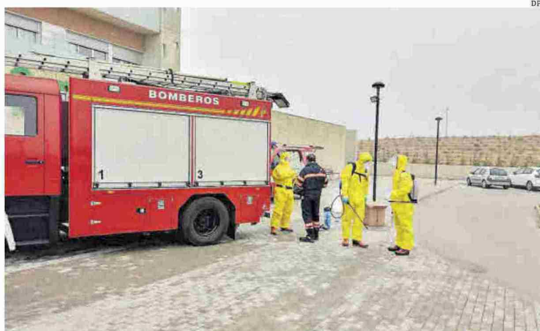
Desinfecciones. Los bomberos de la DPT han realizado más de 50 intervenciones durante la pandemia.

El Festival OnlineFest que se puso en marcha durante el confinamiento se mostró como un escaparate en la red para los artistas, y ciclos como Cultural o Alcañiz Lee han llevado la cultura por los pueblos de la provincia de Teruel. ★