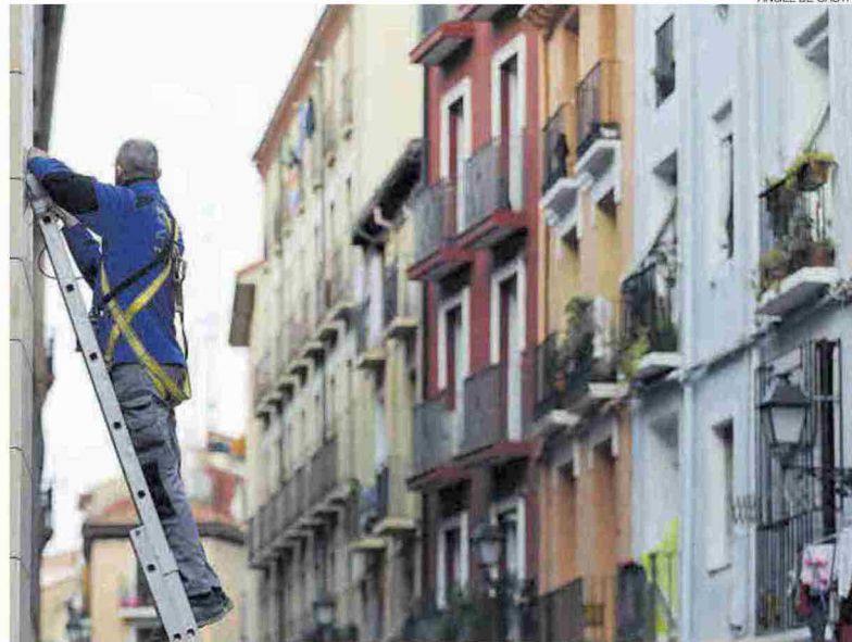
► Un operario comprueba el foco hacia el que va a grabar una de las cámaras de seguridad en El Gancho.