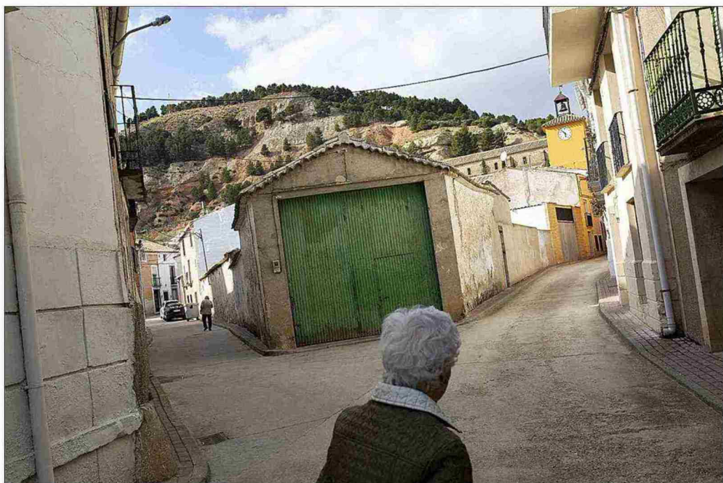
Una mujer avanza por una de las calles de Gascuña (Cuenca), municipio que ha establecido iniciativas para evitar la despoblación. ANTONIO HEREDIA