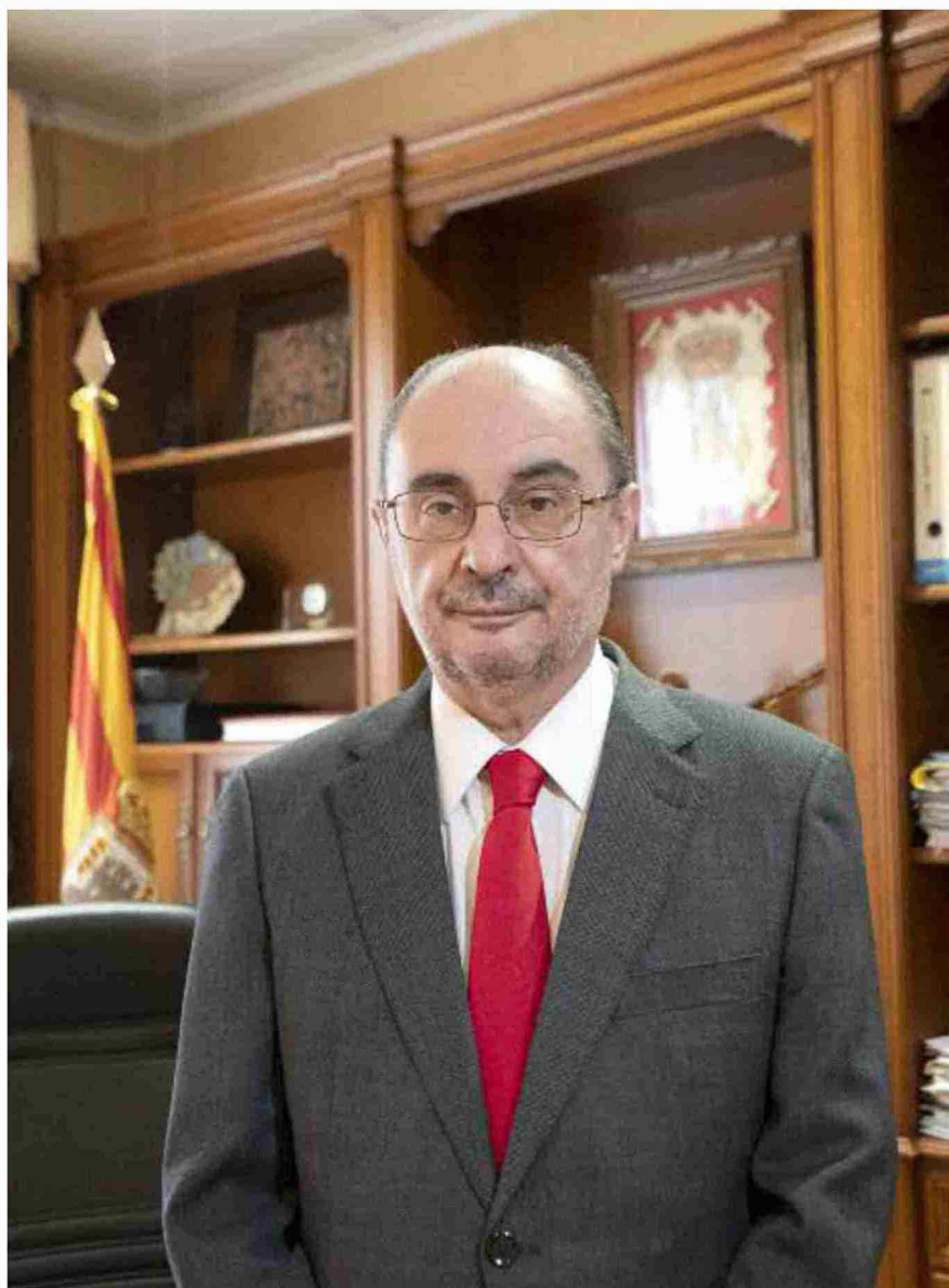
Javier Lambán el pasado jueves en el Ayuntamiento de Calamocha.

-Lo cierto es que este tipo de decisiones, si ya es lenta en la Comunidad Autónoma, pensar en la Unión Europea es desesperante, pero hay que tener paciencia e ir perseverando porque poco a poco las cosas van llegando. Ha costado mucho que Europa reconozca que la despoblación debe ser un factor a tener en cuenta en el reparto de fondos, y ahora deberá ser cada Estado miembro de la Unión quien especifique cómo se van a desarrollar esas ayudas y si las complementa. Nosotros vamos a estar trabajando permanentemente a través de las vías que hemos utilizado tradicionalmente, porque parece que este problema se esté abordando en los últimos meses o años, pero es algo en lo que se viene trabajando desde hace mucho tiempo desde el Gobierno de Aragón. El Gobierno de España cada vez va demostrando mayor sensibilidad, aunque no toda la que a nosotros nos gustaría.