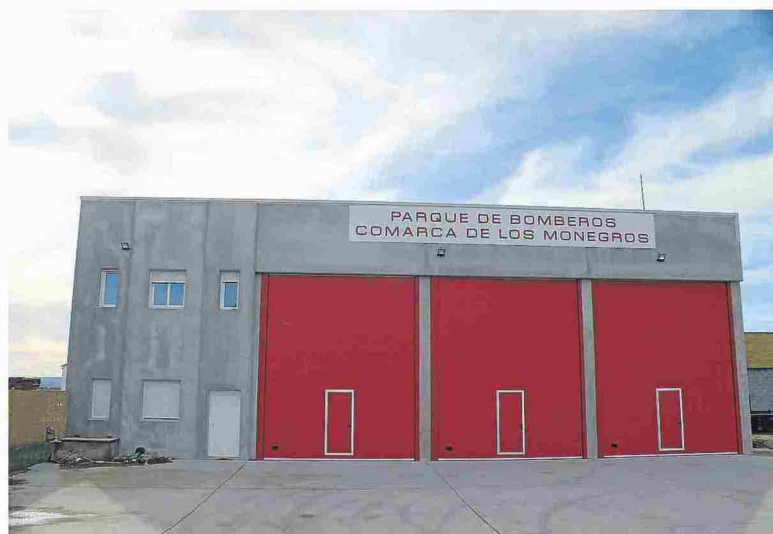
El nuevo parque de Los Monegros está situado en una de las entradas principales de Sariñena.

Las partidas económicas ya están dispuestas. En concreto, la DPH ha reservado 250.000 euros para la red de suministros (saneamiento y abastecimiento) y además, contempla invertir otros