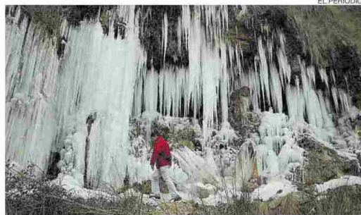
▶ Cuando bajan las temperaturas el Aguallueve es todo un espectáculo.

Anento es un ejemplo de ello, donde la nieve realza su arquitectura y sus paisajes, como el manantial del Aguallueve, del que brota su agua por enormes paredes kársticas, «creando un espectáculo inigualable». Allí el pasado viernes observaron solo la primera capa en la parte alta, ya que al día siguiente en el pueblo no quedó rastro. «La gente está expectante cuando empiezan a bajar las temperaturas, con unos 10 grados bajo cero, y aprovechan para acer-