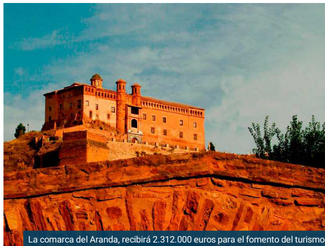
La comarca del Aranda, recibirá 2.312.000 euros para el fomento del turismo

El programa de los Planes de Sostenibilidad ha sido elaborado desde la Secretaría de Estado de Turismo entre febrero y mayo de 2020 para equilibrar el modelo de desarrollo turístico de España y para dar respuesta al nuevo escenario provocado por la pandemia y cuenta con la colaboración financiera de las Comunidades Autónomas y de las entidades locales. Las comarcas del Aranda y del Bajo Cinca han sido seleccionadas y recibirán una inversión de 4.625.000 euros, 2.312.000 euros a cada una.