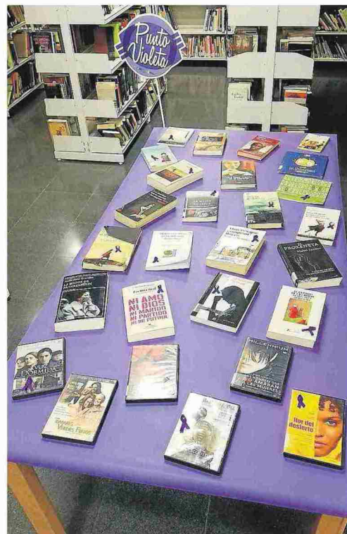
La Biblioteca de Biescas ha instalado una exposición bibliográfica en su 'Punto violeta'.

Los usuarios de esta biblioteca pueden visitar la exposición y si les interesa la lectura de alguno de estos ejemplares, es la responsable de la biblioteca quien lo coge de la mesa para realizar el