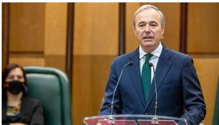
Ayuntamiento Zaragoza Jorge Azcón Fondos europeos