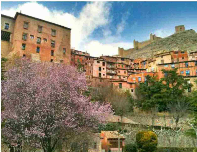
El turismo es el sector más afectado en Albarracín, imagen, y la sierra por la pandemia del coronavirus