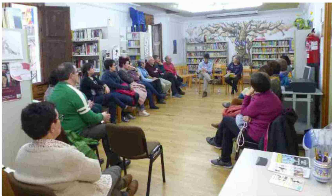
La Biblioteca Municipal Miguel Artigas de Monreal del Campo organiza numerosas actividades, una de ellas son los encuentros con autores de libros