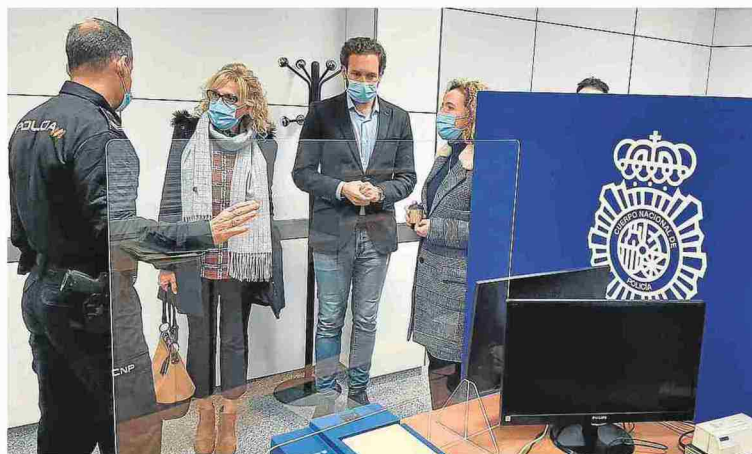
Autoridades ayer, durante su visita a la nueva Oficina de Extranjería y Documentación de Monzón.

bre. La subdelegada del Gobierno destacó la importancia de esta nueva oficina, que se suma en la provincia a las de Huesca, Jaca y Fraga, ya que "acercará los servicios de la Administración General del Estado a una ciudad y unas comarcas con un importante volumen de población y con gran dinamismo económico". ● D. A.