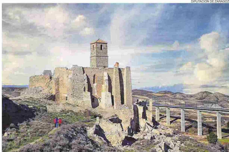
▶ Castillo de Rodén, en el municipio zaragozano de Fuentes de Ebro.

El objetivo de este plan es seguir apoyando a los ayuntamientos de la provincia en la conservación de su rico patrimonio, según destacó el presidente de la DPZ, Juan Antonio Sánchez Quero. Con esta línea de ayudas, la institución provincial ha contribuido a la restauración de edificios muy importantes para los municipios como castillos, torres o casas consistoriales, iglesias y ermitas de titularidad municipal, y también bienes muebles como retablos, esculturas o lienzos, agregó Sánchez Quero.