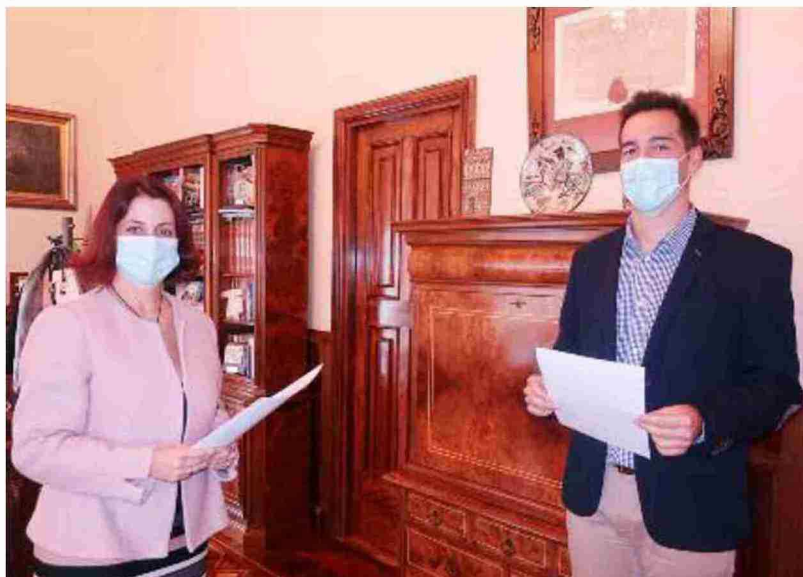
La alcaldesa y el primer teniente de alcalde presentaron ayer las actuaciones que se van a financiar con los remanentes

Todos los proyectos para los que hay partida están ya redactados y se podrán sacar a licitación