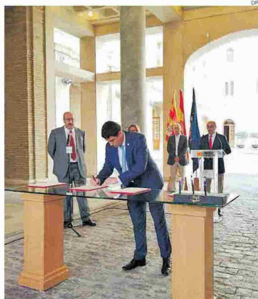
► Momento de la firma del protocolo con la DGA en el mes de julio.

DESARROLLO ECONÓMICO // Por otro lado, la Diputación Provincial de Huesca aprobará destinar un millón de euros de sus remanentes a la puesta en marcha de un plan que desarrollará actuaciones tanto de carácter económico como de promoción y protección social. Se destinará a ayudas para inversio-