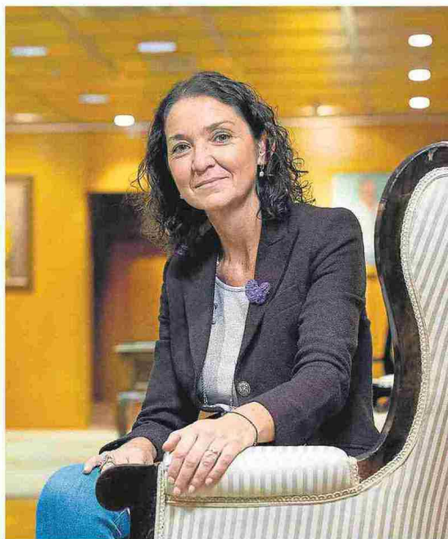
Reyes Maroto, en la sede del Ministerio de Industria.

La digitalización de la que hablaba cuando llegó al cargo, que se ha acelerado. Toca acelerar. Y es algo que tenemos que aprovechar. Las brechas en lo analógico se pueden agrandar en lo digital. Tenemos que trabajar mucho en la España rural para que no se agranden esas brechas y que la digitalización genere oportunidades. Ya no es necesaria la presencia física, lo he-