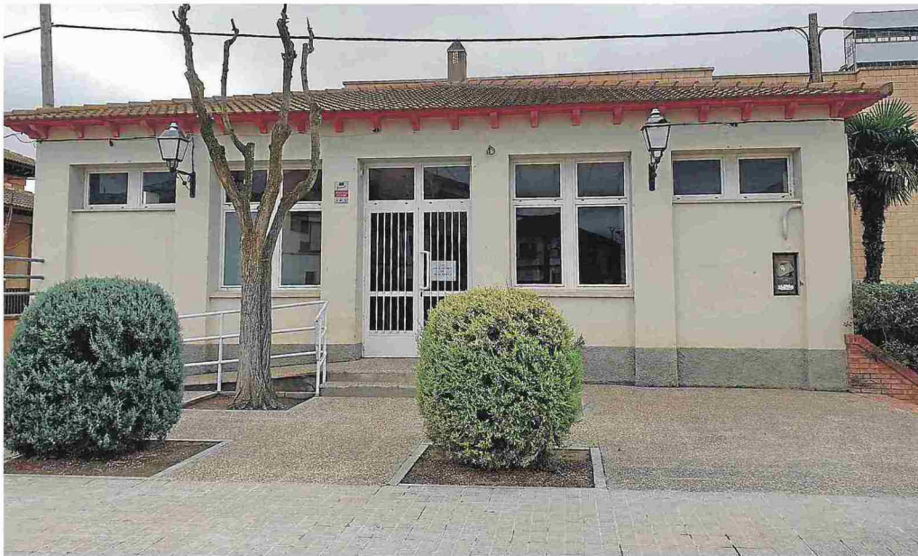
Salón social de Castejón de Monegros, donde se va a terminar de acondicionar la cocina.

La Diputación Provincial de Huesca reparte este Plan de Inversiones entre los 201 municipios, con cuantías entre los 28.000 y los 37.000 euros, para que inviertan en lo que consideren