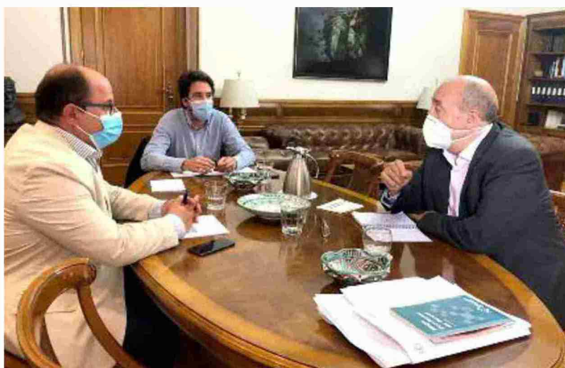
El portavoz de Ganar-IU, en el centro, durante el encuentro mantenido ayer sobre las partidas presupuestarias