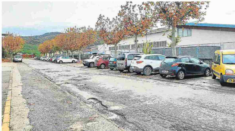
El Plan de Inversiones permitirá a Graus arreglar la calle del instituto nuevo, que está llena de baches.

Dotado con poco más de seis millones de euros, la puesta en marcha de este Plan de inversiones ha sido posible por la aprobación de las nuevas medidas fiscales impulsadas por el Ministerio de Hacienda y aprobadas en el Congreso de los Diputados. Del montante total, algo más de 4,5 millones se financian con cargo a los remanentes de 2019 y la cantidad restante, 1,5 millones de euros, se incluirán en los presupuestos de 2021.