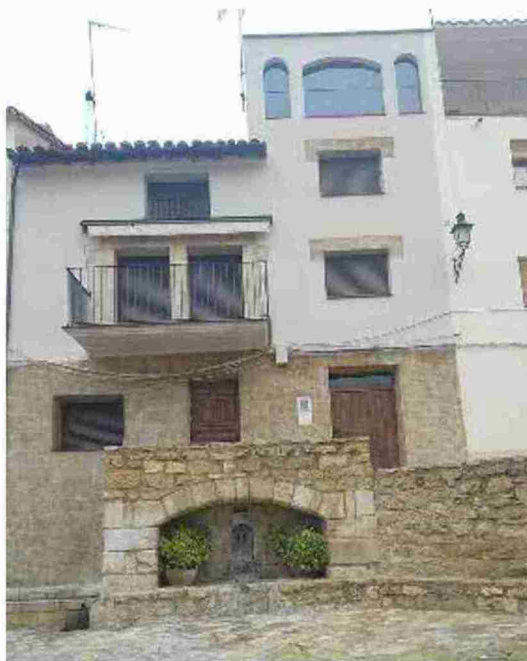
Esta casa ha sido reformada en pocos meses

El fenómeno se ha notado en el censo municipal, que ha crecido con 10 o 12 personas más en pocos meses, algo inaudito en Cañada de Verich, que lleva años perdiendo población. Hace dos cursos cerró, por ejemplo, el co-