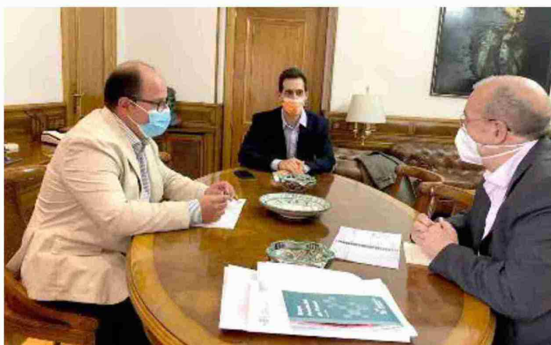
El presidente (dcha.) y el vicepresidente (izq.), en la reunión de trabajo mantenida con el portavoz de Cs

tuación de crisis, y destacó las líneas estratégicas que les guían: "Los ayuntamientos, el empleo, las comunicaciones como las carreteras o la banda ancha. Esas son nuestras prioridades. Lo eran al principio de la legislatura y lo siguen siendo", dijo. Sobre las negociaciones con los otros grupos se mostró confiado al asegurar que van "a ser capaces todos los grupos políticos, en el gobierno y en la oposición, de dar un ejemplo". Recordó que ya lo hicieron "con el presupuesto del 2020 y en las sucesivas modificaciones, de acuerdo, de concordia, de potenciar" lo que los une y apartar lo que les separa.