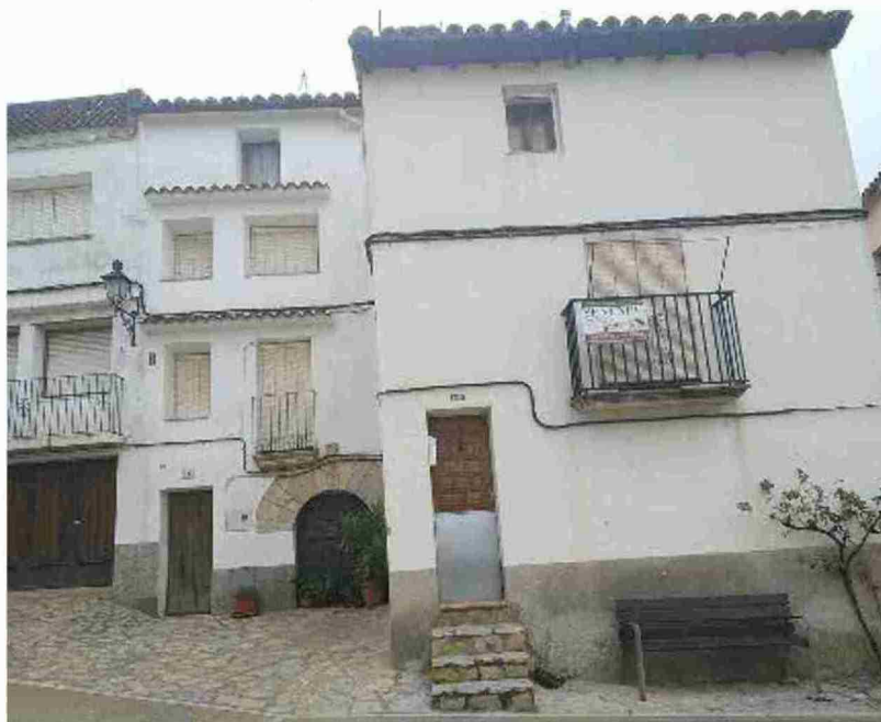
Vivienda vendida, que todavía conserva el cartel de 'se vende'

Eso sí, lo que tiene el mercado inmobiliario de Cañada de Verich