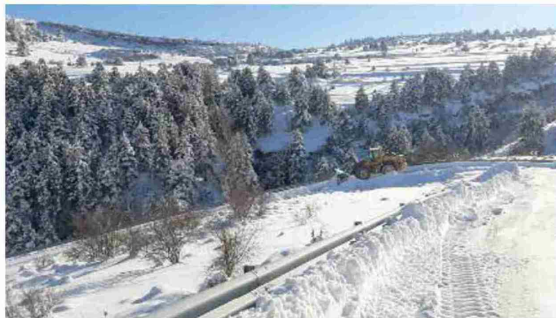
Una máquina quitanieves trabaja en la carretera de Fortanete al puerto de Valdelinares el pasado lunes

lares y asegurar al menos una salida por carretera para cada municipio, de manera que se pueda dar servicio ante posibles situaciones de emergencia.