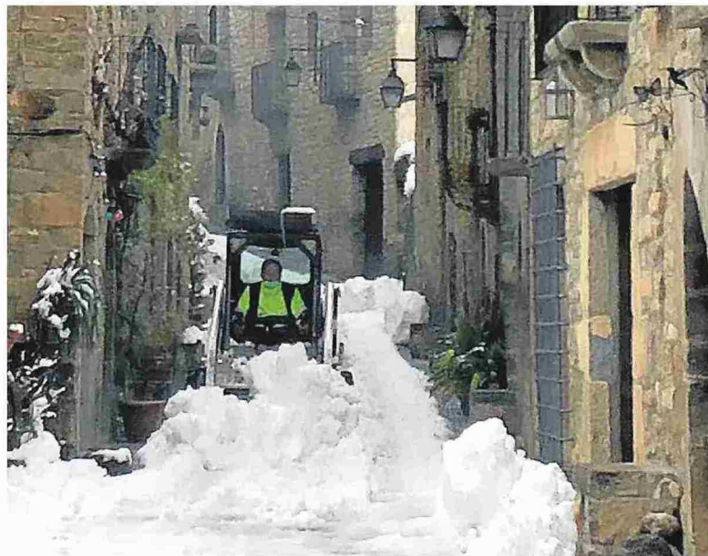
Un operario retira nieve en las calles de Aínsa, una de las labores que se podrían ofrecer.