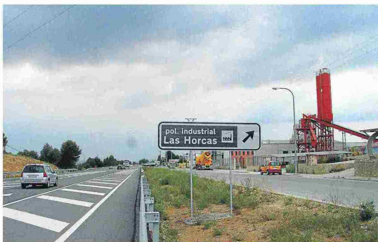
El polígono Las Horcas de Alcañiz será uno de los beneficiarios de la implantación de la banda ancha. LA COMARCA

Cantabrana enfatizó que la crisis sanitaria ha demostrado la ne-