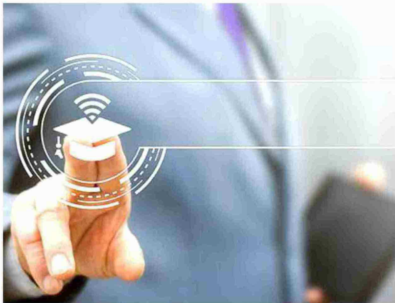
Los talleres TIC han llegado desde 2010 a más de 350 localidades

La presentación de solicitudes tiene que realizarse a través