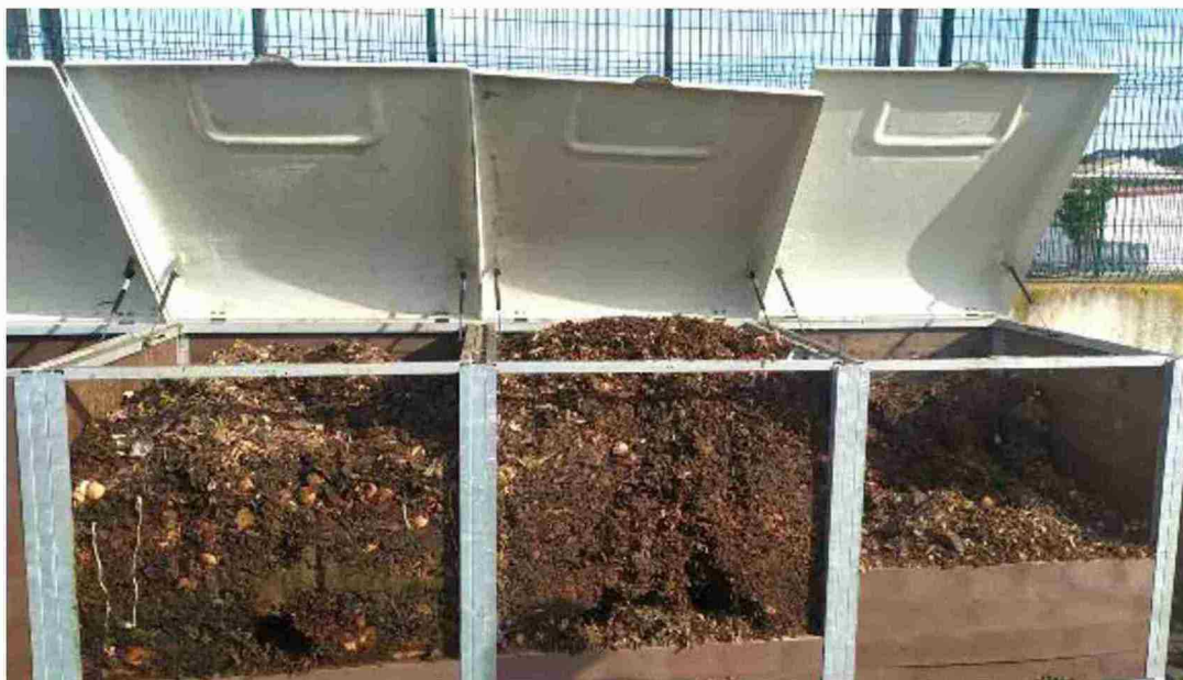
Compostadoras abiertas en Torrecilla de Alcañiz, en cuyo interior se transforma la materia orgánica en abono orgánico

RECICLADO DE MATERIA ORGÁNICA PARA TRANSFORMAR EN ABONO