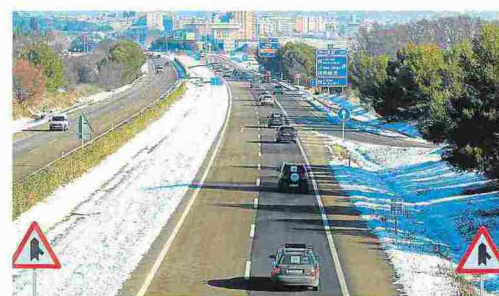
Caravana pacífica de vehículos en la autovía A-23, ayer en las proximidades de Huesca.

Al acabar, emprendieron la marcha hacia el aparcamiento