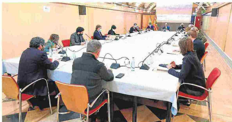
Reunión presidida por Lambán con representantes de las comarcas ligadas al turismo de la nieve.

Estas son las medidas concretas que el Ejecutivo autónomo ha diseñado para apoyar las economías de quienes viven del turismo de la nieve y que el presidente aragonés, Javier Lambán, trasladó ayer a los representantes políticos y empresariales de las comarcas ligadas al turismo de la nieve, con quienes mantuvo una segunda reunión en Zaragoza para abordar la situación que viven por la no apertura de las