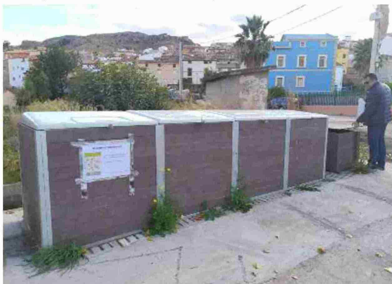
Aspecto exterior de las compostadoras de Oliete

La Comarca del Bajo Aragón arrancará con el proyecto "este año, en cuanto nos sea posible", explicó el consejero de Residuos y Medio Ambiente, Aitor Clemente, que espera obtener más financiación de otras administraciones -además de los 30.000 euros del Ministerio de Transición