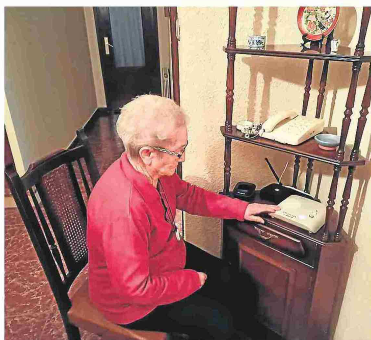
Una usuaria, junto al aparato del servicio de teleasistencia.

● Las comunicaciones, que durante el confinamiento subieron un 25%, permitieron atender a 4.000 mayores y dependientes