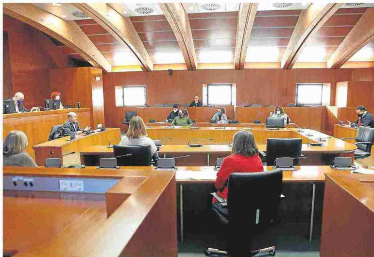
Los diputados escucharon ayer las argumentaciones de once comparecientes sobre la ley. CORTES DE ARAGÓN

Cada uno de los intervinientes dispuso de ocho minutos para explicarse y ninguno de ellos tuvo que apostillar nada, dado que los diputados no hicieron preguntas. Lo mismo sucedió el viernes,