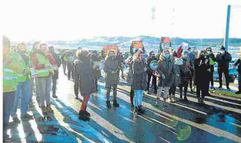
Un momento del acto de protesta de los empresarios y trabajadores del Pirineo, en el parquin del Coso Real de Huesca.

Quienes procedían del valle de Tena y Tierra de Biescas partieron a las nueve y media de la mañana desde la gasolinera de Biescas hacia el parquin de Coso Real