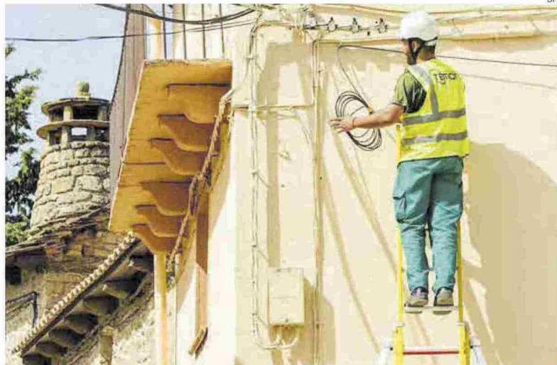
►► Un técnico realiza una instalación de banda ancha en un pueblo oscense.

El reparto por provincias queda de la siguiente manera. En la provincia de Huesca las ayudas tendrán un valor de 3,5 millones de euros y permitirán que 13.904 unidades inmobiliarias de 102 localidades se beneficien de acceso a banda ancha de nueva genera-