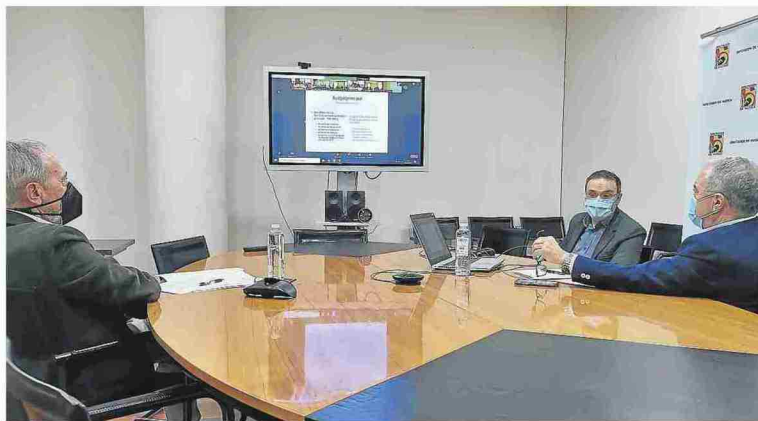
Imagen de la asamblea telemática celebrada ayer por la AECT Pirineos-Pyrénées.

tiene como objetivos transversales facilitar la digitalización de la economía y del territorio y garantizar que los nuevos pobladores dispongan de vivienda a un precio accesible.