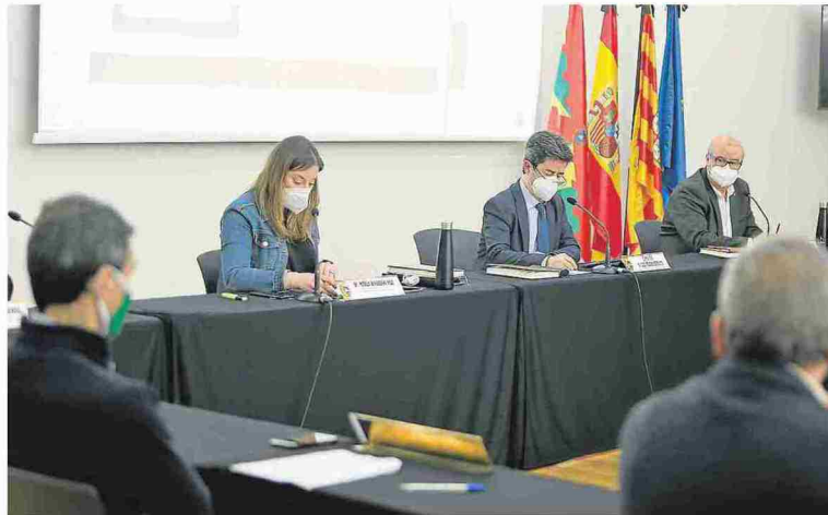
Imagen de la sesión plenaria celebrada ayer.

Además, el pleno desestimó la solicitud de varias asociaciones para la declaración de monumento de interés local del antiguo Seminario de la Santa Cruz, pero sí que aprobó la realización de los trámites necesarios por parte del Ayuntamiento para que