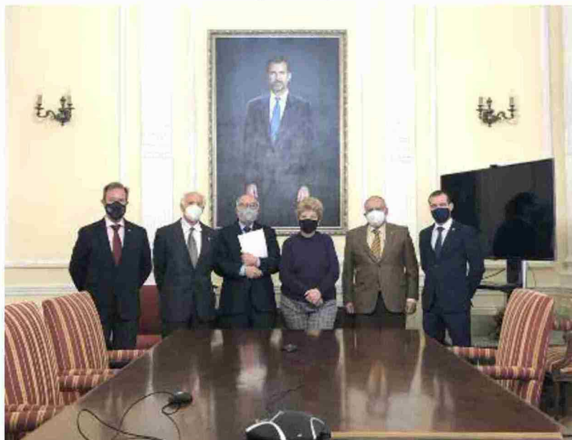
Representantes de las entidades que suscribieron los convenios para impulsar acciones frente al reto demográfico

En el mismo señalan que "uno de los grandes problemas de la agricultura española es que cuente con 50 regiones productivas como destinatarias de la