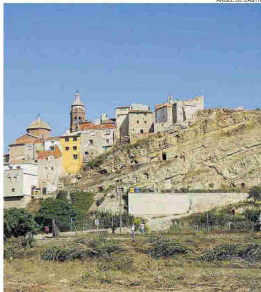
▶ Vista general del pueblo turolense de Oliete, que participa en la edición.