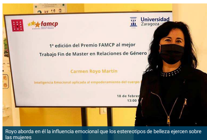
Royo aborda en él la influencia emocional que los estereotipos de belleza ejercen sobre las mujeres

El término feminismo se supone que busca la igualdad entre el hombre y la mujer. Sin embargo, en estos últimos años y con la llegada de este movimiento social es necesario empezar a plantearse diferentes cuestiones. Si eres mujer, y no estás de acuerdo con esta ideología se te tacha de machista y fascista. ¿Está usándose el feminismo como estrategia política? ¿Realmente se busca la igualdad?