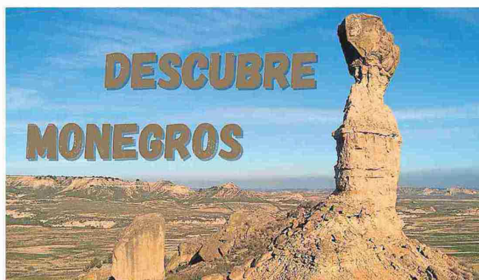
Parte del cartel promocional de la iniciativa Descubre Monegros.

La segunda ruta tendrá lugar el 28 de marzo en Monegrillo, desde los miradores de la Estiva, pasando por la sabina milenaria y hasta los observatorios