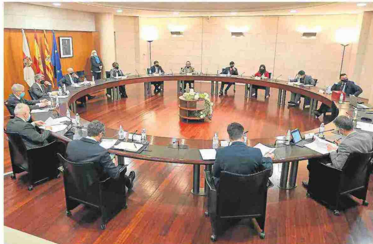
Imagen de la sesión plenaria celebrada ayer.

Respecto a la segunda, el presidente de la Diputación recordó que en 2020 ya se puso en marcha este plan, entonces dotado con 2,5 millones. "Lo que hacemos este año es duplicar la cuantía, llegando hasta los cinco millones, utilizando para ello 2,5 millones de los remanentes de que dispone la institución, y que así los consistorios puedan destinar esos recursos a cubrir las