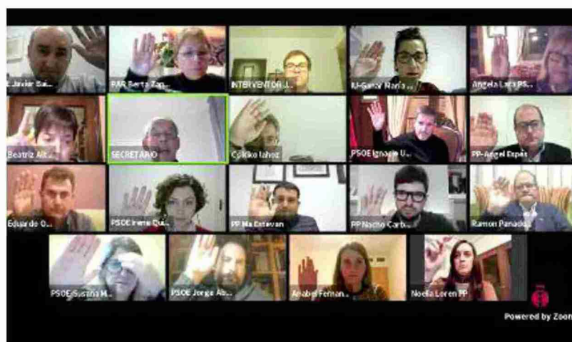
Votos a favor de la solicitud de la Uned