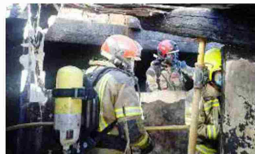
Reciente intervención de los bomberos de la DPT

mado de los técnicos el gasto para el Ayuntamiento supondría 1,5 millones de euros anuales, una cantidad muy inferior a la que haría falta para contar con un parque propio que sería de 5,5