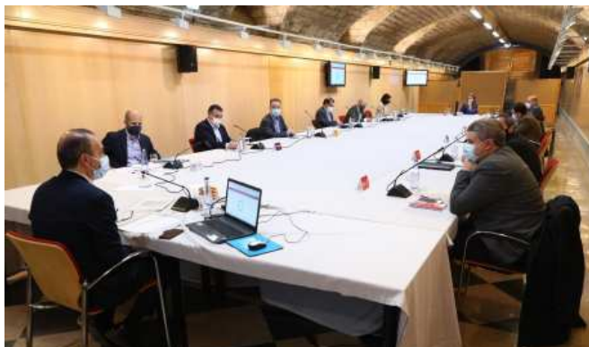
El grado de ejecución general puede consultarse en el Portal de Transparencia del Gobierno de Aragón

El grado de ejecución de la Estrategia Aragonesa de Recuperación Social y Económica alcanza el 84,68%. Representantes del Ejecutivo autonómico, de los grupos parlamentarios, la Federación Aragonesa de Municipios, Comarcas y Provincias (Famcp) y las principales organizaciones empresariales y sindicales han mantenido un nuevo encuentro este jueves para analizar el nivel de cumplimiento de las 273 medidas acordadas el pasado mes de junio por todos ellos para hacer frente a las consecuencias de la pandemia en la Comunidad Autónoma.