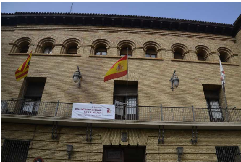
El Ayuntamiento ya luce la pancarta del 8M.

El Ayuntamiento de Barbastro se suma a la celebración del 8 de marzo, Día Internacional de la Mujer con varios actos, entre ellos la lectura de un manifiesto aprobado ayer por mayoría en Junta de Portavoces, y el ciclo de cine "Mujeres de cine 2021", organizado por el Área de Bienestar Social.