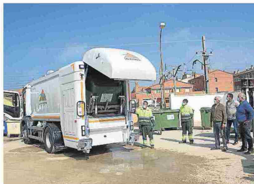
Nuevo camión limpieza para contenedores en Monegros.

La inversión de 150.500 euros es la primera de un plan de mejoras