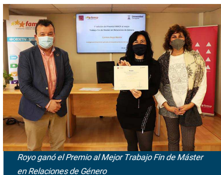
Royo ganó el Premio al Mejor Trabajo Fin de Máster en Relaciones de Género

Entonces, una de las conclusiones fue que con la edad aumenta la Inteligencia Emocional, mejoramos la autoestima, el autoconocimiento, la valoración de nosotras mismas y, por tanto, nos permite unos niveles superiores de aceptación de nuestro cuerpo con independencia de que este cuerpo que nosotras tenemos se adapte o no a lo socialmente establecido.