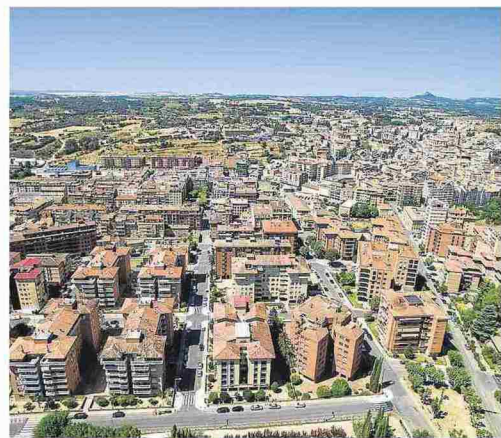
AYUNTAMIENTO DE BARBASTRO

En conjunto, se contemplan mejoras en la accesibilidad, regeneración y renovación urbana, peatonalización del casco antiguo, caminos escolares, creación de una red de itinerarios ciclistas, mejoras del autobús urbano y en la gestión de la