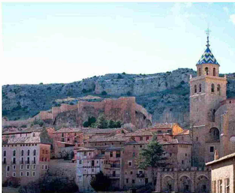
La Comarca de la Sierra de Albarracín con su capital a la cabeza tiene en el turismo su principal vector económico

Martínez recordó que el presupuesto de la Comarca de la Sierra de Albarracín se aprobó hace un mes y que contó con el apoyo de los grupos del PP, PAR y CHA. El Partido Socialista votó en contra.