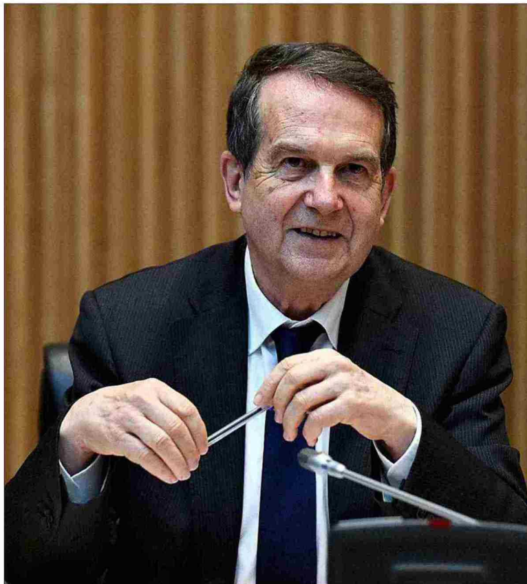
El presidente de la Federación de Municipios, Abel Caballero, en una comparecencia en el Congreso.

De hecho, los alcaldes están dispuestos a movilizarse e incluso a