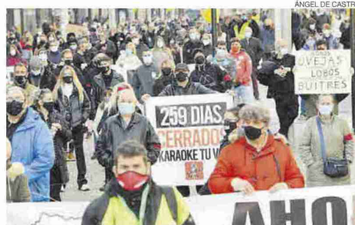
►► Manifestación de los hosteleros, en Zaragoza, el pasado diciembre.

El Gobierno de Aragón también ha negociado estas ayudas con los propios hosteleros y con la patronal de empresarios y tras meses y sema-