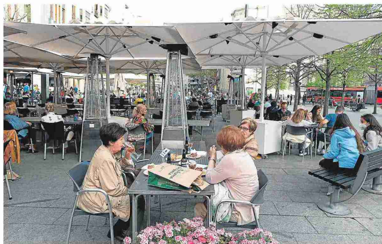
Las terrazas de la plaza de España, en el centro de Zaragoza, ayer. FRANCISCO JIMÉNEZ