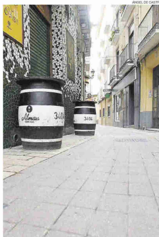
►► Una calle de El Tubo, vacía en el periodo de las Fiestas del Pilar.

Según Marteles, el criterio de reparto en base a descenso de facturación «es el más objetivo, aunque creemos que debería haberse modulado dando prioridad a los negocios que tuvieron pérdidas en el 2020, por entender que su viabilidad está más comprometida que la de aquellos que tuvieron beneficio. No obstante, reiteramos nuestra satisfacción con el plan en su conjunto y su vocación inclusiva, agradecemos los esfuerzos presupuesta-