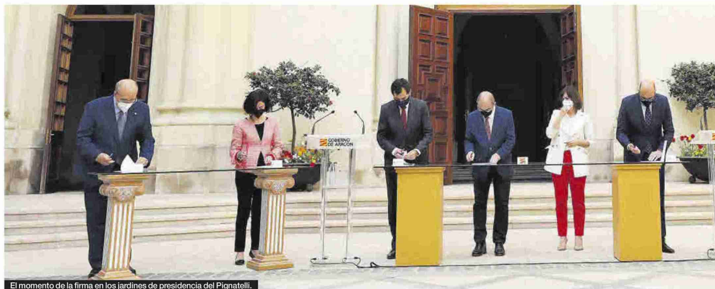
El momento de la firma en los jardines de presidencia del Pignatelli.