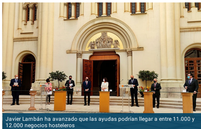
Javier Lambán ha avanzado que las ayudas podrían llegar a entre 11.000 y 12.000 negocios hosteleros

El Gobierno de Aragón ha dado a conocer este martes las cifras de su plan de rescate al sector de la hostelería, uno de los más afectados por la crisis del coronavirus. Las ayudas están dotadas con 50 millones de euros y es la mayor movilización de presupuestos propios que la Comunidad ha hecho en toda su historia. El plan contempla una dotación mínima de 3.000 euros por negocio y se calculará bajo distintos criterios, tomando como base la reducción de operaciones declarada en el ejercicio de 2020 en comparación con las de 2019 y el volumen de pérdidas demostrado. Según ha avanzado el presidente aragonés, Javier Lambán, las ayudas podrían llegar a entre 11.000 y 12.000 negocios hosteleros.