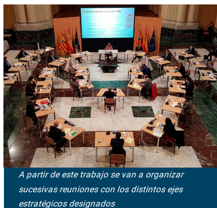
A partir de este trabajo se van a organizar sucesivas reuniones con los distintos ejes estratégicos designados