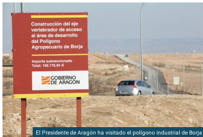
El Presidente de Aragón ha visitado el polígono industrial de Borja

El departamento de Economía, Planificación y Empleo ha convocado subvenciones dirigidas a municipios aragoneses que les permitirán impulsar inversiones en infraestructuras que fomenten la actividad empresarial en sus localidades. El Boletín Oficial de Aragón (BOA) publica este miércoles la convocatoria de estas ayudas, dotada con un presupuesto inicial de 1.450.000 euros, que podrá incrementarse hasta en un millón de euros más proveniente del FITE 2020 para inversiones en municipios turolenses.