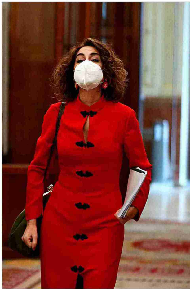
La ministra de Hacienda, María Jesús Montero, en el Congreso.

Lo cierto es que el Gobierno había prometido articular las ayudas al transporte urbano antes del 31 de