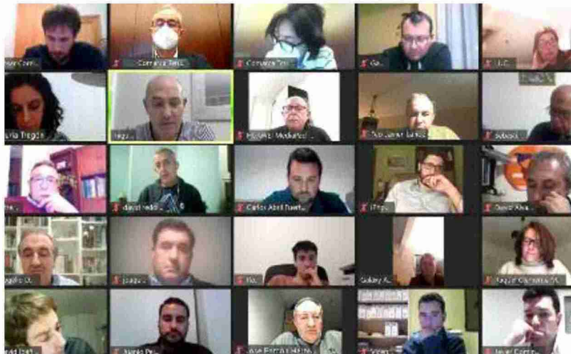
Sesión plenaria del Consejo Comarcal de la Comunidad de Teruel celebrada de forma telemática

Dentro del ámbito del turismo, otros 3.000 euros se destinarán a promoción turística, y otros 2.500 euros para la remodelación de la página web de la Comarca.