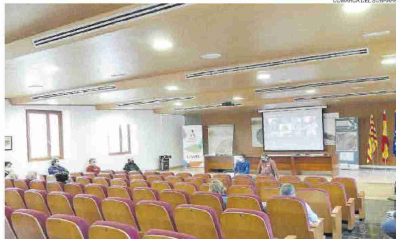
► Taller de desarrollo rural celebrado en la comarca el pasado 18 de marzo.

Ahora y hasta el 15 de abril, los habitantes del Sobrarbe podrán participar también en la realización de este diagnóstico, aportando su visión en los ámbitos de turismo, patrimonio y desarrollo ru-