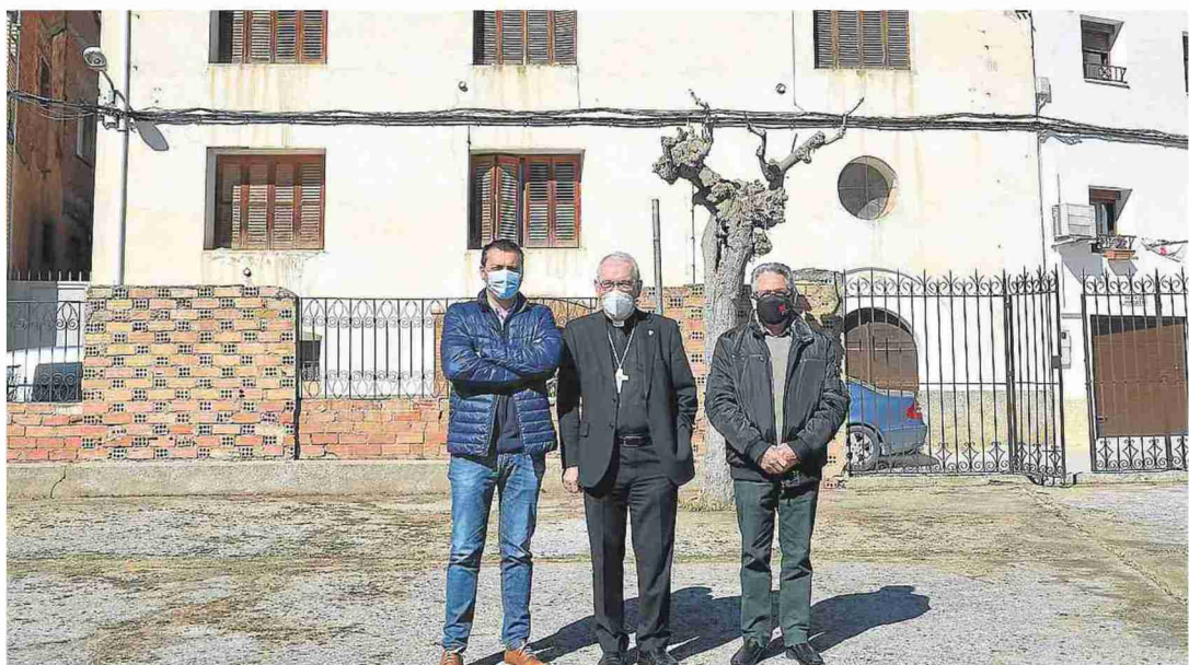
AYUNTAMIENTO DE SAN ESTEBAN

Se ubicarán en el patio de la guardería parroquial cedido por el Obispado, donde los residentes compartirán servicios