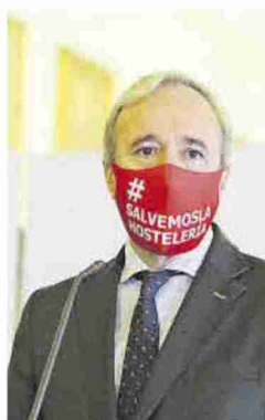
►► El alcalde, Jorge Azcón.

Sobre la posibilidades de que el Ayuntamiento de Zaragoza pueda aportar el 20%, es decir 10 millones de euros, el primer edil aseguró que es «evidente» que no hay dinero porque cuando se aprobó el presupuesto «no se sabía que iban a hacer un plan de