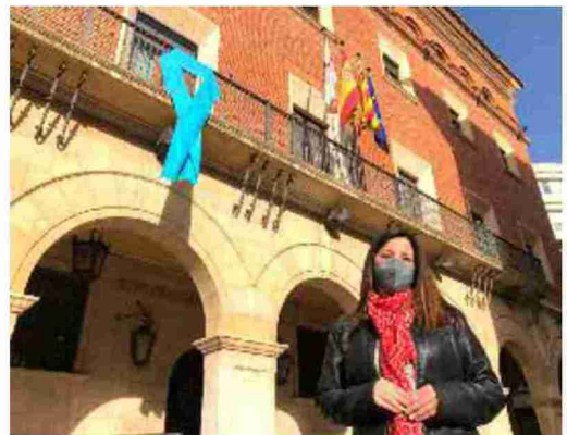
La diputada Ana Cristina Lahoz, con el lazo azul del balcón al fondo

nes que atienden de una forma u otra a este colectivo, como ASAPME, la Asociación Pro Salud Mental con sedes en el Bajo Aragón y en la capital de la provincia, y la Asociación Asperger y TDA's de Aragón. Con el Día Mundial de Concienciación sobre el Autismo, se pretende visibilizar las barreras y la falta de oportunidades de las personas con autismo, sobre todo en el acceso a la educación y al empleo, que no son solo un derecho sino también factores clave para su calidad de vida.