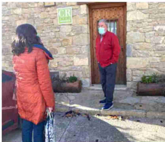
El Sistema Integral de Calidad Turística Española es un proyecto de mejora de la calidad de los destinos turísticos, promovido por la Secretaría General de Turismo

"Además, como el SICTED es un sistema de calidad basado en la mejora continua, las empresas adheridas deben participar cada año en acciones de formación y