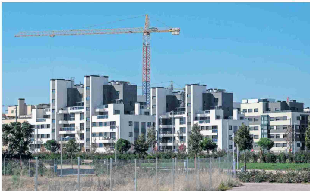
Una grúa en una zona de edificios en construcción en Madrid, el 27 de octubre.