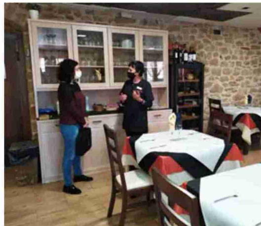
El Sicted requiere de una evaluación continua de la calidad del establecimiento