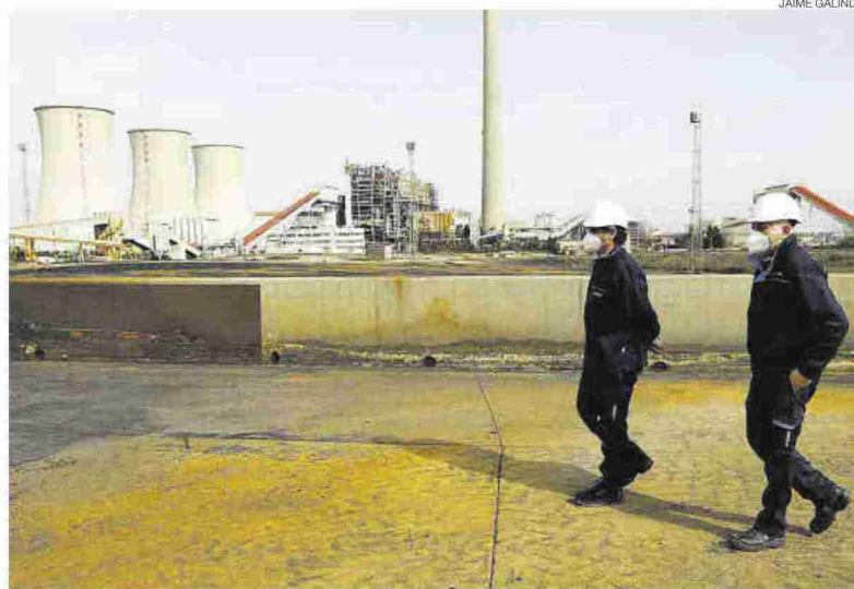
Obras de desmantelamiento de la térmica de carbón de Andorra, propiedad de Endesa.

Los proyectos ganadores se conocerán en un plazo máximo de