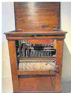
Órgano de Barbare, s. XIX. J.L.M.