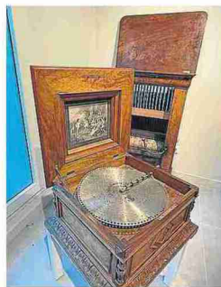
Caja de Música Suiza, 1890. J.L.M.