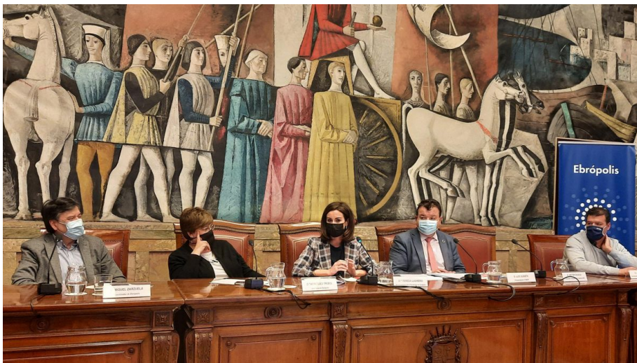
IV Foro de Municipios del Entorno de Zaragoza

Z aragoza y los municipios de su entorno constataron hoy la importancia de impulsar, a nivel local, la Agenda Urbana Española como vía para, de forma planificada e independientemente de su tamaño, desarrollar ciudades y pueblos sostenibles, resilientes, equitativos e innovadores.