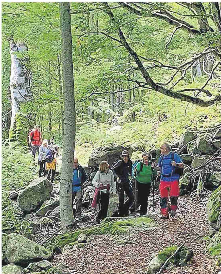
Salida por el Hayedo de Salanques.

Desde Montanuy, resaltaron "la especial la vivencia" que tuvieron 42 niños en la jornada infantil en la que intervino el grupo de iniciación al montañismo