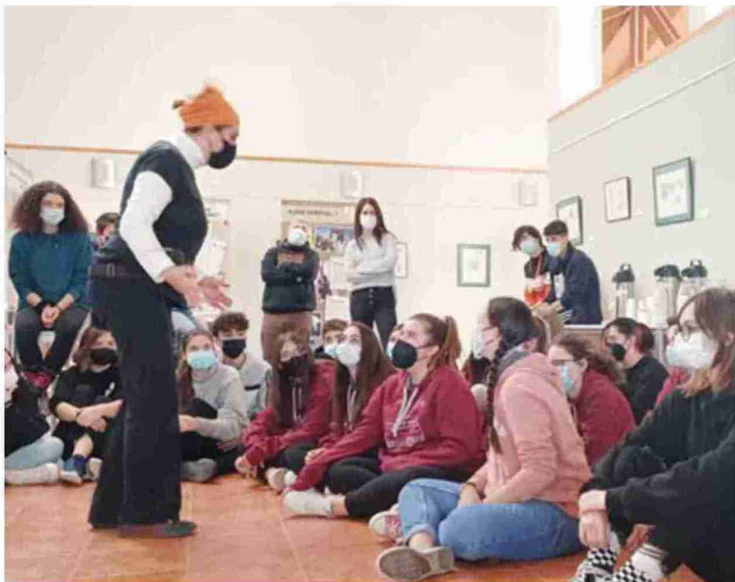
Los participantes, durante las actividades de dinamización realizadas este domingo.