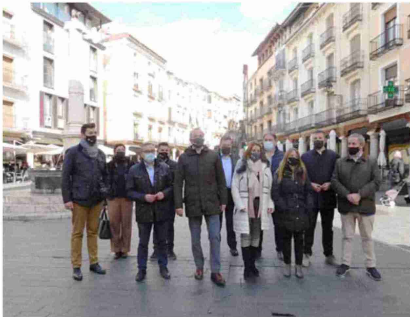
Jorge Azcón ayer en la plaza del Torico junto a dirigentes y cargos públicos del Partido Popular de Teruel

El candidato a presidir el PP de Aragón viajó ayer a Teruel para reunirse con la dirección del partido en la provincia, los cargos públicos y la militancia. Aseguró que su visita pretendía ser un agradecimiento al partido en Teruel por