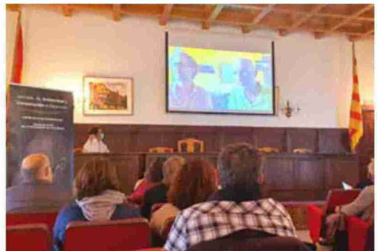
Cooperantes en Etiopía, durante su participación por videoconferencia

También hablaron de su trabajo en cooperación Cáritas y la Diputación de Teruel.