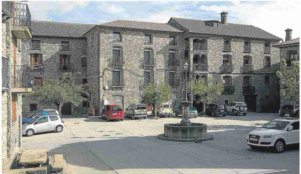
La plaza Mayor de Labuerda, con el edificio del Museo de Ingenios Mecánicos al fondo, con tres vehículos aparcados delante. LAURA URANGA

La niñez de José Luis Mur en Labuerda está marcada por su primera gran pasión, el fútbol. «Era portero, me decían que paraba bien, pero me resultaba difícil valorarlo dd chaval. A los 16