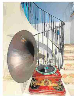
la Voz de su Amo. J.L.M.