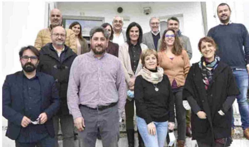
Participantes en la primera mesa transnacional del proyecto Livhes celebrada en Valença [Portugal]

La participación de la provincia en el programa transnacional se centra en la arquitectura de piedra seca