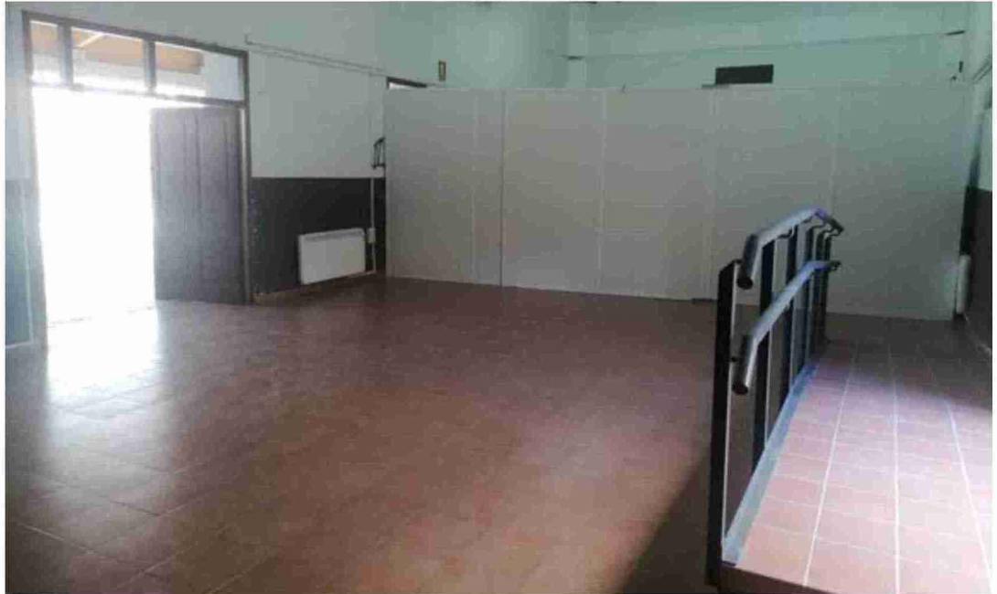
Vista del pabellón ferial de Sarrión desde la nueva puerta que se ha abierto y que accede directamente al antiguo salón de actos

El control de los aforos puede afectar en el número de visitantes que reciba la feria en esta vigésima edición, que otros años