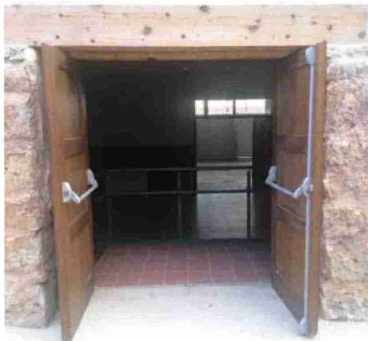
Nuevo acceso abierto al recinto ferial de Sarrión