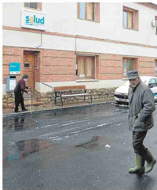
Entrada al centro de salud de Báguena la pasada semana. JAVIER BELVER

Desde que comenzó el proceso de vacunación, los vecinos entraron con fluidez al centro de salud. «Es de cajón. La vacuna da más seguridad. Y si no tienes seguridad, no puedes vivir tranquilo», seña-