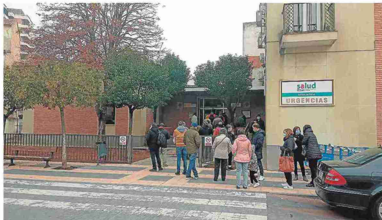
Colas en la calle de acceso al centro de salud de Barbastro.

El ente reclama al Gobierno de Aragón el compromiso de destinar partidas económicas suficientes para ejecutar la obra