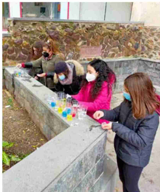
Algunas de las jóvenes, en una actividad en la calle