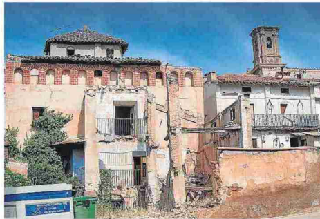
Casa solariega de la familia el pasado agosto. MACIPE