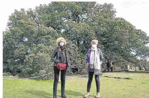
Foto de las dos vecinas propietarias de los terrenos donde se encuentra la Carrasca de Lecina.