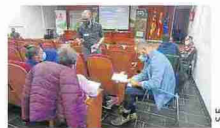
Participantes en uno de los talleres de trabajo.

El segundo de los talleres trabajó en torno al desarrollo rural, que abarca todo lo relacionado con el sector de la