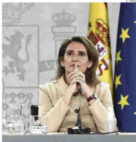
►► La ministra Teresa Ribera, ayer, tras el Consejo de Ministros

La inversión está asociada al Plan de recuperación para el periodo 2021-2023 y se complementa con los fondos estructurales o asociados a la política agraria común (PAC), según precisó Ribera, que enfatizó en que el objetivo principal del programa de recuperación de la España rural es el de intentar «no dejar a nadie atrás».