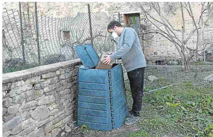
COMARCA ALTO GÁLLEGO

Usando una de las compostadoras domésticas repartidas.