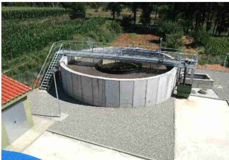
Depuradora de aguas residuales de Villastar, en la comarca Comunidad de Teruel

Publicada la convocatoria para entidades locales, que se financiará con el Fondo de Inversiones de Teruel