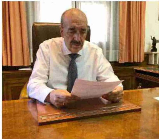
El presidente de la Diputación de Teruel, Manuel Rando

Rando también se refirió a los 10.000 millones del Plan de Me-