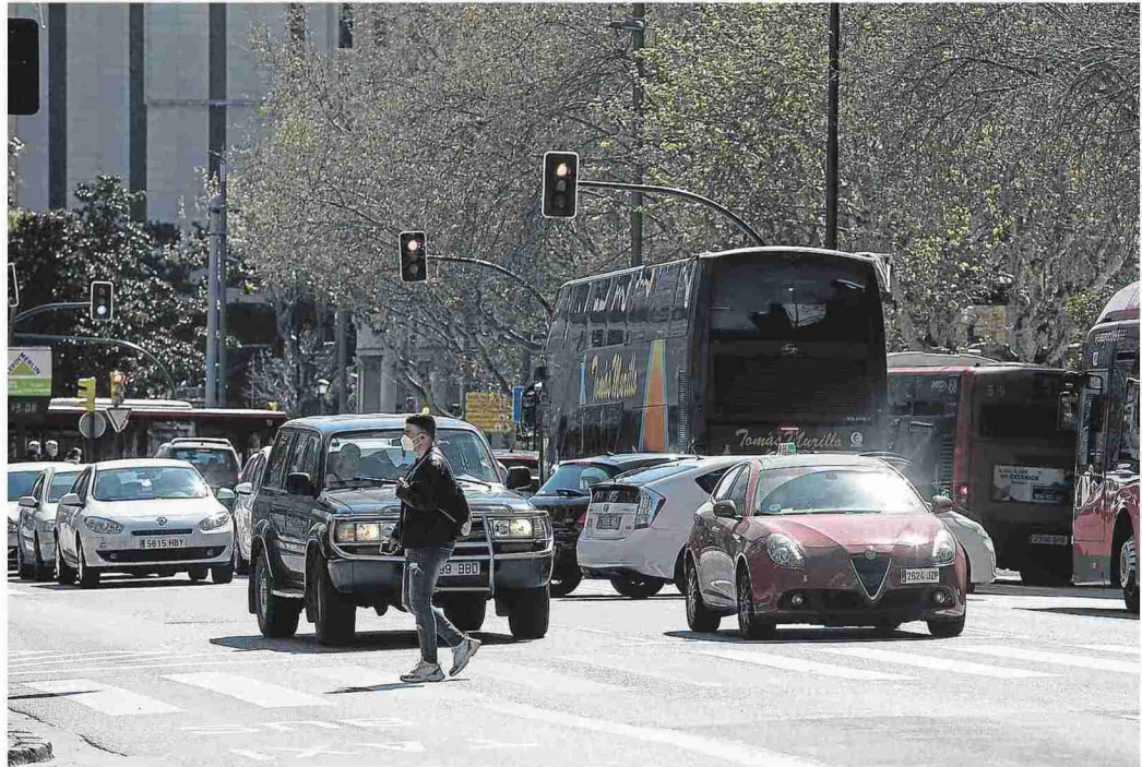
Las restricciones empezarán en el centro con unos márgenes «no traumáticos» para que los ciudadanos empiecen a acostumbrarse. OLIVER DUCH

En este sentido, desde el Ayuntamiento de Zaragoza explican que se quiere enfocar el proyecto