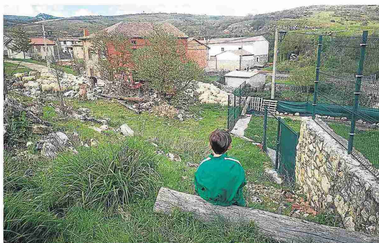
Uno de los únicos tres habitantes de Cubillo de Ojeda (Palencia).

El sesgo, insistió la vicepresidenta en la rueda de prensa posterior al Consejo de Ministros de ayer, está en el «envejecimiento» y la «masculinización» del entorno rural. La propuesta busca «avanzar en la igualdad de derechos de las mujeres y la generación de oportunidades en el entorno rural», especificó la ministra Ribera. «Las mujeres son las primeras que se van». La inversión debe corregir esa tendencia para «rejuvenecer» esos territorios, para lo que se plantea el «apoyo financiero al emprendimiento de las mujeres y de pro-