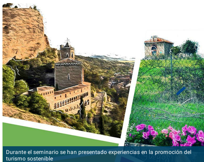
Durante el seminario se han presentado experiencias en la promoción del turismo sostenible

La Federación Aragonesa de Municipios Comarcas y Provincias (FAMCP) y la Fundación MUSOL han organizado este martes el seminario nacional online del proyecto SuSTowns en España. Una cita que ha podido seguirse de manera telemática y que ha contado con más de 140 inscritos de diversas comunidades autónomas como Aragón, Cataluña, Baleares, Extremadura, Comunidad Valenciana o Andalucía, así como participantes de Italia o Bruselas.