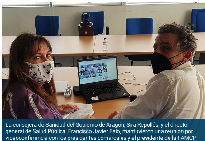
La consejera de Sanidad del Gobierno de Aragón, Sira Repollés, y el director general de Salud Pública, Francisco Javier Faló, mantuvieron una reunión por videoconferencia con los presidentes comarcales y el presidente de la FAMCP

La consejera Repollés insistió en varias ocasiones ante los representantes comarcales y municipales en una reunión con el director general de Salud Pública, Francisco Javier Faló, que “a lo largo del proceso de vacunación, desde el momento de su inicio, con una logística compleja y cambiante, hemos seguido estrictamente los grupos de priorización según las indicaciones del Ministerio de Sanidad, de forma que las vacunas se reparten en los municipios, de forma homogénea, secuencial y equitativa en función de los porcentajes de grupos de edad”.