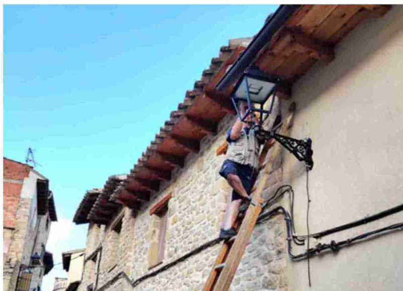
Un operario cambia la luminaria de una farola del casco urbano

Con todo, desde la Alcaldía enfatizaron que el ahorro energético en La Fresneda "se notará, no ahora, sino a partir del año que viene", y que "ese ahorro se traducirá en nuevas inversiones que revertirán en beneficio de los vecinos y del pueblo", añadió Fontanet. A estos menores costes en energía hay que añadir "lo que ahorraremos en cuanto pongamos en marcha el sistema de bombeo de agua mediante placas solares", añadió dijo el primer edil, quien resaltó que, "con lo que dejaremos de gastar, lo más probable es que podamos dedicar más recursos al manteni-