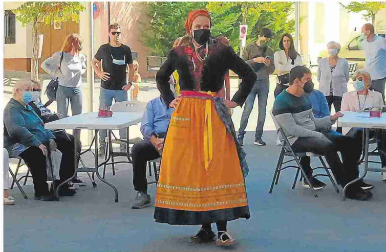
La Agrupación Folklórica Santa Cecilia actuó en la cita.

La programación se inauguró ayer con un recorrido por la iglesia de la Asunción y el folclore de Santa Cecilia