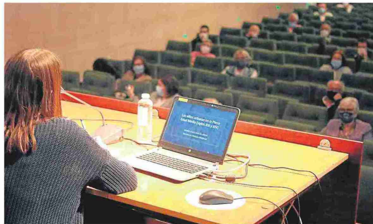
Las conferencias comenzaron ayer y se podrán disfrutar durante todo el día de hoy.

Otros de los temas a tratar en otra de las charlas será el papel de las mujeres de oscenses en la baja Edad Media.