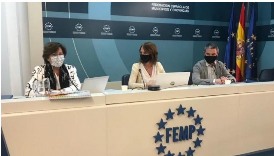
La ciudad duplica su oferta de mercados ambulantes en dos años 20M EP

Los mercados ambulantes de Zaragoza han duplicado su oferta en los dos últimos años. La oferta ha crecido en cantidad y en calidad con los objetivos de ofrecer a los consumidores productos de cercanía, potenciando la economía circular y apostando también por la digitalización.