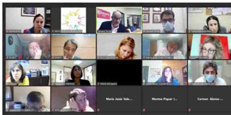
Participantes en la jornada informativa sobre las ayudas al comercio organizada por la Diputación y la Cámara de Teruel

Son seis los ejes de actuación: transformación digital del comer-