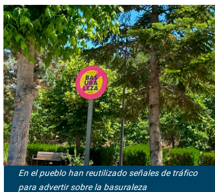
En el pueblo han reutilizado señales de tráfico para advertir sobre la basuraleza

Además, también han inventado señales propias en esas zonas de montaña, merenderos y otros lugares tan transitados por vecinos y visitantes y hasta han repartido un hueso de plástico con bolsas y un dosificador con una mezcla con vinagre para que aquellos vecinos con perro eviten ensuciar las aceras con las heces. Periódicamente se realiza la limpieza de los puntos negros del pueblo y del cauce del río Alpartir, por ejemplo.