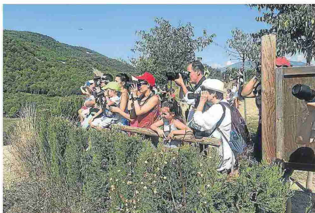
Participantes durante el avistamiento en el comedero de aves necrófagas.