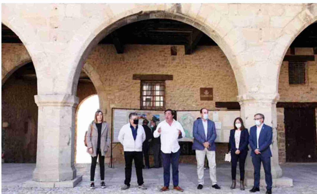
Un momento del acto de inauguración de la exposición de imágenes de Masías de Cantavieja con motivo de la celebración de la Feria Ganadera. Ayto. de Cantavieja