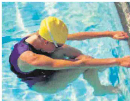
La natación, una de las actividades destacadas del programa de la Comarca.