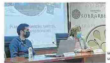
Presentación del Plan Estratégico de Sobrarbe.