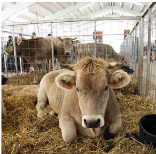
Uno de los animales que han sido expuestos en la Feria de Cantavieja