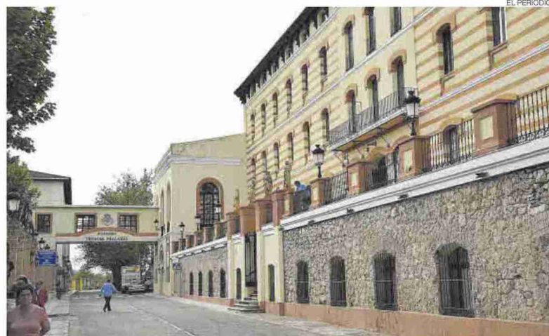
El balneario Termas Pallarés, en Alhama de Aragón, es uno de los más importantes de la provincia

Las ayudas se distribuirán en función del número de trabajadores, aquellos tengan menos de 50 empleados recibirán una cuantía inicial de 50.000 euros y para los