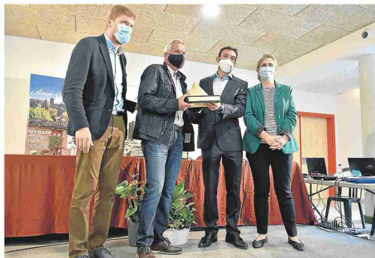
Acto de relevo entre Aínsa y Sobrescobio (Asturias) como nueva Capital de las Montañas. VERÓNICA LACASA

Para Iglesias, los conceptos de despoblación y de España Vacía han servido en los últimos años para poner los problemas del medio rural sobre la mesa, pero considera que han empezado a tener connotaciones negativas por lo que aboga por superarlos «ya que la pandemia ha acelerado un proceso que se empezaba a ver de que hay una atracción