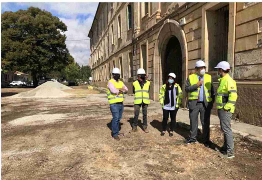
Visita del presidente de la Diputación Provincia de Teruel, Manuel Rando, y el diputado Diego Piñero durante su visita al Hogar de Teruel

Con ese mismo objetivo, recuperando en lo posible el elegante edificio del antiguo Hogar para la ciudad, se procederá a la iluminación de la fachada principal y del patio posterior con varios puntos de luz.