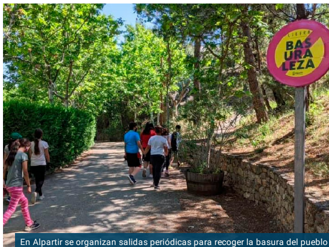
En Alpartir se organizan salidas periódicas para recoger la basura del pueblo

CRISTINA MORTE LANDA · 26 SEPTIEMBRE, 2021