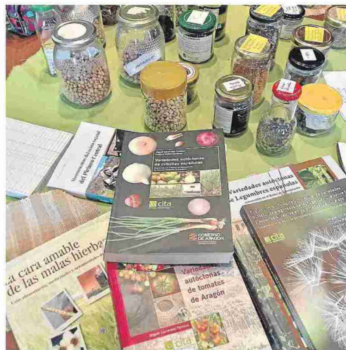
La exposición El valor de la huerta se exhibe en la biblioteca.

El programa concluirá, el 7 de noviembre, en Lagunarrota con visita al pozo-fuente que está entre los más antiguos de la comarca, cerca de la muela donde se asienta la población. Más tarde, visita guiada a la iglesia de san Gil Abad cuyos orígenes se remontan al siglo XII. Los Gaiteros del Somontano actuarán a las 11:30 horas mientras dure la degustación de postres.