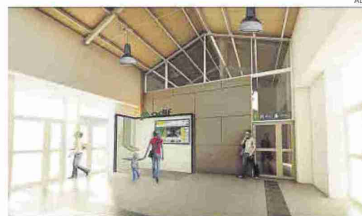
Recreación de cómo quedará la estación de Tardienta al concluir las obras.

Respecto al edificio de viajeros, la actuación principal será la remodelación de los aseos para adaptarlos a la normativa actual de accesibilidad. Para ello, se demolerán los existentes, ampliando uno de los pasillos que conecta el vestíbulo con la cafetería y eliminando el otro. También se instalará nuevo pavimento para