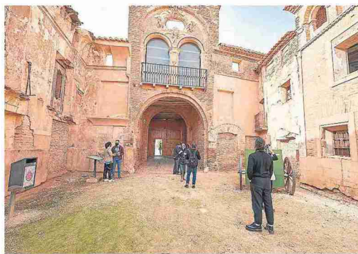
Visitantes en la entrada al pueblo viejo.

llones se puede consolidar la trama urbana actual e incluso plantear algún proyecto más», estima el regidor. La iglesia de San Martín de Tours es uno de los edificios en los que sería necesario intervenir con mayor urgencia, dado «el mal estado del ábside y la torre». Se trata del templo cuya torre mudéjar domina la silueta de las ruinas desde lejos. La fachada-portada del convento de San Rafael se tuvo que apuntalar hace algo más de un año y hay un