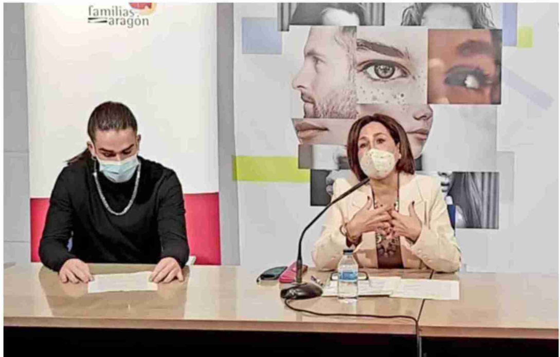
Presentación de los nuevos servicios que ofrece el Espacio de Atención para la Igualdad y la No discriminación la semana pasada

También han asesorado a algunos institutos cuando los tutores de algún alumno trans lo han pedido y les han puesto en contacto con otros centros educati-