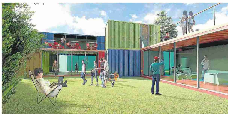
Así quedará el centro joven de contenedores con el patio interior triangular.

● Este espacio se ubicará junto a las instalaciones deportivas y está previsto que se ponga en servicio a finales de 2022