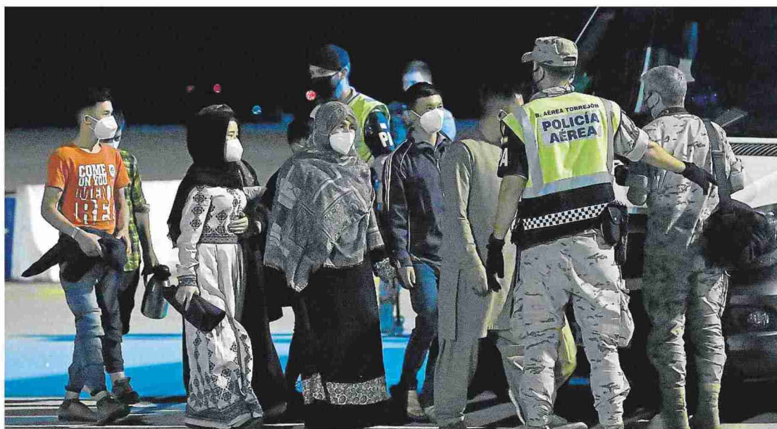
Segundo traslado de 150 afganos desde la capital de Pakistán a la Base de Torrejón.