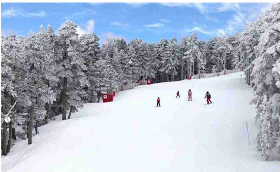
Este año se espera que se abran con normalidad las estaciones de esquí de Valdelinares y Javalambre, que el pasado año se cerraron por la pandemia de la covid

A través de este plan, explicó el presidente de la Comarca de Gúdar-Javalambre, el Inaem financió el 60% de estas contrataciones, el 40% restante corre a cargo de los municipios y de las diputaciones. La DPT aportó el 25% lo que supone 36.220 euros, la Comarca de Gúdar-Javalambre el 10% que supone 14.488 euros y los Ayuntamientos el 5%, que son 7.244 euros.