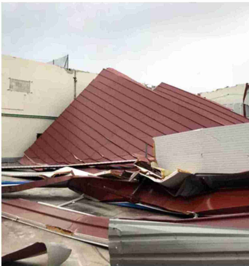
Así quedó el polideportivo de Aguaviva tras el temporal Gloria

La entrada principal al polideportivo estará generada por una franja de vidrio que unirá los dos