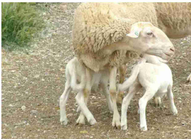
La Diputación de Teruel ha concedido las ayudas del programa de mejora ovina

Las entidades gestoras reciben las ayudas por la realización de actividades de mejora genética,