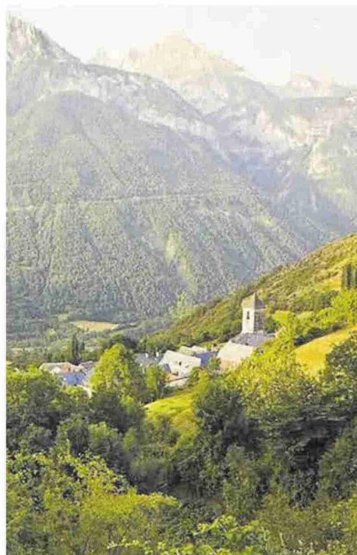
►► Gistaín se sitúa en la comarca de Sobrarbe, en Huesca.

«Este uso del territorio permite combinar la conservación del medio natural y el desarrollo de actividades económicas respetuosas con el medio ambiente y la pro-