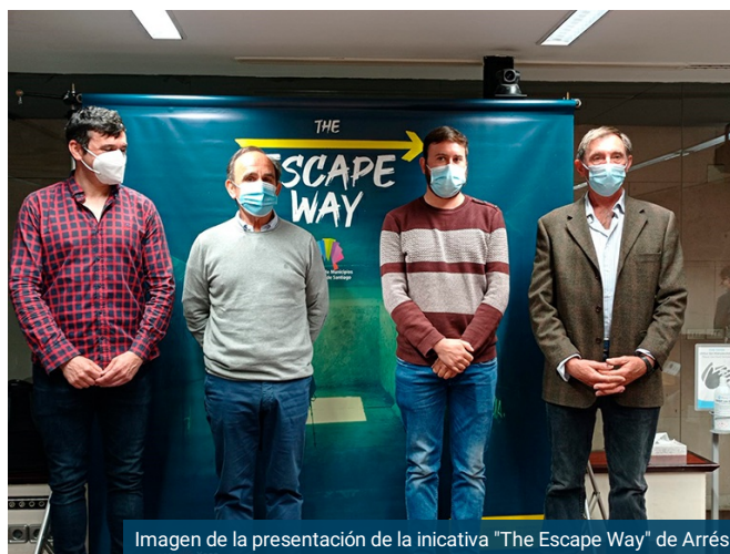
Imagen de la presentación de la iniciativa “The Escape Way” de Arrés

La localidad de Arrés, municipio de Bailo, será a partir del viernes uno de los seis “escape room” que ofrece el Camino de Santiago a lo largo de su vertiente francesa. Mediante la resolución de pistas y enigmas, el participante deberá encontrar una misteriosa y antigua reliquia que se oculta en el centro del pueblo. De esta manera, será la primera localidad aragonesa que se une a esta iniciativa.