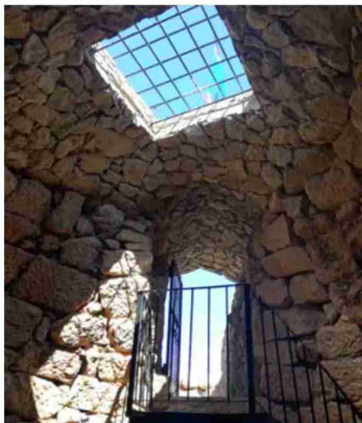
Nevera de Aguaviva, con el vano cuadrangular por el que se echaba la nieve.

produjo a pesar de que había sido el único de todos los monumentos que se incorporaron al expediente que había sido considerado como Monumento de Interés Local, tras la correspondiente solicitud por parte de la Corporación Local. El alcalde de