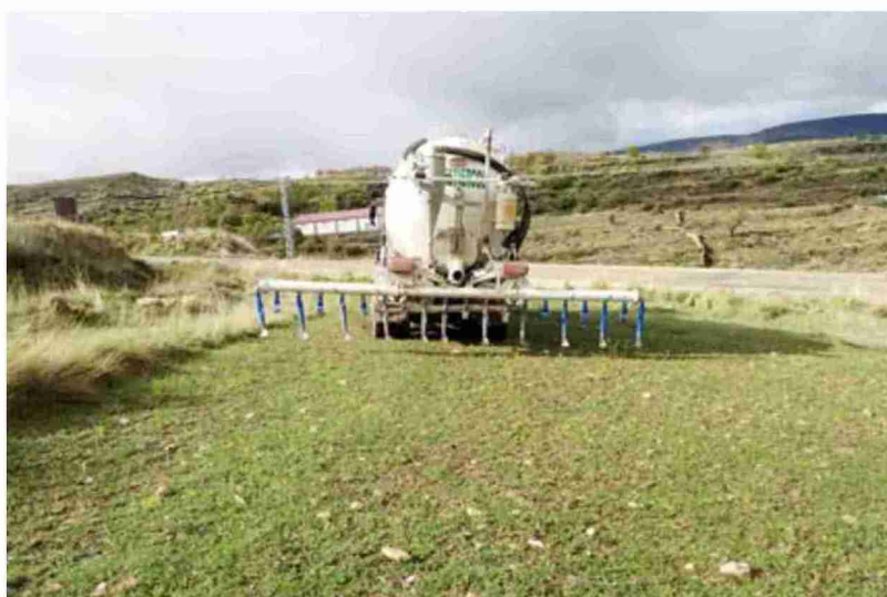
Uno de los nuevos aplicadores de purines adquirido por la empresa Servicios Integrales del Maestrazgo

De esta forma, los dos camiones de Servicios Integrales del Maestrazgo, ubicados en Castellote y Cantavieja, y la cisterna para tractor, ya disponen de estos aplicadores.