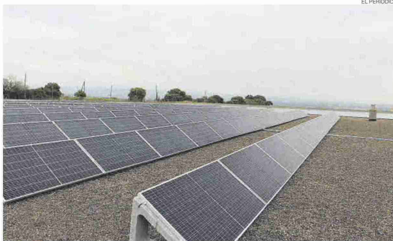
► Placas fotovoltaicas instaladas en el techo de un edificio.

La instalación solar diseñada puede llegar a producir 60 kW de potencia con el fin de conseguir el mayor ahorro de energía posible