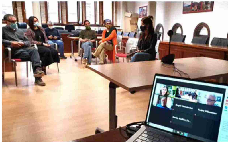
Reunión celebrada el pasado lunes entre la comarca, Adibama y el sector turístico. Comarca Andorra-Sierra de Arcos

Este territorio cuenta con interesantes atractivos abiertos al público como el Monasterio de Nuestra Señora del Olivar, los Baños de Añío, el museo minero MWINAS y dos parques culturales, el del Maestrazgo y el del río Martín. Además, ha señalizado varias rutas BTT y senderistas, y apuesta por The Silent Route, carretera panorámica que une la comarca bajoaragonesa con el Maestrazgo.