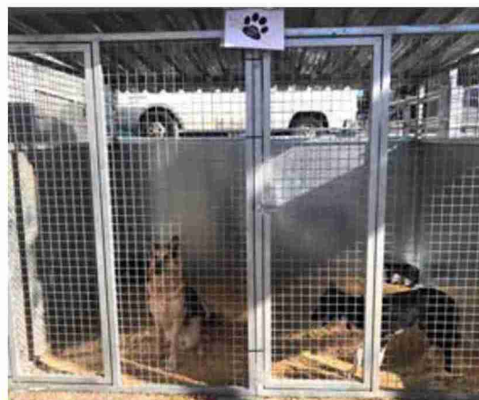
Cada año se organizan jornadas para fomentar la adopción de animales

El servicio se presta a través de la empresa adjudicataria Comercial Ríos Pascual que mantiene en el centro a los animales que no han sido reclamados por sus dueños y se encuentran bien de salud. Cada año -a excepción del año pasado por la pandemia- se organizan jornadas de puertas abiertas para fomentar la adopción entre los animales recogidos