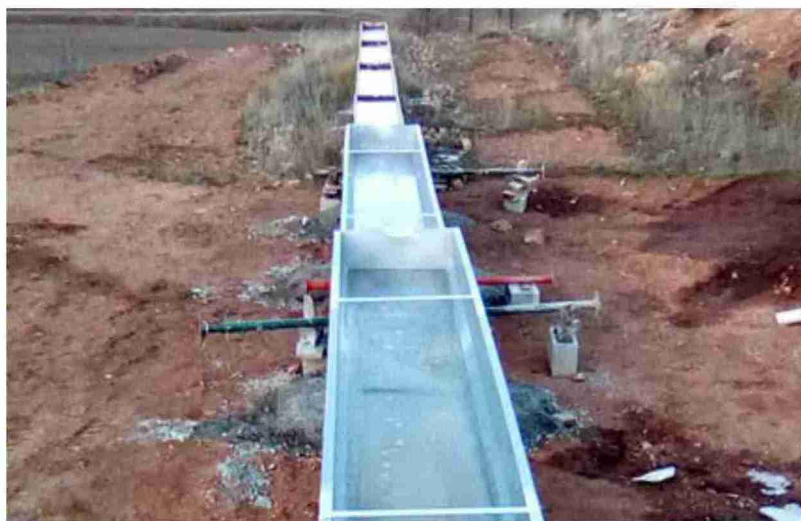
Ejemplo de instalación ganadera que puede acogerse a las subvenciones de la DPT para conservación

La cuantía se determinará a través de un baremo que prima a los municipios más pequeños. Así, para municipios de hasta 250 habitantes, la ayuda podrá ser de hasta el 70% con un tope máximo de 8.400. En el caso de los municipios con entre 251 y