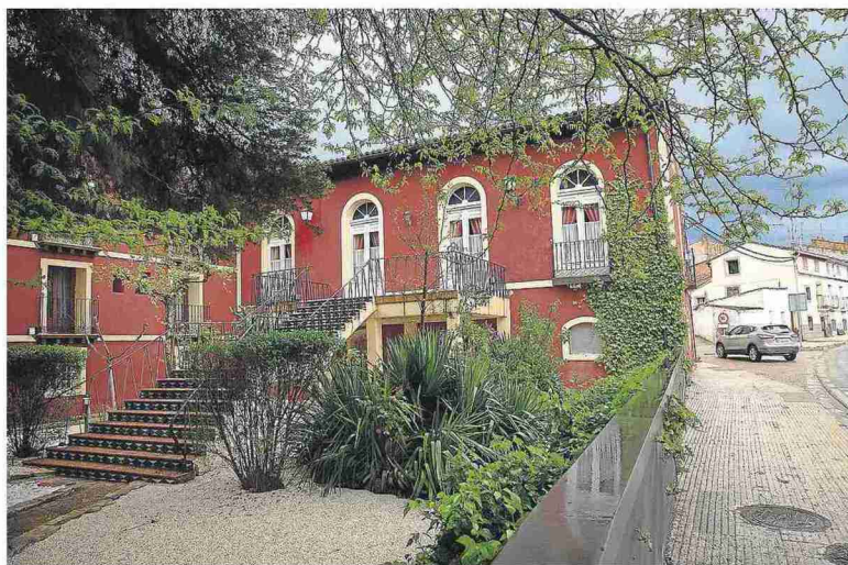
El balneario de Paracuellos de Jiloca ultimaba ayer los preparativos para reabrir mañana tras seis meses.