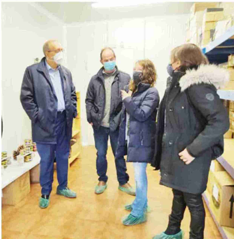
Rando, durante la visita a una empresa agroalimentaria localizada en Lagueruela y que ha contado con el apoyo del Leader

En opinión del portavoz de PP la propuesta planteada por el Gobierno de Aragón constituye un