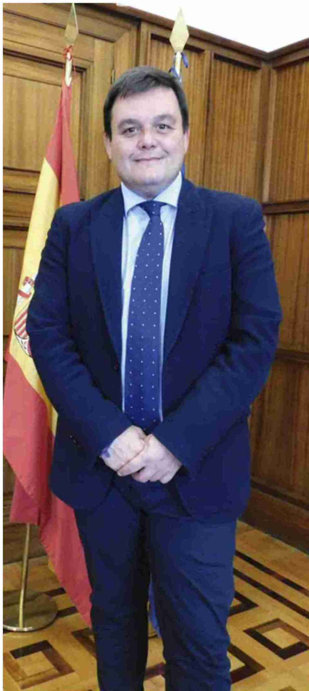
El secretario de Estado de Política Territorial, Víctor Francos