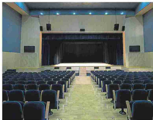
Auditorio del Centro de Congresos de Barbastro, donde se llevan a cabo algunas actividades culturales.

Quedan excluidas aquellas asociaciones o entidades que tengan suscrito un convenio de colaboración con el Ayunta-