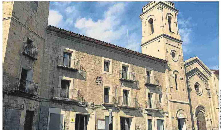
El edificio del Ceicu, situado en el paseo Barrón de la capital bajocinqueña.

● El edificio del centro cultural fagatino llevaba “más de una década en desuso” ● Esta obra en el Cegonyer se suma a las otras proyectadas en la misma zona