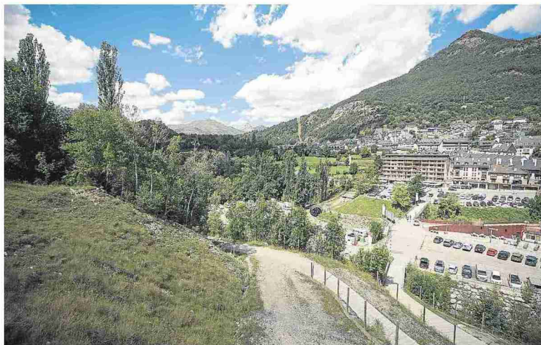
Panticosa cuenta con una buena conectividad gracias al plan de la DPH. LAURA URANGA

MEJORA DE LOS NEGOCIOS La vida también ha mejorado en Camporrells tras la llegada de la banda ancha. Este municipio, que goza de buen estado de salud sobre todo en las épocas estivales, fue de los primeros en acogerse al plan de banda ancha de la Diputación Provincial de Huesca. El objetivo fue hacer más fácil el día a día de las granjas asentadas en la zona, que representan un alto porcentaje de su economía. «El salto de un internet prehistórico a una conexión ágil era una necesidad apremiante para ellos, porque ya cuentan con sistemas de producción informatizados», re-