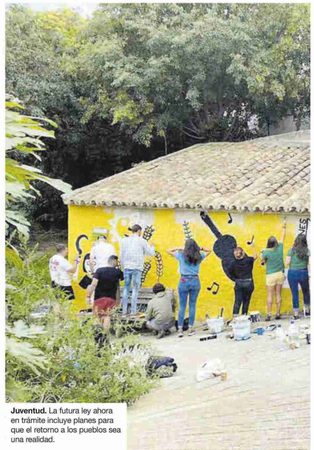
Juventud. La futura ley ahora en trámite incluye planes para que el retorno a los pueblos sea una realidad.

La agroindustria es otra de las áreas en las que destaca Aragón y que los poderes públicos se comprometen a promover «como elemento dinamizador y generador de empleo en el medio rural».