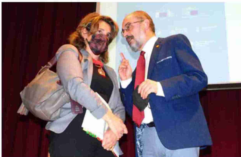
El presidente Lambán comenta algo a la ministra Ribera tras participar juntos en una mesa de debate

Ribera se expresó así en un multitudinario encuentro con la empresa, inusual en Teruel por la cantidad de medios que había de fuera de la provincia y más interesados en temas nacionales, con motivo de la celebración en la capital turolense de las jornadas El Futuro de la España Despoblada , organizadas por La Moncloa en el marco de la estrategia estatal España 2050 junto con otras instituciones, en las que también intervinieron la ministra