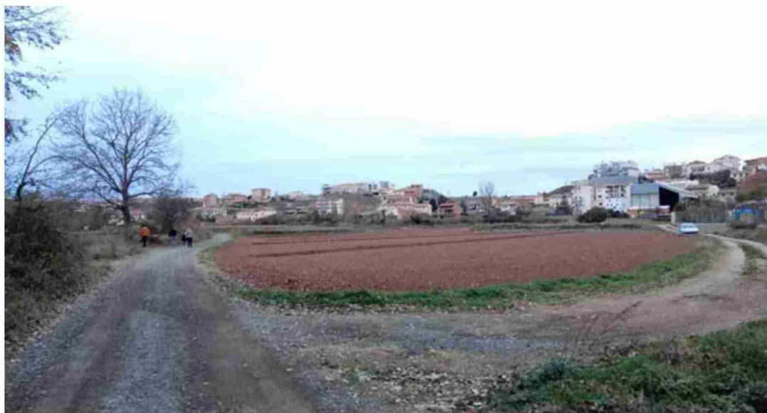
Barrio turolense de San Blas, uno de los núcleos urbanos a los que se ha concedido una ayuda para la redacción del proyecto de su estación depuradora de aguas