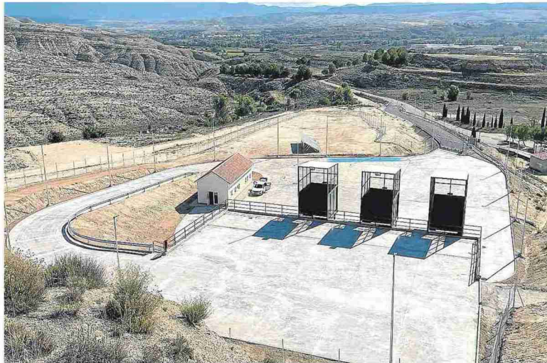
La planta de transferencia de Calatayud, que se inició el pasado marzo, ya está lista. DPZ

El objetivo inicial de la DPZ era que todas las plantas estuvieran terminadas a finales de este año, pero la complejidad de la tramitación y la crisis sanitaria han retrasado el calendario. Con este pro-