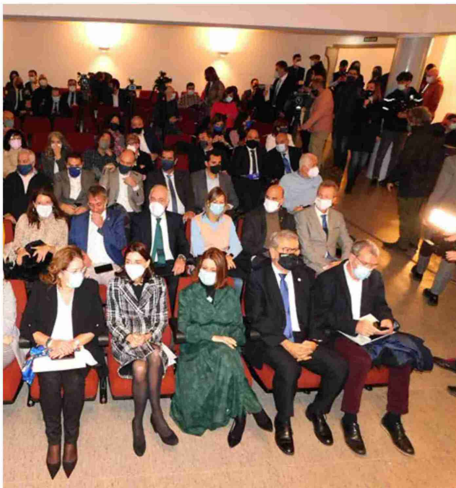
Autoridades y asistentes a los Diálogos de Futuro que acogió ayer el salón de actos del Campus de Teruel

Adicional 115 del proyecto de Ley de Presupuestos Generales del Estado de 2022, que determina la voluntad del Gobierno de "facilitar que en las tres provincias en las que existe una densidad de población que permite aplicar" estas ayudas, pueda haber un "acompañamiento al empleo" mediante "incentivos fiscales" o "bonificaciones a la Seguridad Social".