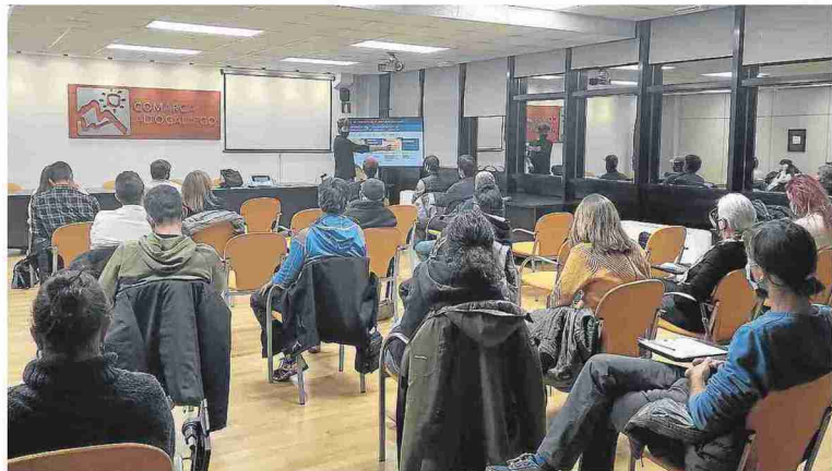
Imagen de la tercera reunión del proyecto en Sabiñánigo.