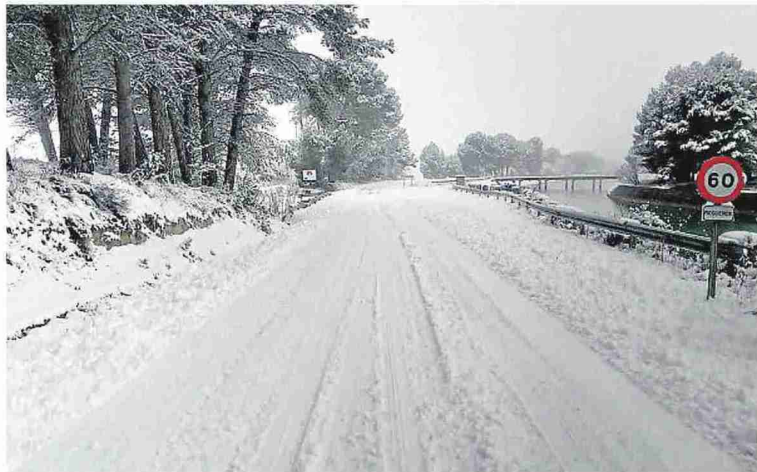
Una de las carreteras altoaragonesas antes del paso del dispositivo de vialidad invernal.