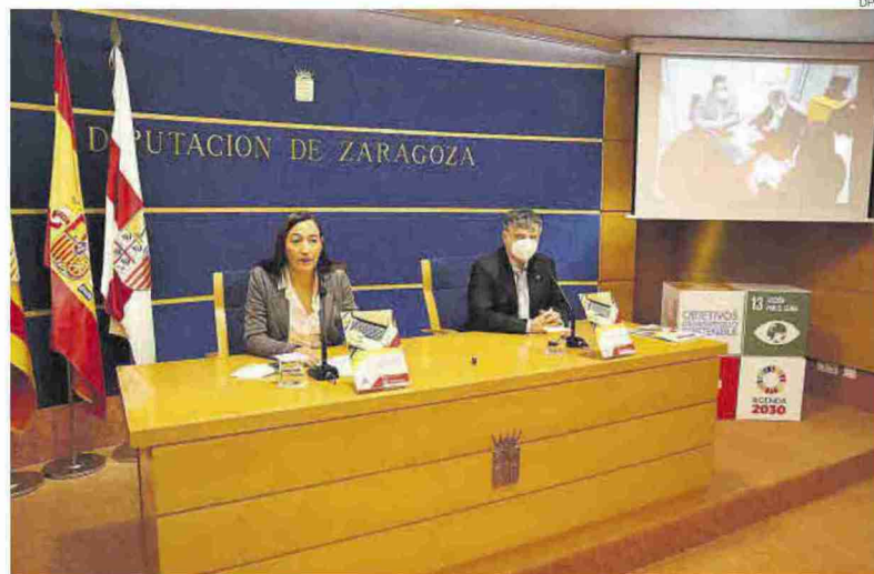
El nuevo servicio fue presentado este martes en la sede de la institución provincial.