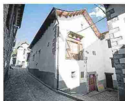
Calle de Borau. LAURA URANGA

Borau fue el primer municipio de la provincia, en noviembre de 2018, en el que se realizaron acciones encaminadas a la extensión de la banda ancha en su casco urbano. A camino entre el valle del Aragón y el de Aisa, cuenta con varias viviendas de turismo rural y empresas de turismo activo que se han visto beneficiadas por la mejora de la conectividad. «Ahora con la llegada de la banda