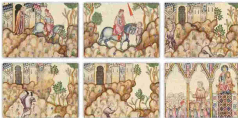
Ilustración de las Cántigas de la Virgen, obra literaria del rey Alfonso X El Sabio

José Antonio Nicolás señaló que se pidió a la Federación Española de Municipios y Provincias la incorporación de Rodenas a la Red de Pueblos y Ciudades Alfonsíes y que la respuesta fue afirmativa. "En Aragón pertenecemos a la Red de Pueblos y Ciudades Alfonsíes las localidades de Tarazona y Rodenas. En total pertenecen 58 localidades en toda España".