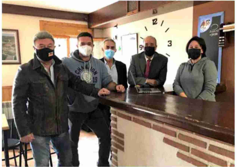
El presidente de la Diputación Provincial de Teruel, Manuel Rando, visitó ayer el multiservicio de Cuevas de Almudén

En Cuevas de Almudén, el presidente Manuel Rando quiso destacar también la apuesta del equipo de gobierno por la red de multiservicios rurales que, por sus propias características, son los establecimientos más benefi-