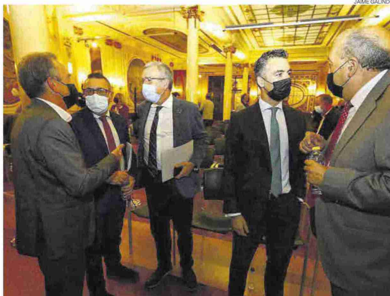
La jornada sobre Revitalización del Medio Rural contó con expertos y autoridades en la Caja Rural de Aragón.

«Es momento de rescatar todo el potencial del medio rural porque es un lugar de grandes oportunidades»