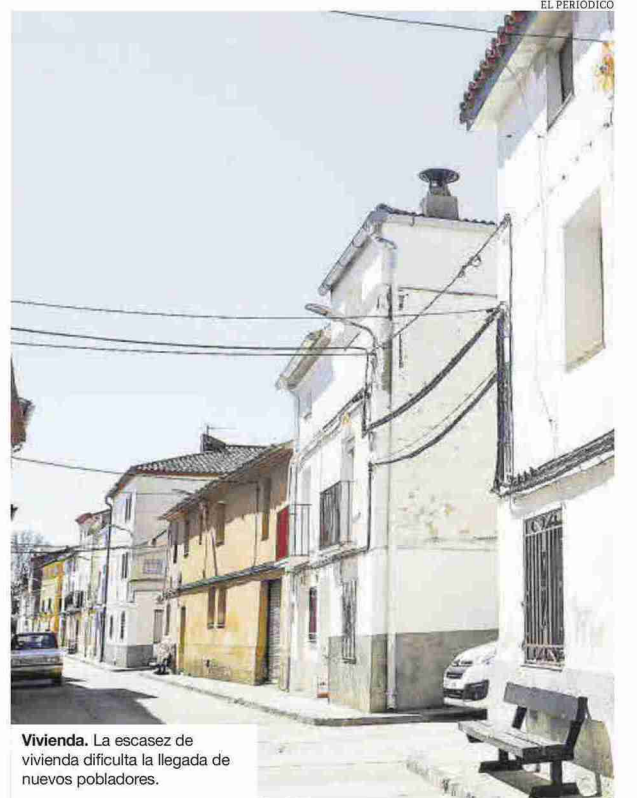
Vivienda. La escasez de vivienda dificulta la llegada de nuevos pobladores.