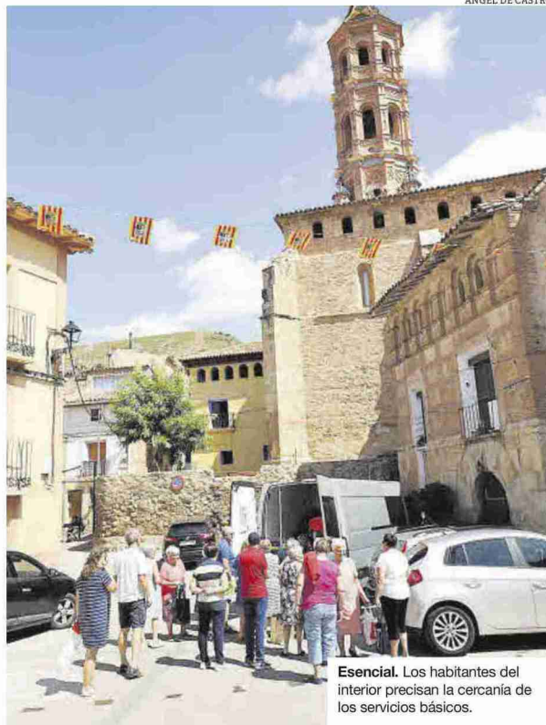
Esencial. Los habitantes del interior precisan la cercanía de los servicios básicos.

Las diferentes actuaciones para impulsar la economía rural van acompañadas de políticas favorecedoras de la instauración y seguimiento de los servicios básicos que el interior precisa. El pilar de la sanidad se ancla en una oferta sanitaria, en concreto, de Atención Primaria, y farmacéutica y dotación a los profesionales de la salud en el mundo rural de los medios tecnológicos para su ejercicio.