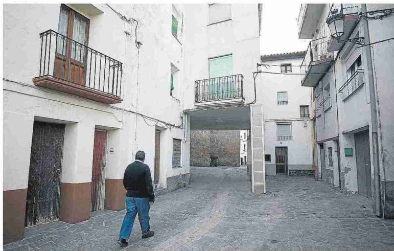
El plan de banda ancha ha propiciado que los vecinos de Camporrells mejoren su internet.