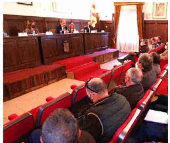
Reunión de la ministra, Teresa Ribera, con alcaldes de la Sierra de Albarracín

además fijar a los jóvenes serranos “Hay puestos de trabajo que no se cubren por falta de viviendas sociales. Los ayuntamientos deben tener un mínimo de viviendas para acoger a pobladores”. Otra petición que se hizo a la ministra fue la instalación de la banda ancha para ofrecer nuevas oportunidades de trabajo, la reforma de la PAC y la falta de pastos elegibles para que se incorporen jóvenes ganaderos.