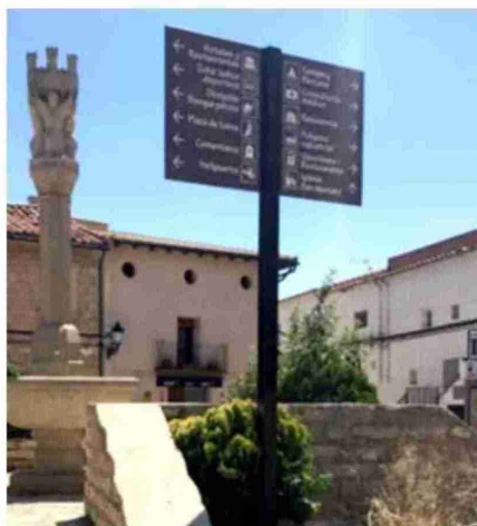
La Comarca va a mejorar la señalización turística de los municipios

Se trata de una actuación valorada en 76.000 euros y ya ha sido publicada en la Plataforma de contratación del sector público esta licitación para contratar el suministro y la instalación de señales y planos turísticos, reseña una nota de la comarca.